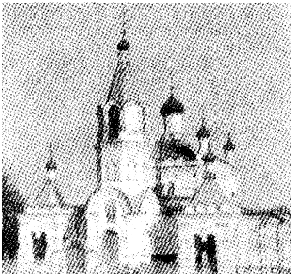
Ὁ ἱ. ναὸς τοῦ δικαίου Ἰῶβ τοῦ πολυπαθοῦς ἐν τῷ Νεκροταφείῳ τοῦ Λένινγκραντ.

67. Ἀμφιλόχιος, βικάριος τῆς περιοχῆς τοῦ Ἰενίσει ὁμοίως.