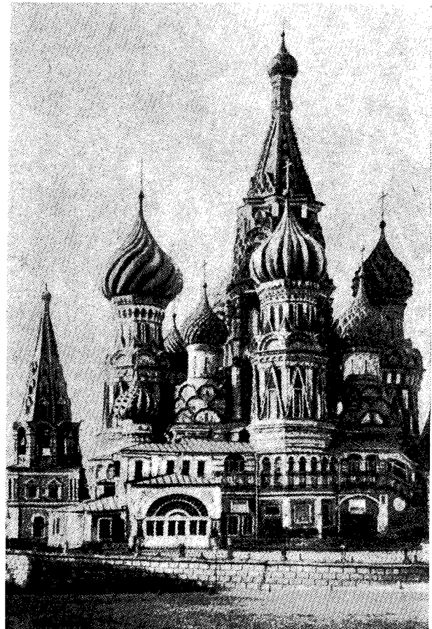
Ὁ ἐν Μόσχᾳ ἱερός ναὸς τῆς Θεομήτορος.

Ἄλλ' ἐὰν ὁ οὐράνιος Πατὴρ ἐκ τῆς ἀγάπης του πρὸς τὸν κόσμον παραδίδωσι καὶ θυσιάζῃ τὸν υἱὸν αὐτοῦ τὸν μονογενῆ, ἐκ τῆς πρὸς τὸν κόσμον ἀγάπης ὡσαύτως παραδίδει ἑαυτὸν ὁ υἱὸς τοῦ Θεοῦ τοῦ ζῶντος. Καὶ καθὼς ἡ θεία ἀγάπη σταυρώνει, οὕτω καὶ σταυ-