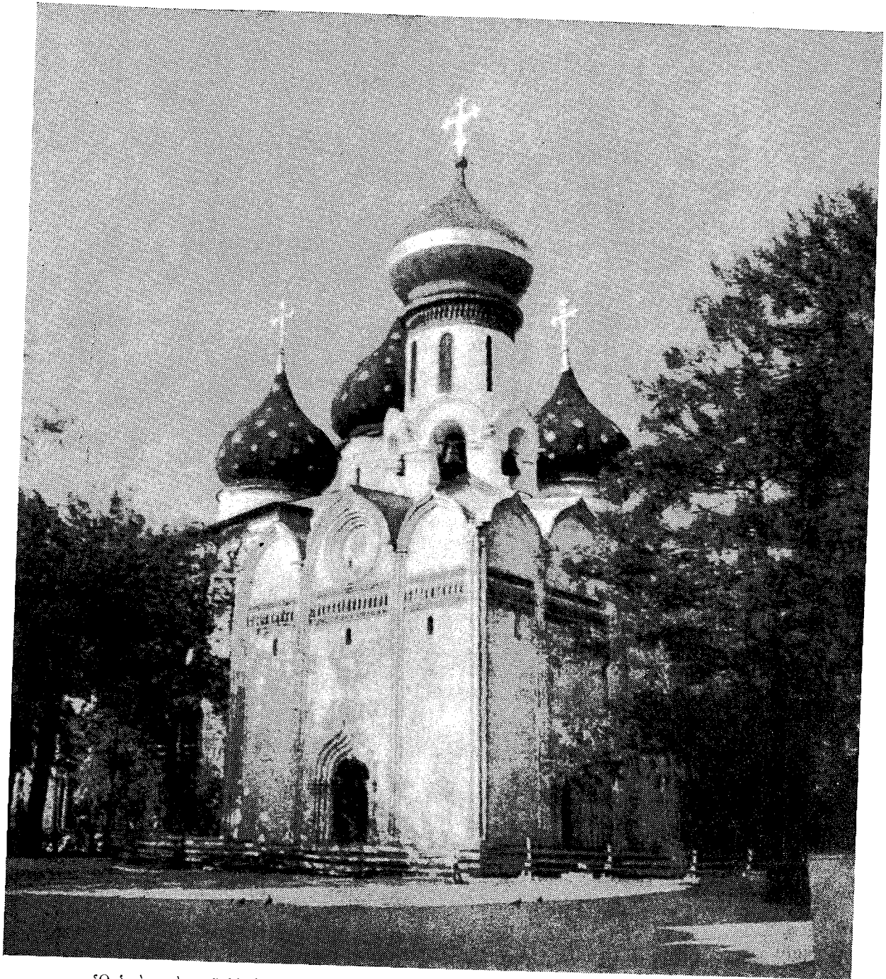
Ὁ ἱερός ναὸς τοῦ Ἁγίου Πνεύματος τῆς ἐν Ζαγκύρῳ Ἁγίας Λαύρας τοῦ Ἁγίου Σεργίου.