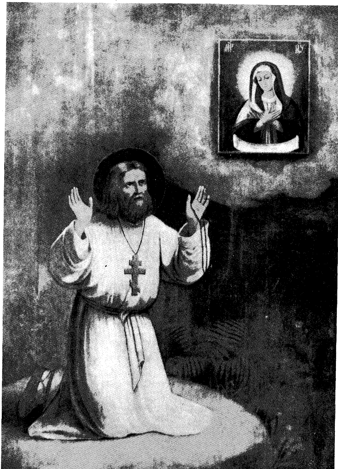
Ὁ ἅγιος Σεραφεῖμ τοῦ Σάρωφ.