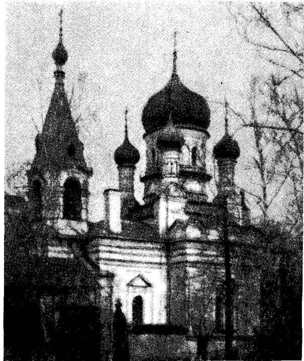
Ὁ ἰ. ναὸς τοῦ Ἁγίου Νικολάου εἰς Σολομενογὼρσκ πλησίον τῆς Μόσχας.

τὸν βαθμὸ τῆς πνευματικῆς ἀναπτύξεως τοῦ «τέκνου του» καὶ νὰ τοῦ δίδῃ τὴν ἀνάλογη πνευματικὴ τροφή. Ἔχει τὸ χάρισμα «νὰ διακρίνῃ τὰ πνεύματα» καὶ ξέρει νὰ ἀναγνωρίσῃ σ' ἕνα παιδί ἢ σ' ἕναν ἔφηβο ἐκεῖνον ποὺ ἐδέχθη τὴν κλήσι τῆς ἀσκητικῆς ζωῆς. Τὸν ἀποτρέπει ἀπὸ τὶς ὑπερβολές τοῦ ἀσκητισμοῦ, ἀπομακρύνει ἀπ' αὐτὸν τοὺς πειρασμοὺς καὶ τὸν προειδοποιεῖ γιὰ τὸν κίνδυνο μιᾶς ὑπερβολικῆς βίας ποὺ θὰ τὸν σπρώξῃ νὰ θελήσῃ πολὺ γρήγορα νὰ διεισδύσῃ στὰ θεῖα μυστήρια. Ἐκεῖνος καὶ μόνο ἐκεῖνος μπορεῖ νὰ μύησῃ τοὺς μαθητὰς του στοὺς ἀνωτέρους βαθμοὺς τῆς μυστικῆς προσευχῆς, καὶ τὸ «τέκνον» ποὺ κάνει κάτι χωρὶς τὴν ἔγκρισιν τοῦ πνευματικοῦ του «πατρός» γίνεται ἀσφαλῶς λεία τῶν δαιμόνων. Αὐτὴ ἡ μύησις ἐξ ἄλλου δὲν περιορίζεται μόνο σὲ συμβουλές καὶ σὲ