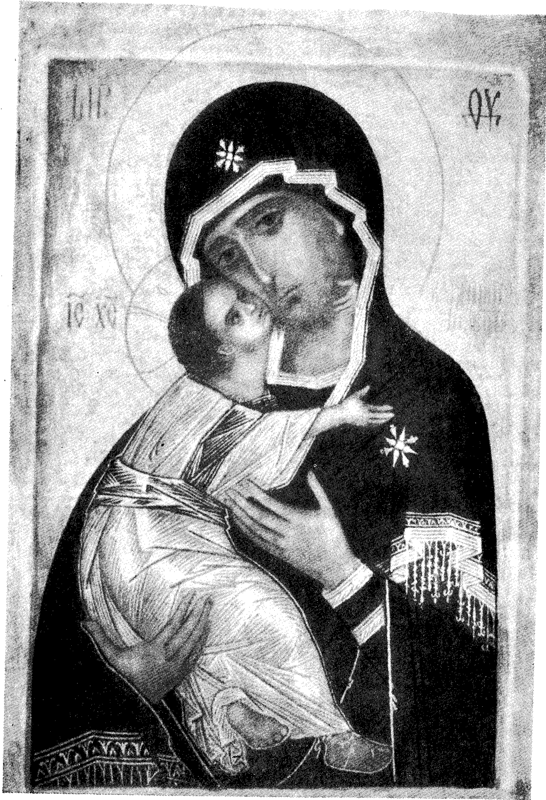
Ἡ εἰκὼν τῆς Θεομήτορος (Βλαδιμήρσκαγια).