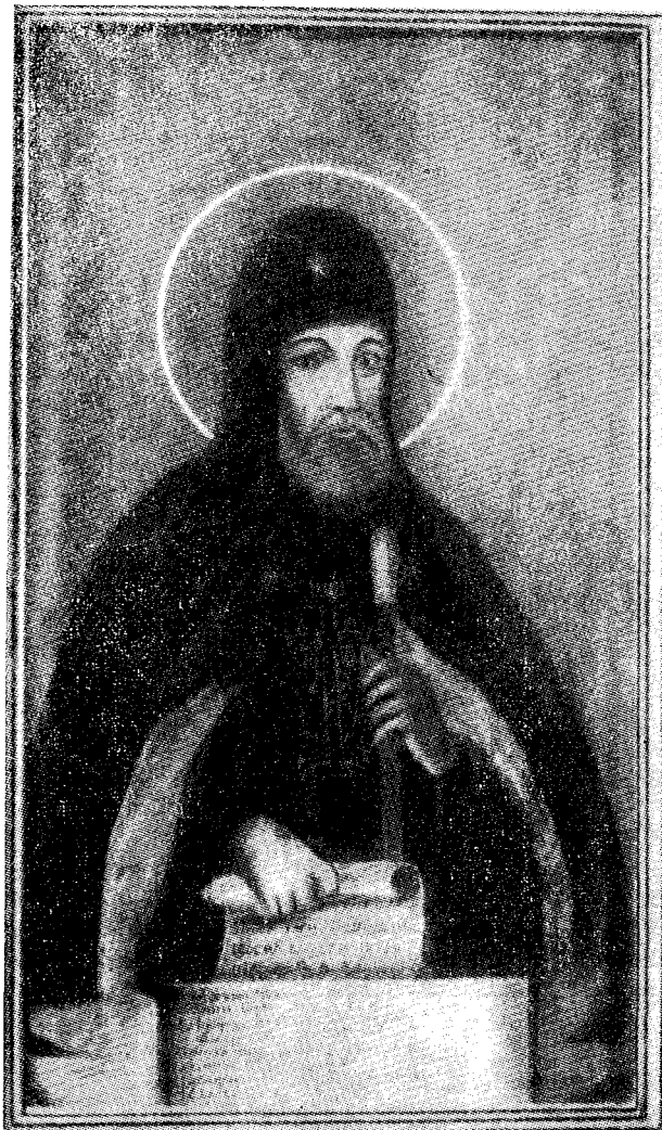
Ὁ όσιος Ἰώβ, ήγούμενος της ι. Μονῆς του Ποτσάεβ.

τελετουργικό νόμο, σ' έκδηλώσεις που καταντοϋν τό μοιραίο αίτιο του σχίσματος, που δέν άργεί να ρθῆ και δέν είναι εύκολο να ύπερνηκηθῆ. Ἄλλά και ή έσωτερική, βαθειά θεώρησι της πίστεως ζούσε, όπως τό είδαμε ήδη, στις πατριαρχικές ρωσικές οικογένειες και τις ένέπνεε με την πνοή της και έδινε σ' αυτές δύναμι για τόν άγώνα της ζωής κι' έσωτερικό φως και θερμότητα σ' όλες τις έκδηλώσεις της. Πόσες προσωπικότητες θρησκευτικά στερεές, ήθικα