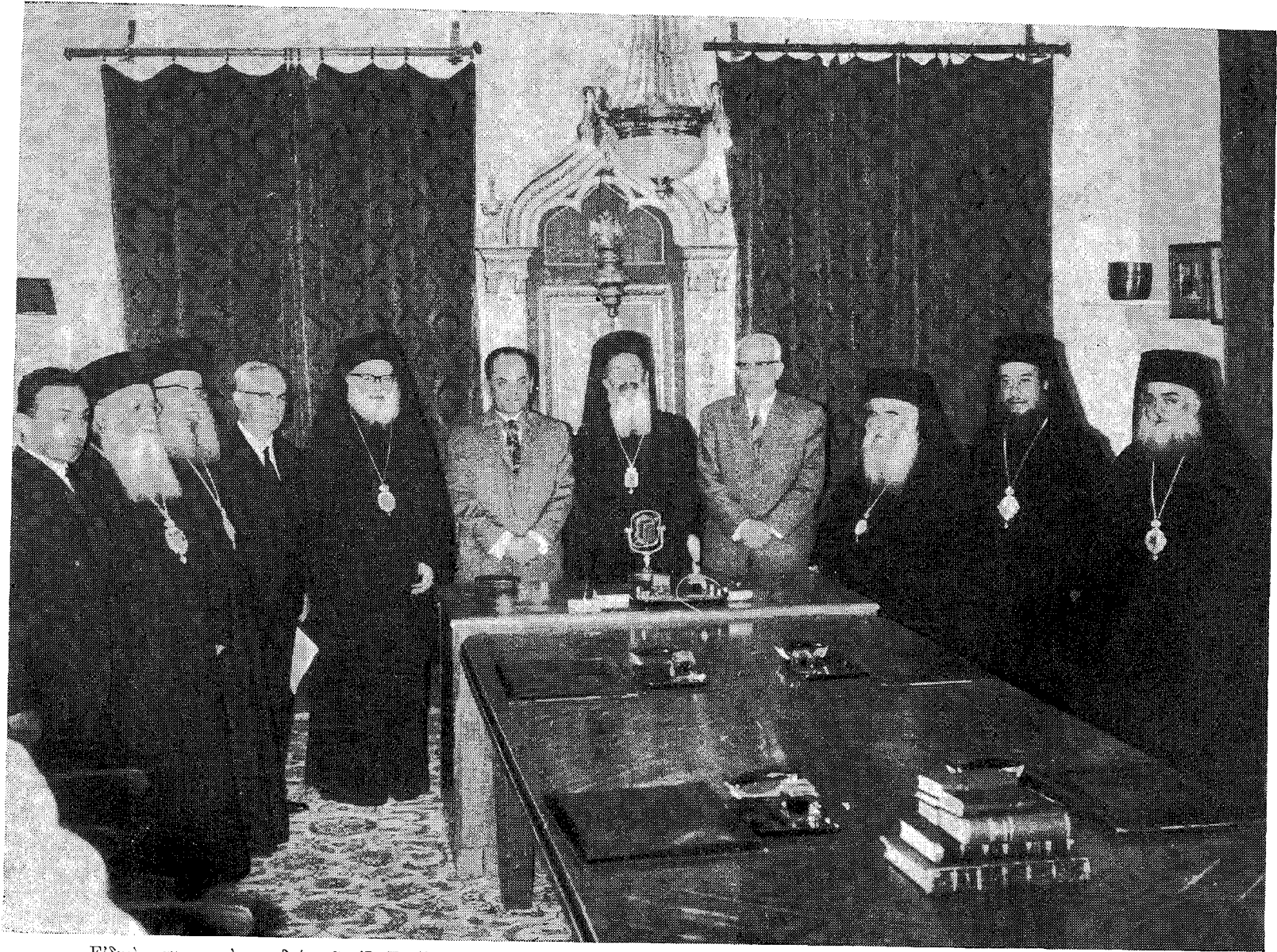
Ειδική πανηγυρική συνεδρία της 'Ι. Συνόδου, καθ' ἣν ὁ Ἐξοχώτατος Πρόεδρος τῆς Ἐθνικῆς Κυβερνήσεως κ. Γεώργιος Παπαδόπουλος ἀνεκοίνωσε τὴν ἀπόφασιν αὐτῆς περὶ ὀριστικῆς ρυθμίσεως τοῦ ἐφημεριακοῦ μισθολογικοῦ ζητήματος.