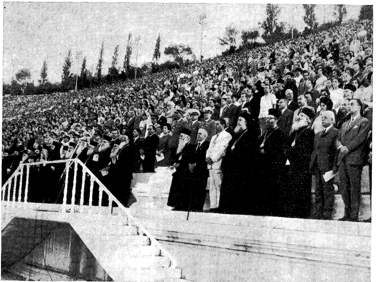
Ὁ Μικχαριώτατος Ἀρχιεπίσκοπος Ἀθηνῶν, τὰ μέλη τῆς Ἱερᾶς Συνόδου καὶ ἀντιπρόσωποι τῆς Ἐθνικῆς Κυβερνήσεως, τοῦ Στρατοῦ καὶ τῶν Ἀνωτάτων Πνευματικῶν Ἰδρυμάτων παρακολουθοῦν τὰς ἐορταστικὰς ἐκδηλώσεις τῶν Κατηχητικῶν Σχολείων.

Θὰ διερωτᾶσθε ἀσφαλῶς τί τὸ ἐξαιρετικὸ μᾶς προσέφερε τὸ Κατηχητικὸ Σχολεῖο, ὥστε νὰ σφραγίσῃ ἀνεξίτηλα τὴν μελλοντικὴ ζωὴν μας καὶ νὰ παραμένῃ τόσο ζωηρὰ χαραγμένο στὴ μνήμη μας. Θὰ συνοψίσω