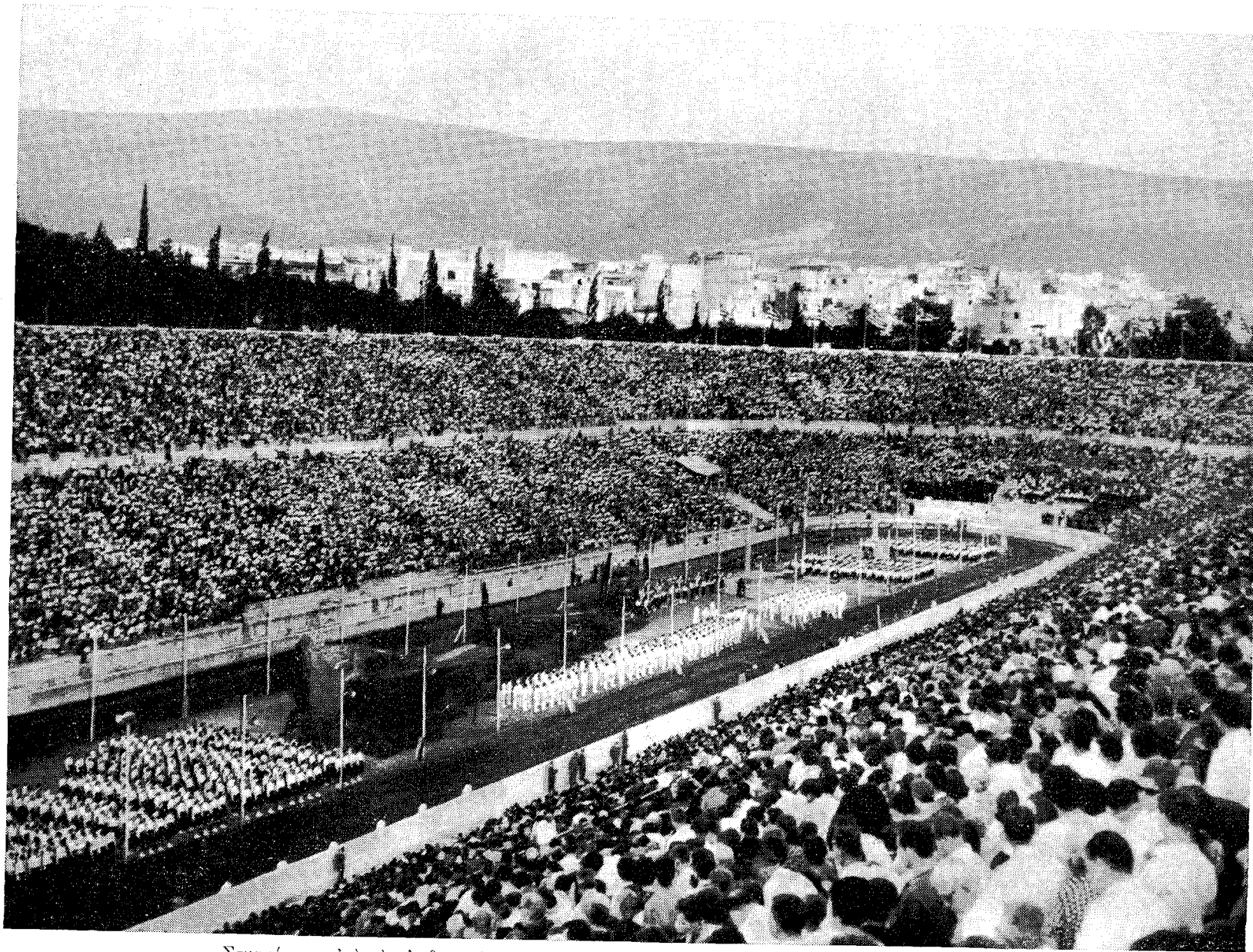
Στιγμιότυπον από την επιβλητικήν έορτήν των Κατηχητικῶν Σχολείων εἰς τὸ Παναθηναϊκὸν Στάδιον.