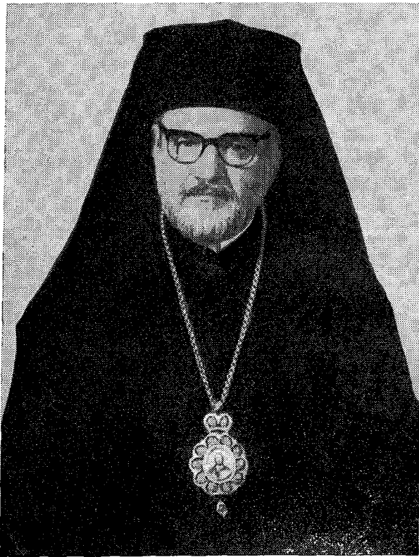
'Ο Πάπας και Πατριάρχης 'Αλεξανδρείας και πάσης 'Αφρικῆς κ. Νικόλαος ΣΤ'.

'Η τελετή τής 'Ενθρονίσεως του Μακ. Πατριάρχου 'Αλεξανδρείας κ. Νικολάου ΣΤ', 113ου κα-