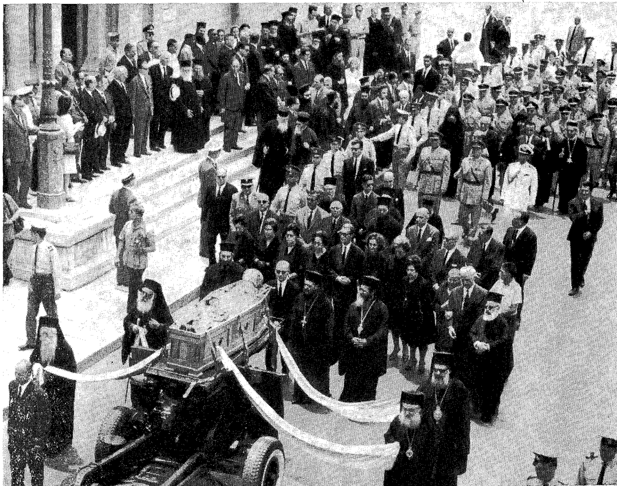
Η ΕΚΦΟΡΑ ΤΟΥ ΣΕΠΤΟΥ ΣΚΗΝΩΜΑΤΟΣ

Εἰς τὴν κηδεῖαν παρέστησαν ὁ 'Αντιπρόεδρος τῆς Κυβερνήσεως καὶ Ὑπουργὸς 'Εσωτερικῶν κ. Στ. Παττακός, οἱ Ὑπουργοὶ 'Εξωτερικῶν κ. Πιπινέλης, 'Εθνικῆς Παιδείας καὶ Θρησκευμάτων κ. Παπακωνσταντίνου, Δικαιοσύνης κ. Καλαμπογιᾶς, Βιομηχανίας κ. Κυπραῖος, Δημοσίας Τάξεως κ. Τζεβελέκος, Δημοσίαν Ἔργων κ. Παπαδημητρίου, Ἐμπορίου κ. Παπαδημητράκοπουλος, Ἐμπορικῆς Ναυτιλίας κ. 'Αθανασίου, Ἐργασίας κ. Πουλέας, ὁ Ὑφ/ργὸς Προνοίας κ. Λαμπίρης, οἱ Γενικοὶ Γραμματεῖς τῶν Ὑ-