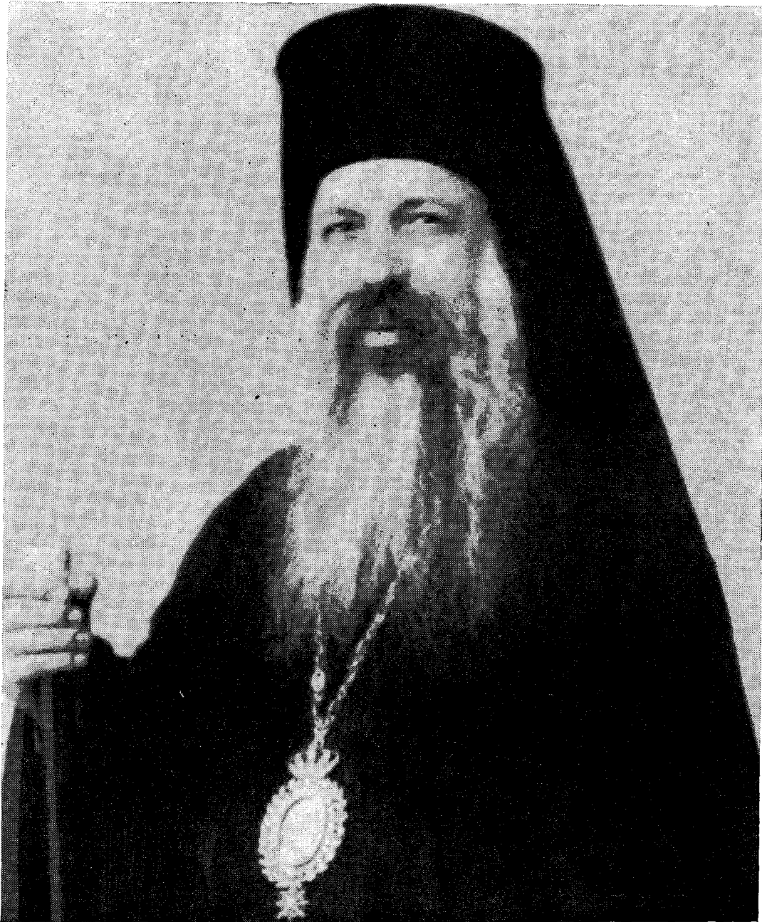
Ο ΑΡΧΙΕΠΙΣΚΟΠΟΣ ΑΘΗΝΩΝ ΧΡΥΣΟΣΤΟΜΟΣ ΠΑΠΑΔΟΠΟΥΛΟΣ (1 Ιουλίου 1868 — 22 Οκτωβρίου 1938)

ΕΤΟΣ ΜΕ' | ΑΘΗΝΑΙ, ΑΓ. ΦΙΛΟΘΕΗΣ 19.—Τηλ. 227-689 | 1/15 ΝΟΕΜΒΡΙΟΥ 1968 | ΑΡΙΘ. 21-22