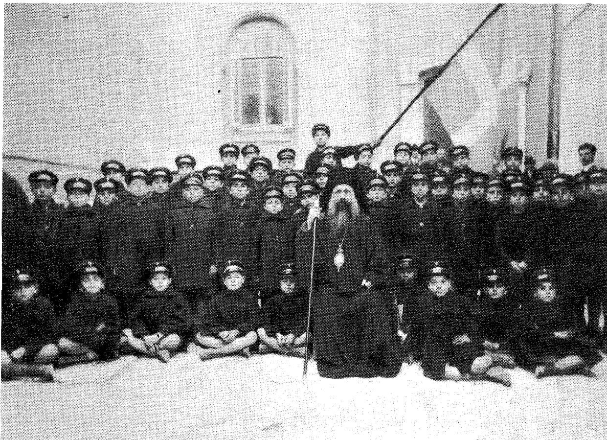
Ὁ Ἀρχιεπίσκοπος Ἀθηνῶν Χρυσόστομος Παπαδόπουλος ἐν τῷ μέσῳ τῶν τροφίμων τοῦ Ἐκκλησιαστικοῦ Ὁρφανοτροφείου Βουλιαγμένης.

Δὲν παρουσίασεν ἡ Ἐκκλησία τῆς Ἑλλάδος ἐτέραν μορφήν ὁμοίαν τοῦ ἀναστήματος τοῦ Ἀρχιεπισκόπου Ἀθηνῶν Χρυσοστόμου Παπαδοπούλου. Ἡ το ὅλος φῶς καὶ πνοή. Δὲν συνέκλειεν ἐν ἑαυτῷ τὰ χαρίσματα ταῦτα ἐγωϊστικῶς. Μετέδιδε ταῦτα πᾶσαν δυνατὴν κατεύθυνσιν. Ὁμοίαζε πρὸς ἓνα πρωθητήρα πνευματικὸν μεγάλης ὀλκῆς. Ἐδίδασκε διὰ τοῦ παραδείγματός του. Συγγραφῶν, καὶ τόσον ἀπησχολημένος μὲ τὰ καθήκοντα καὶ τὰ ἔργα τῆς Ἀρχιεπισκοπῆς καὶ τῆς Ἱερᾶς Συνόδου, εὔρισκε τὸν καιρὸν νὰ