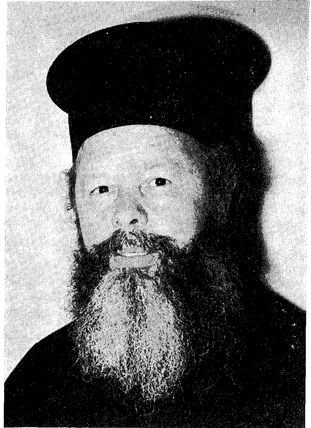
† Ὁ Δημητριάδος κ. Ἡλίας

Τὴν 6 Δεκεμβρίου 1968 περιελήφθη εἰς τὸ ὑπὸ τῆς Ἱερᾶς Συνόδου καταρτισθὲν τριπρόσωπον δελτίον διὰ τὴν πλήρωσιν τῆς Ἱερᾶς Μητροπόλεως Δημητριάδος, ἧτις ἐχῆρευσε κατόπιν τῆς διὰ λόγους ὑγείας παραιτήσεως τοῦ Σεβασμ. Μητροπολίτου αὐτῆς