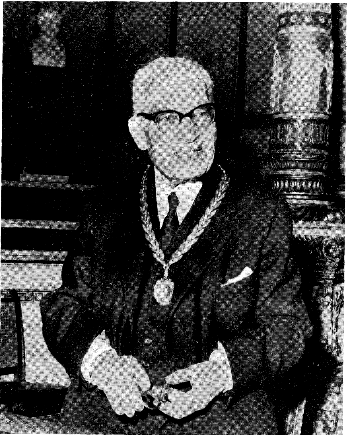
Ὁ ἀείμνηστος Ἀμίλλιας Ἀλιβιζᾶτος, Πρόεδρος τῆς Ἀκαδημίας καὶ δόκιμος καθηγητὴς τῆς Θεολογικῆς Σχολῆς τοῦ Πανεπιστημίου Ἀθηνῶν.