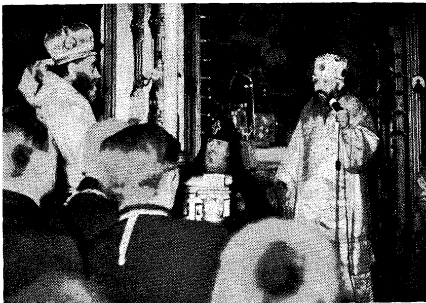
Ὁ Σεβ. Μητροπολίτης Κίτρος προσφωνεῖ τὸν ἐνθρονισθέντα Πρωθυεράρχην.

ὀκταετῆ δημοσίαν ἐκπαίδευσιν τὴν ἐν Βαρσοβίᾳ κρατικὴν Χριστιανικὴν Θεολογικὴν Ἀκαδημίαν, ἀπὸ τοῦ ἰσταμένου ἔτους πενταετοῦς φοιτήσεως, ἰδρυθεῖσαν τὸ 1954, τῆς ὁποίας ἰδιάζον, μοναδικὸν ἴσως καθ' ἅπασαν τὴν Χριστιανωσύνην, εἶναι ἡ ἐν τῷ αὐτῷ ἰδρύματι ἐκπαιδευτικὴ συνύπαρξις, εἰς τρία ἀνεξάρτητα τμήματα, Ὁρθόδοξων (ἐφέτος 21 τὸν ἀριθμὸν), Παλαιοκαθολικῶν καὶ Ἐθνικοκαθολικῶν καὶ Προτεστάντων, μὴ συμμετεχόντων τῶν Ρωμαιοκαθολικῶν, μὲ ἤδη συνολικὸν ἀριθμὸν σπουδαστῶν 120, ἀρρένων καὶ θη-