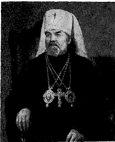
Ὁ Προκαθήμενος τῆς Ἐκκλησίας τῆς Τσεχοσλοβακίας Μακαριώτατος κ. Δωρόθεος.

Ἐκ Βαρσοβίας ὁ Σεβ. Κίτρους μετὰ τρίωρον περίπου ἀεροπορικὴν διαδρομὴν, ἀπὸ ὥρας 12 10' μέχρι 2 50' π.μ., ὑπὸ πρωτοφανῆ χιονοθύελλαν, ἐφθασεν εἰς Πράγαν, εἰς τὸ ἀεροδρόμιον τῆς ὁποίας τὸ ἀεροπλάνον ἐνεκα τῆς χιόνος, ἣτις εἶχεν ἀνέλθει εἰς ὕψος σχεδὸν ἐνὸς μέτρου, ἠναγκάσθη νὰ πραγματοποιήσῃ τυφλὴν προσγειώσιν. Ἐνταῦθα ἀνέμενον ὁ Μακαριώτατος Μητροπολίτης Πράγας καὶ πάσης Τσεχοσλοβακίας κ.