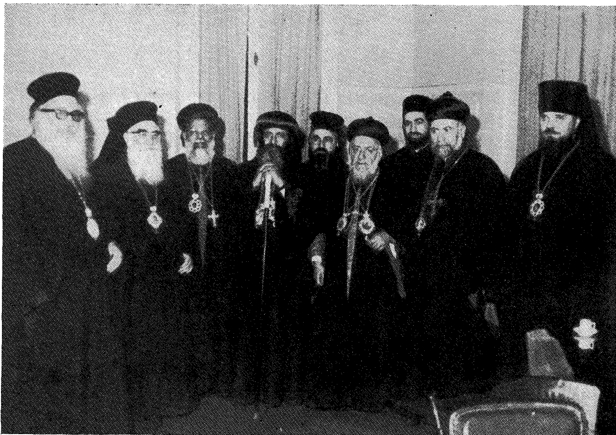
Ὁ νέος Πατριάρχης τῶν Κοπτῶν Μακ. κ. Shenouda μεθ' ἑτέρων Ἱεραρχῶν, ἐν οἷς καὶ οἱ ἀντιπροσωπεύσαντες κατὰ τὴν τελετὴν τῆς ἐνθρονίσεως τὴν Ἐκκλησίαν τῆς Ἑλλάδος Σεβ. Μητροπολίτης Μυτιλήνης κ. Ἰάκωβος καὶ ὁ Σεβ. Δέρβης κ. Κοσμάς.

του, ἦτοι στιχάριον, ἐπιτραχήλιον, ζώνην, ἐπιμάνικα, ἐπιγονάτιον καὶ φελώνην ὑπὸ μορφὴν μανδύου καὶ κατόπιν τῷ ἐναπέθεσαν ἐπὶ τῆς κεφαλῆς τὴν μίτραν. Ὁ λαὸς τότε ἐξέσπασεν εἰς ἐπευφημίας καὶ χειροκροτήματα. Μετὰ ταῦτα ὁ Πατριάρχης ἐνδεδυμένος ἅπασαν τὴν ἀρχιερατικὴν στολὴν εἰσῆλθε διὰ τῆς ὡραίας Πύλης εἰς τὸ ἱερὸν Βῆμα καὶ θυμιάσας τὴν ἁγίαν Τράπεζαν, προσευχήθη γονυκλινῆς· ἐγερθεὶς κατόπιν ἠσπάσθη τὸ ἱερὸν Εὐαγγέλιον καὶ ἔλαβεν ἀνα χεῖρας τὸν σταυρὸν τῆς εὐλογίας, ὡς καὶ τὴν ποιμαντικὴν ῥάβδον. Τότε ἐξελθὼν τοῦ ἱεροῦ Βήματος κατηθύθη εἰς τὸν θρόνον του, ὁπόθεν ἀνέγνωσε τὸ Εὐαγγέλιον καὶ τὸν ἐνθρονιστήριον λόγον τοῦ ἀραβιστὶ καὶ ἀγγλιστί. Μετὰ ταῦτα, ἐψάλη εἰς τὴν Ἑλληνικὴν γλῶσσαν ἡ φήμη αὐτοῦ, ἣτις εἶναι ἐξ ὀλοκλήρου ὁμοία πρὸς τὴν φήμην τοῦ Ἑλλήνου Πατριάρχου Ἀλεξανδρείας, ὡς καὶ τὸ «ἄξιος». Ἀμέσως δὲ προσῆλθεν εἰς τὸν θρόνον εἰς Ὑπουργός, διὰ νὰ ἐπιδώσῃ εἰς τὸν Πατριάρχην τὸ ἀνώτατον παράσημον τοῦ Κράτους μετὰ τὴν πρασίνην ταινίαν καὶ τὸν ἀστέρα. Εἶτα ἐδέχθη τὰ συγχαρητήρια τοῦ κ. Πρωθυπουργοῦ, τῶν Ὑπουργῶν, τῶν μελῶν τοῦ διπλωματικοῦ Σώματος καὶ ἄλλων προσωπικοτήτων, κατελθὼν δὲ ἀπὸ τοῦ θρόνου