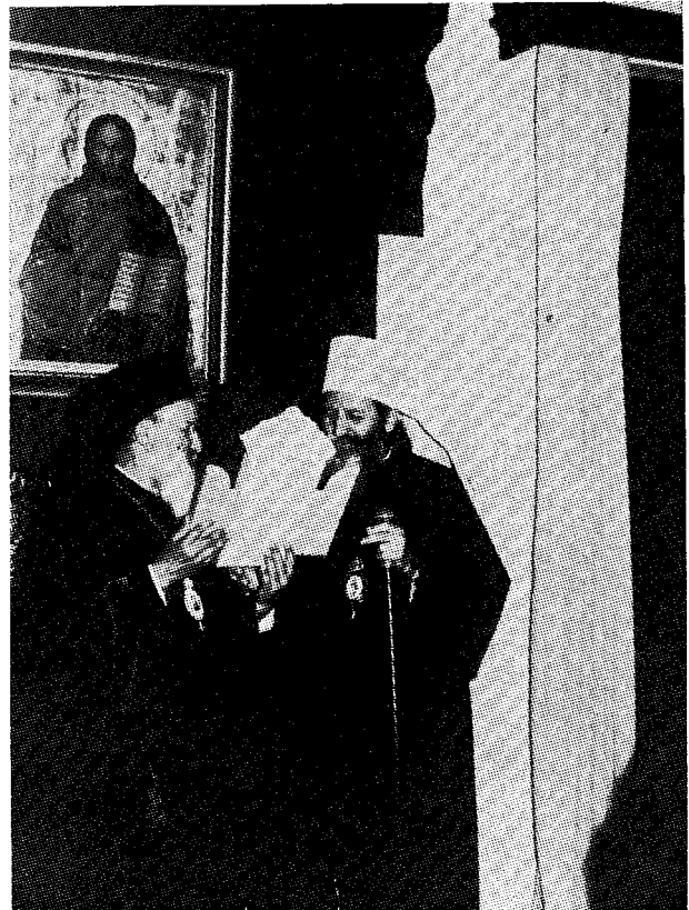
Ὁ Μακαριώτατος Ἀρχιεπίσκοπος Ἀθηνῶν καὶ πάσης Ἑλλάδος κ. Ἱερώνυμος ἐπιδίδει εἰς τὸν Μακαριώτατον Πατριάρχην Σερβίας κ. Γερμανὸν τρίπτυχον.

Ἐν συνεχείᾳ, ὁ Μακαριώτατος ἀπένειμε καὶ ἐπέδωκε τὸν μὲν χρυσοῦν Σταυρὸν τοῦ ἀποστόλου Παύλου εἰς τοὺς Σεβ. Συνοδικούς Ἐπισκόπους, τὸν ἑλλογιμ. Καθηγητὴν κ. Στόγιαν Γκόσεβιτς καὶ τὸν ἀρχιτέκτονα τοῦ Πατριαρχείου κ. Τάντις, τὸν δ' ἀργυροῦν Σταυρὸν