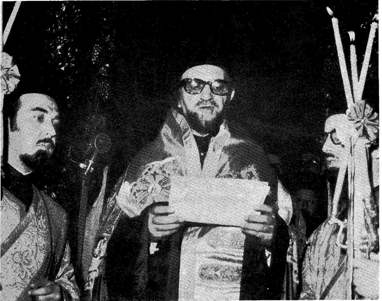
Ἡ Α.Θ.Π. ὁ Οἰκουμενικὸς Πατριάρχης κ. Δημήτριος Α' ἐκφωνῶν τὸν Ἐνθρονιστήριον αὐτοῦ λόγον.

Παρακαλέσαμεν. Ἰκετεύσαμεν, συναίσθησιν πλήρη ἐ- χοντες ἀφ' ἑνὸς μὲν τοῦ πελωρίου τοῦ Σταυροῦ, ἀφ' ἑτέρου δὲ τῆς ἡμῶν ἀναξιοτήτος καὶ ἀσθενείας.