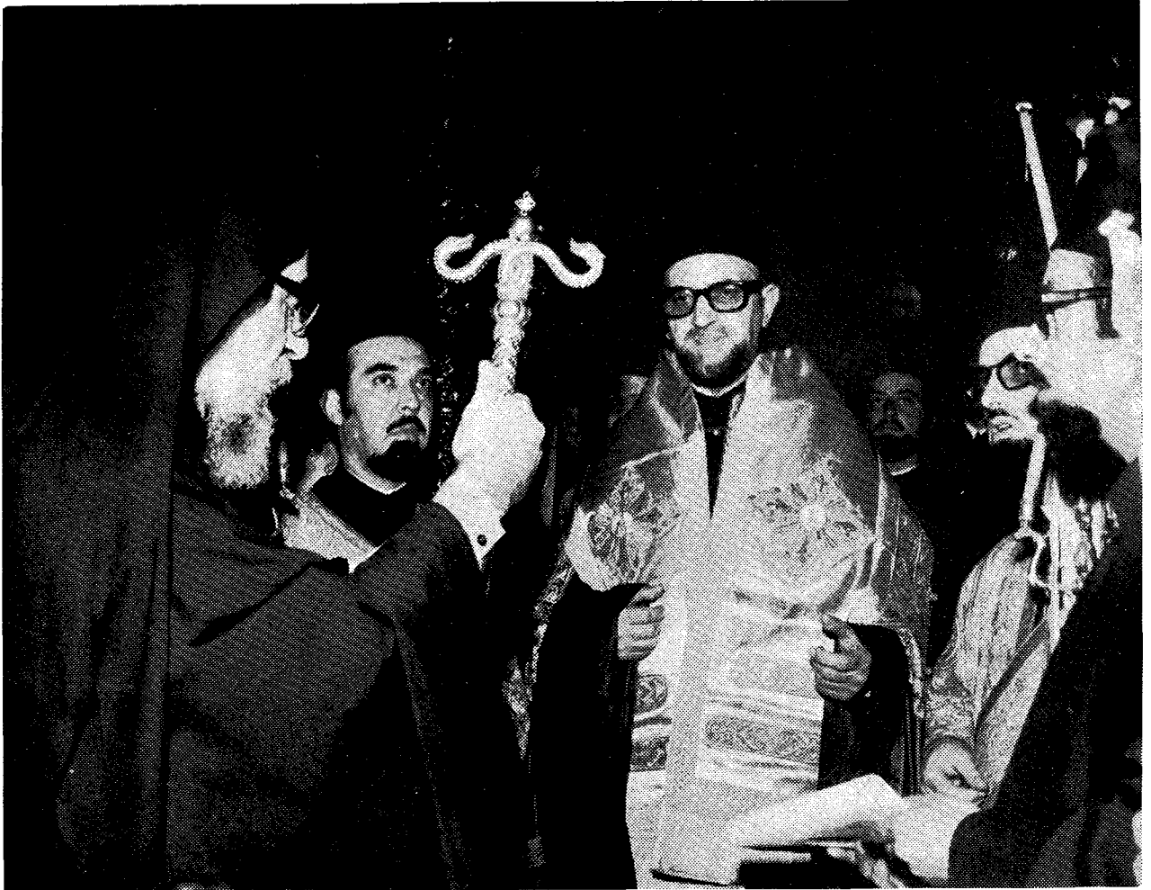
Ὁ Σεβ. Μητροπολίτης Χαλκηδόνος κ. Μελιτών παραδίδων εἰς τὴν Α.Θ.Π. τὸν Οἰκουμενικὸν Πατριάρχην κ. Δημήτριον τὴν πατριαρχικὴν βάβδον.

πισκοπῆς σου, ἠνωμένος ἀχωρίστως μετὰ τοῦ Μεγάλου Ἀρχιερέως καὶ Κυρίου ἡμῶν, εἶσαι ὁ φύλαξ καὶ φρονεὸς ὁλοκλήρου τῆς Ἐκκλησίας. Ἐντεῦθεν, πηγάζει καὶ ἡ ὑποχρέωσίς σου καὶ ἡ ἀποστολή σου νὰ τὴν οἰκοδομήσῃς καὶ νὰ τὴν προστατεύῃς, ὑπομιμνήσκων εἰς τοὺς πάντας καὶ ὅσα προνόμια θεῖα, ἱερά, ἀπαράβαρα καὶ ἀπαρασάλευτα κέκτηται ὁ Ἁγιώτατος Ἀποστολικός, Πατριαρχικὸς καὶ Οἰκουμενικὸς οὗτος Θρόνος.