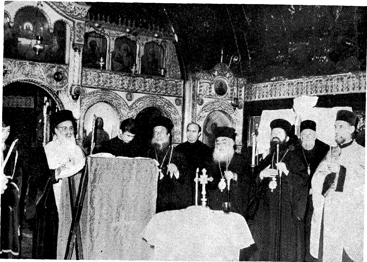
Ὁ Μακαριώτατος Ἀρχιεπίσκοπος κ. Ἱερώνυμος ἐτέλεσεν εἰς τὸν ἱερὸν ναὸν «Ρούζιτσα» τοῦ Βελιγραδίου Μνημόσυνον τοῦ Ρήγγα τοῦ Φερραίου.

Σχολῆς Βελιγραδίου. Εἰς τὸ Τρισάγιον, τοῦ Πρέσβευος ὄντος κληνῆρους, παρέστη ἐκ μέρους τῆς Ἑλληνικῆς Πρεσβείας ὁ Γραμματεὺς αὐτῆς κ. Ἰω. Δρακουλαρᾶκος. Σημειωτέον, ὅτι τοῦ παρεκκλησίου τούτου, ἀνεγερθέντος μετὰ τὸν Α΄ Παγκόσμιον Πόλεμον, οἱ πολυέλει εἶναι κατεσκευασμένοι ἐξ ὀλοκλήρου διὰ καλύκων, σφαιρῶν, ξιφῶν καὶ ἄλλων ὅπλων!