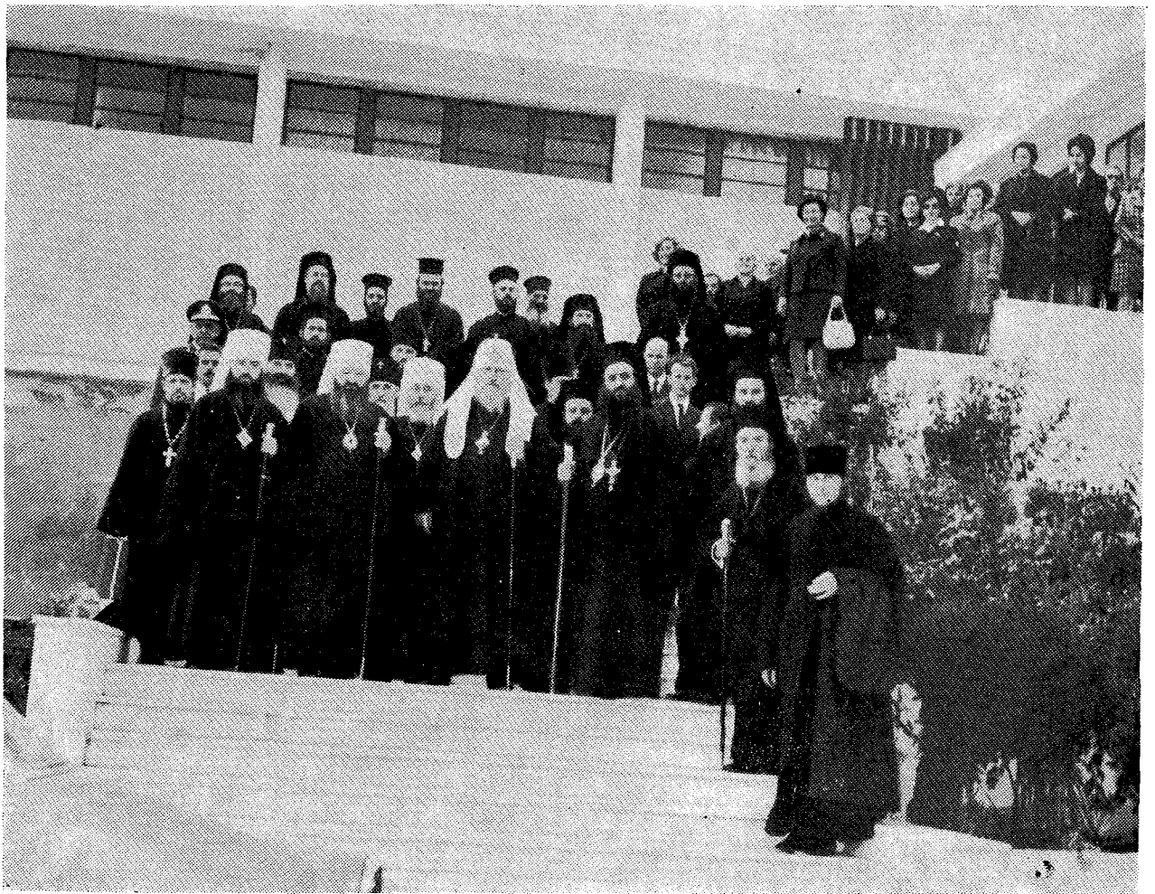
Ὁ Μκαριώτατος Πατριάρχης Μόσχας κ. Ποιμὴν, ἡ συνοδεία του καὶ Ἕλληνες Ἀρχιερεῖς καὶ ἄλλοι κληρικοί εἰς τὰς βαθμίδας τοῦ Ἱερατικῶν Γηροκομείου «Ἅγιος Ἰωάννης ὁ Ρώσος».

Ἐπιτρέψατέ μοι, Ἀγιώτατε, ἵνα ὡς ἐλάχιστον