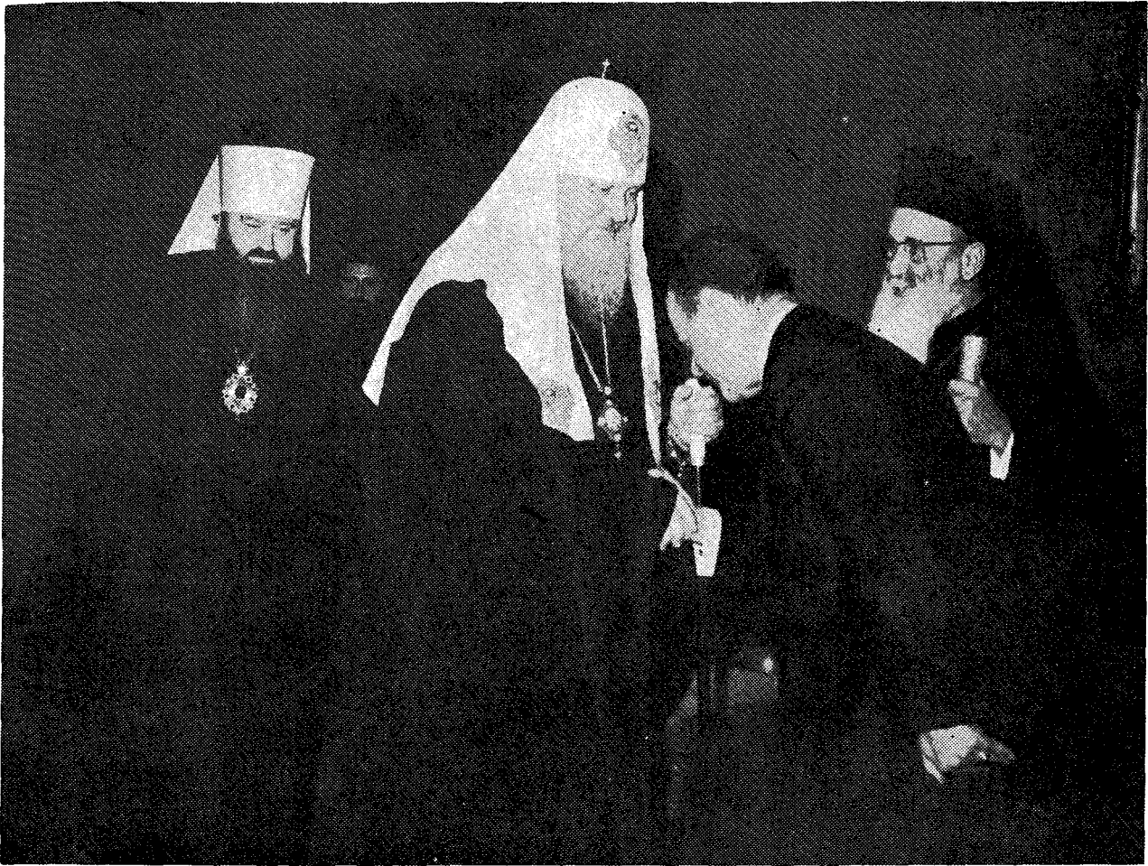
Ἡ Α.Ε. ὁ Ἀντιβασιλεὺς-Πρωθυπουργὸς κ. Γεώργιος Παπαδόπουλος ὑποδέχεται εἰς τὸ γραφεῖόν του τὸν Μ. Πατριάρχην κ. Ποιμένα. Διακρίνονται ὁ Μ. Ἀρχιεπίσκοπος κ. Ἱερώνυμος καὶ ὁ Μητροπολίτης Λένινγκραντ κ. Νικόδημος.

βληθεὶς μανδύαν εἰσῆλθεν εἰς τὸν Ἱ. Ναὸν καὶ προσεκύνησε τὸ Ἱερὸν Λεῖψανον τοῦ Ἁγίου Ἰωάννου, ὁμοίως καὶ οἱ συνοδεύοντες αὐτὸν Σεβ. Ἀρχιερεῖς, ἀνελθὼν δὲ εἰς τὸν θρόνον περιεβλήθη ἐπιτραχήλιον καὶ ὠμοφόριον καὶ ἤρχισε τὴν ἱερὰν ἀκολουθίαν τῆς Παρακλήσεως πρὸς τὸν Ὅσιον, ψαλεῖσαν Ρωσιστὶ ὑφ' ἀπάντων τῶν Κληρικῶν τῆς Πατριαρχικῆς συνοδείας. Ἐν συνεχείᾳ, ὁ Σεβ. Μητροπολίτης Χαλκίδος κ. Νικόλαος προσεφώνησε τὸν Μακαριώτατον Πατριάρχην εἰπὼν τὰ ἑξῆς: