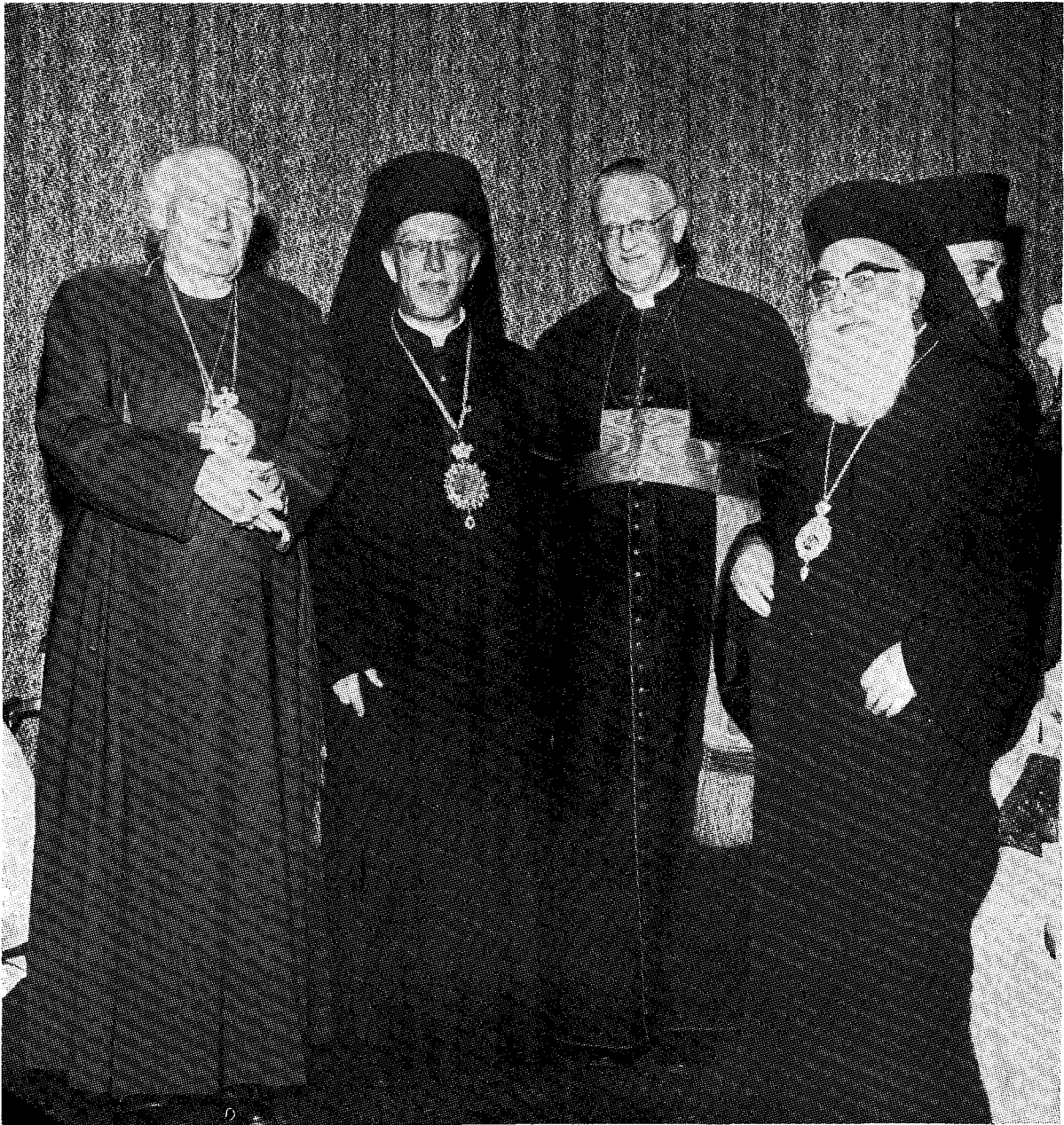
Ὁ Ἀρχιεπίσκοπος Θυατείρων κ. Ἀθηναγόρας ἐν μέσῳ τοῦ Ἀρχ/που τοῦ Canterbury, τοῦ καρδινάλιου κ. Heenan καὶ τοῦ Σεβ. Μυτιλήνης κ. Ἰακώβου.

Τὴν 28ην Ὀκτωβρίου, κατόπιν προσκλήσεως τῆς Ἑλληνικῆς Κοινότητος Birbingham, ἀνεχώρησα ἐκ Λονδίνου διὰ νὰ ἱεουργήσω καὶ ὁμιλήσω εἰς τὸν ἐκεῖ μεγαλοπρεπῆ Ναὸν τοῦ Ἁγίου Ἀποστόλου Ἀνδρέου,