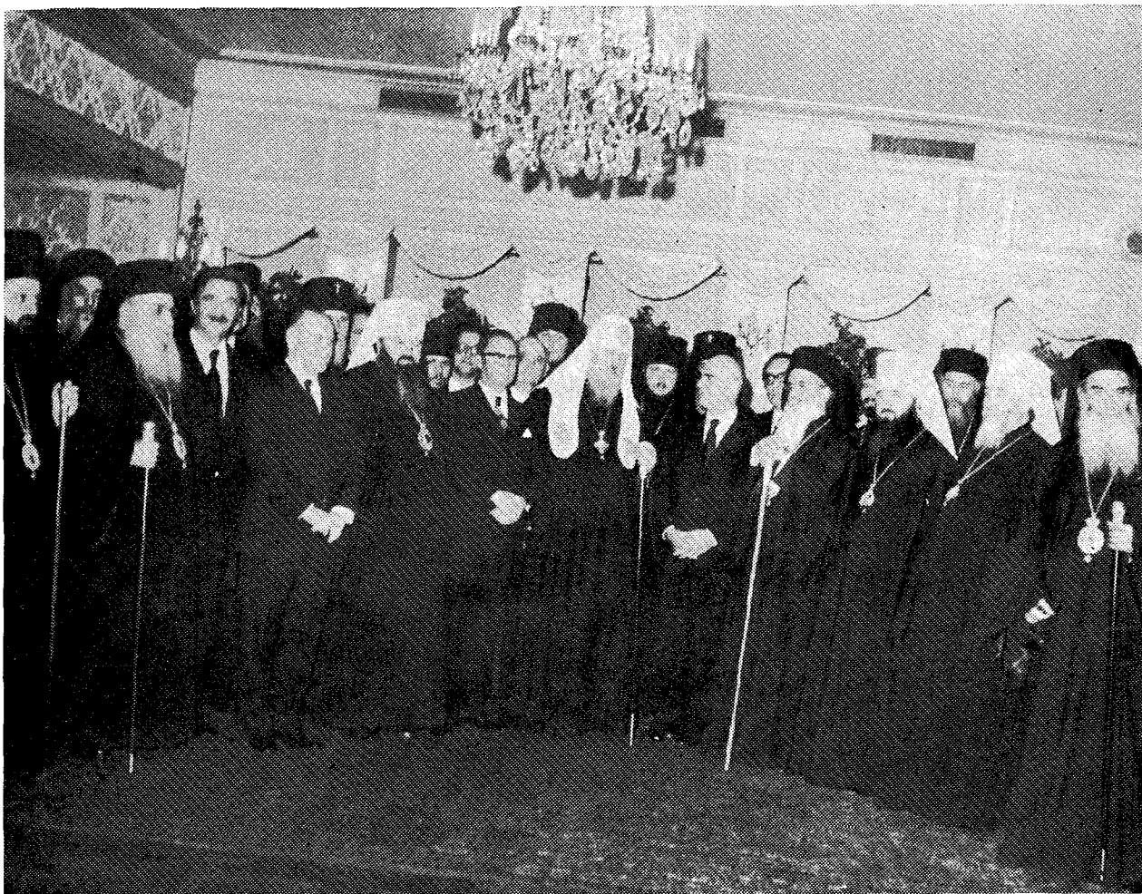
Οἱ Προκαθήμενοι τῶν Ἐκκλησιῶν Ρωσίας καὶ Ἑλλάδος Πατριάρχης κ. Ποιμὴν καὶ ὁ Ἀρχιεπίσκοπος κ. Ἱερώνυμος κατὰ τὸ παρατεθὲν ὑπὸ τῆς Κυβερνήσεως δεῖπνον. Διακρίνονται ὁ Ἀντιπρόεδρος κ. Στυλιανὸς Παττακός, ὁ ὑπουργὸς Παιδείας κ. Γιαντώνας καὶ ὁ Ρῶσος πρέσβυς κ. Λεβίτσκιν.

ἀποβλέποντες εὐγνωμόνως πρὸς τὴν δευτέραν των πατριίδα, τὴν Ρωσίαν, συνετέλεσαν εἰς τὴν ἀνάπτυξιν αὐτῆς μὲ ἔργα ὑψηλοῦ θρησκευτικοῦ, πνευματικοῦ καὶ ὕλικου πολιτισμοῦ καὶ τῆς φιλίας τῶν δύο ἀδελφῶν ἐν Χριστῷ Λαῶν.