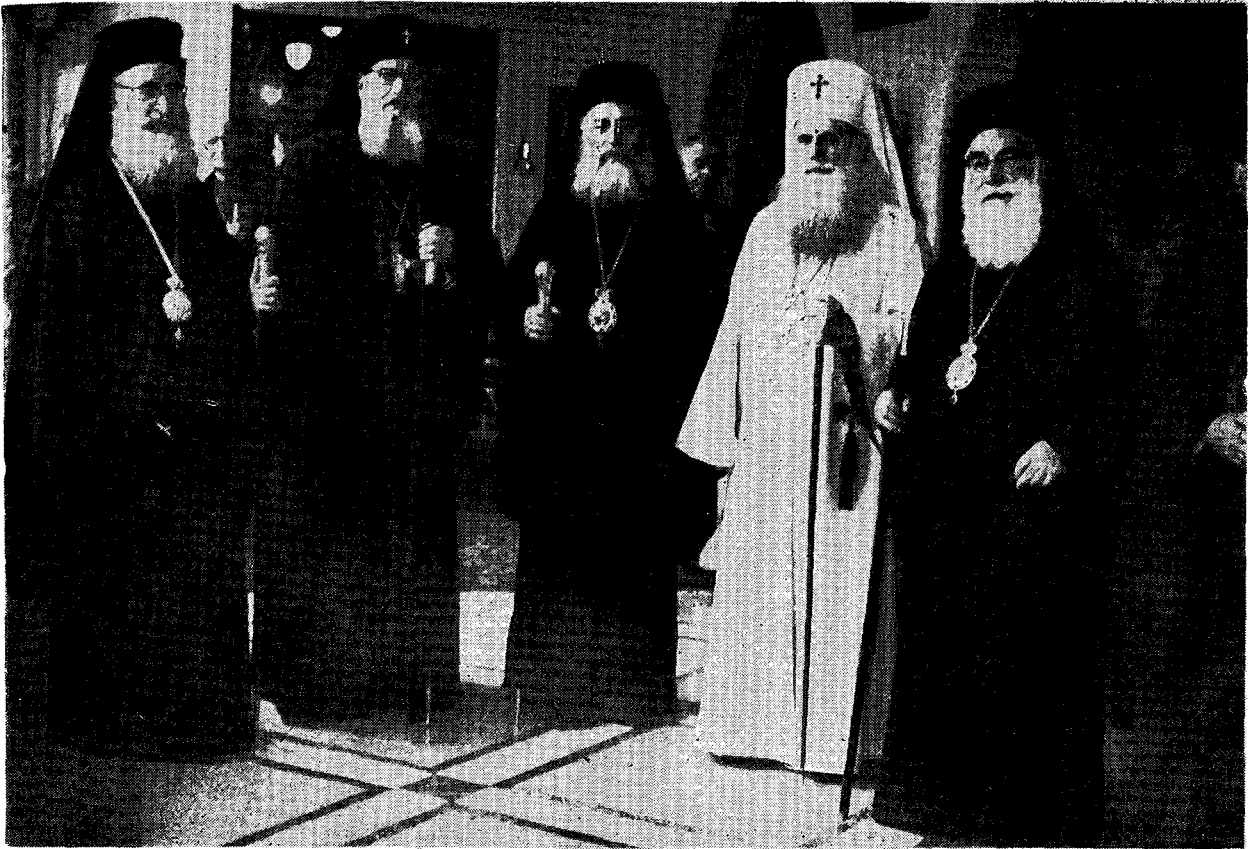
Ὁ Μακ. Πατριάρχης κ. Ἰουστινιανὸς ἐν μέσῳ τῶν Σεβασμιωτάτων Ἱεραρχῶν Μαρωνείας κ. Τιμοθέου, Μολδαβίας κ. Ἰουστίνου, Ἰωαννίνων κ. Σεραφείμ καὶ Μυτιλήνης κ. Ἰακώβου.

Τὴν ἐπομένην, ἡ Ἑλληνικὴ ἀντιπροσωπία περιῆλθε τὸ κτίριον τοῦ Πατριαρχείου. Τοῦτο εὕρισκεται εἰς τὴν κεντρικὴν πλατεῖαν, ὅπου τὸ Κοινοβούλιον τοῦ Κράτους. Ἐναντι αὐτοῦ ὀρθοῦται μεγαλοπρεπῶς ὁ Καθεδρικὸς Ναός. Τὸ Πατριαρχικὸν Μέγαρον ἀπο-