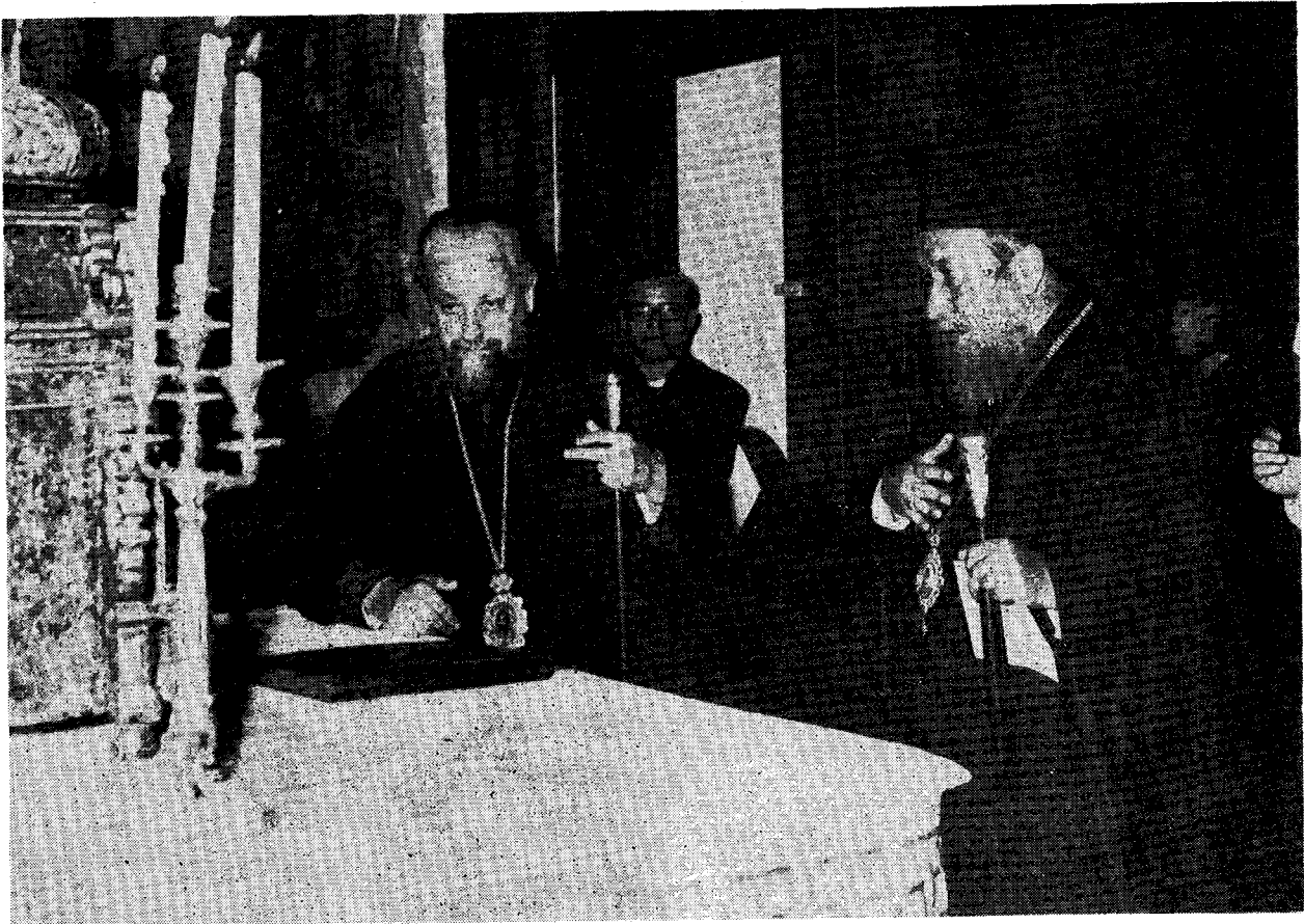
Οἱ Σεβ. Μητροπολίται Κορινθίας κ. Παντελεήμων καὶ Πρεβέζης κ. Στυλιανὸς πρὸ τοῦ Ἱεροῦ Εὐαγγελίου εἰς τὴν ἁγίαν τράπεζαν τοῦ Ἱεροῦ Ναοῦ τοῦ ἁγίου Δημητρίου τῆς Ἑλληνορρυθμοῦ Ἐπαρχίας.

Συνέβη ἡμῖν, ὅπερ ἐν τῶν θεηγόρων ἐκείνων τῆς ἁγίας ἡμῶν Ἐκκλησίας ἁσμάτων λέγει ἐπὶ τῇ πανιέρῳ ἑορτῇ τοῦ Εὐαγγελισμοῦ. «Γλώσσαν, ἣν οὐκ ἔγνω, ἤκουσεν ἡ Θεοτόκος. Ἐλάλει γὰρ πρὸς Αὐτὴν ὁ Ἀρχάγγελος τοῦ εὐαγγελισμοῦ τὰ ῥήματα. Ὁθεν, πιστῶς δεξαμένη τὸν ἀσπασμόν, συνέλαβέ Σε τὸν προαιώνιον Θεόν».