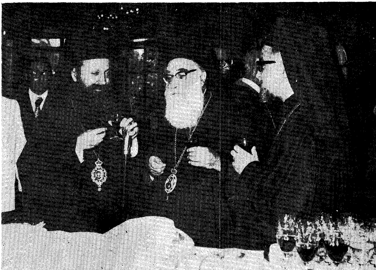
Ὁ Σεβ. Μυτιλήνης κ. Ἰάκωβος μετὰ τοῦ Σεβ. Ἀττικῆς κ. Νικηδῆμου καὶ τοῦ Πανος. κ Τιμ. Ἐλευθερίου εἰς τὸ Ξενοδοχεῖον IGIEA.

Ἐν πομπῇ ἐφθάσαμεν πρὸ τοῦ Ἱεροῦ Βήματος τοῦ Ναοῦ. Εἰς τὸν σωλέα ἔμπροσθεν τῆς Ὁραίας Πύλης ἐκάθησαν οἱ Σεβασμιώτατοι Μυτιλήνης κ. Ἰάκωβος καὶ τῆς Piana κ. Ἰωσήφ Περνιτσιάρο, φέροντες ἀμφότεροι μανδύαν. Ἡμεῖς ἐλάβομεν θέσεις εἰς τὸν ἀριστερὸν χορὸν. Μικτὸς χορὸς ἐνισχυόμενος ὑπὸ μοναχῶν τῆς Κρυπτοφέρρης ἔψαλεν ἑλληνιστὶ τὴν μεγάλην Δοξολογίαν καὶ τὸ ἀπολυτικίον τοῦ ἁγ. Δημητρίου. Ἐπηκολούθησε μία λιτὴ καὶ ἡ ἐπὶ τῇ εὐκαιρίᾳ ταύτῃ συντεθεῖσα εὐχή.