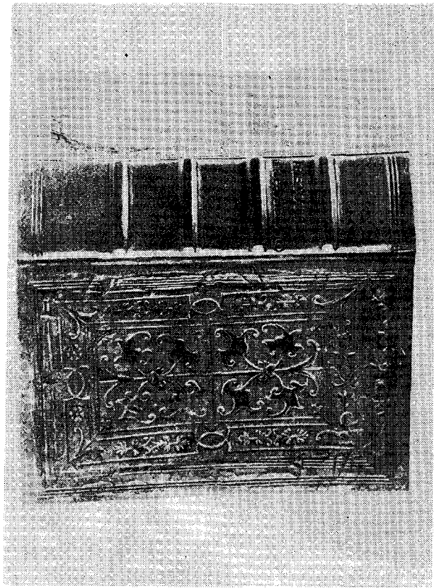
Τὸ προηγούμενον ἐξώφυλλον μετὰ τὴν ἀνακαίνισιν (Restaurο).

Ὁ κίνδυνος ὁμως τῶν χειρογράφων καὶ τῶν βιβλίων δὲν προέρχεται μόνον ἀπὸ κακὰς ἐνεργείας ἀνθρώπων. Εἶναι δυνατὸν νὰ φθάσωμεν εἰς τὸ ἴδιον ἀπο-