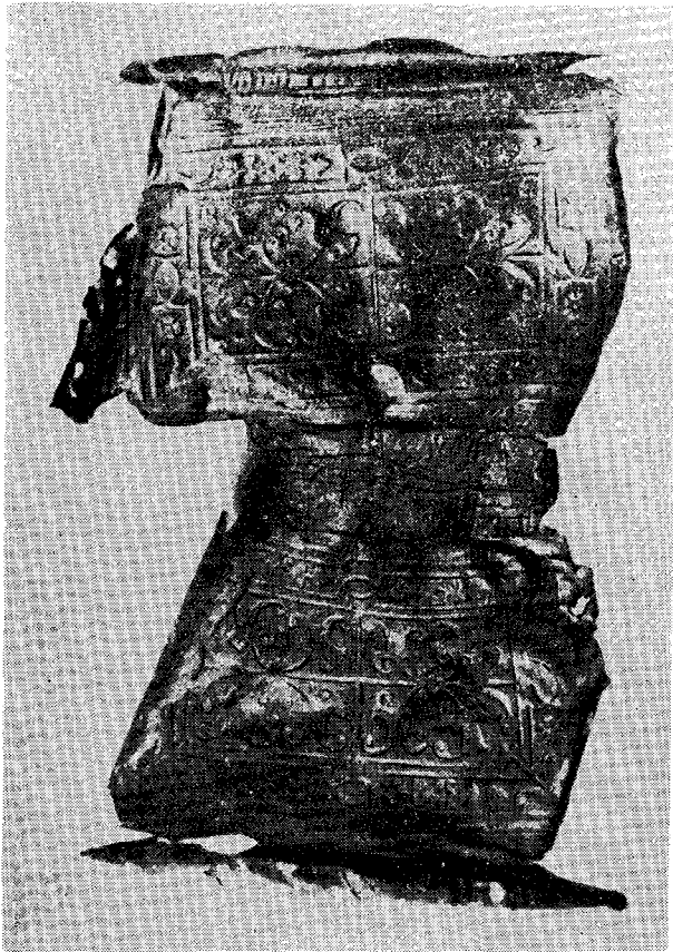
Κατεστραμμένον ἐξώφυλλον βιβλίου πρὸ τῆς ἀνακαίνσεως.

Πολλάκις διαπιστώνομεν τὴν καταστροφὴν λίαν καθυστερημένως καὶ περιοριζόμεθα εἰς τὸ νὰ ἐκφράζωμεν τὴν θλίψιν μας διὰ τὸ γεγονός. Πολλάκις ὁμως ἡ καταστροφὴ ἐπισημαίνεται μὲν πρὶν προχωρήσῃ, ἀλλὰ μετὰ πρόχειρον ἔρευναν καταλήγομεν εἰς τὸ συμπέρασμα, ὅτι δὲν εἶναι δυνατὸν νὰ ἀνακοπῇ. Ἡ σκόνη, τὸ μικρὸν ζωῦφιον, ὁ ποντικός, ἡ ὑγρασία, θεωροῦνται.... ἰσχυρότερα ἀπὸ τὸν ἄνθρωπον.