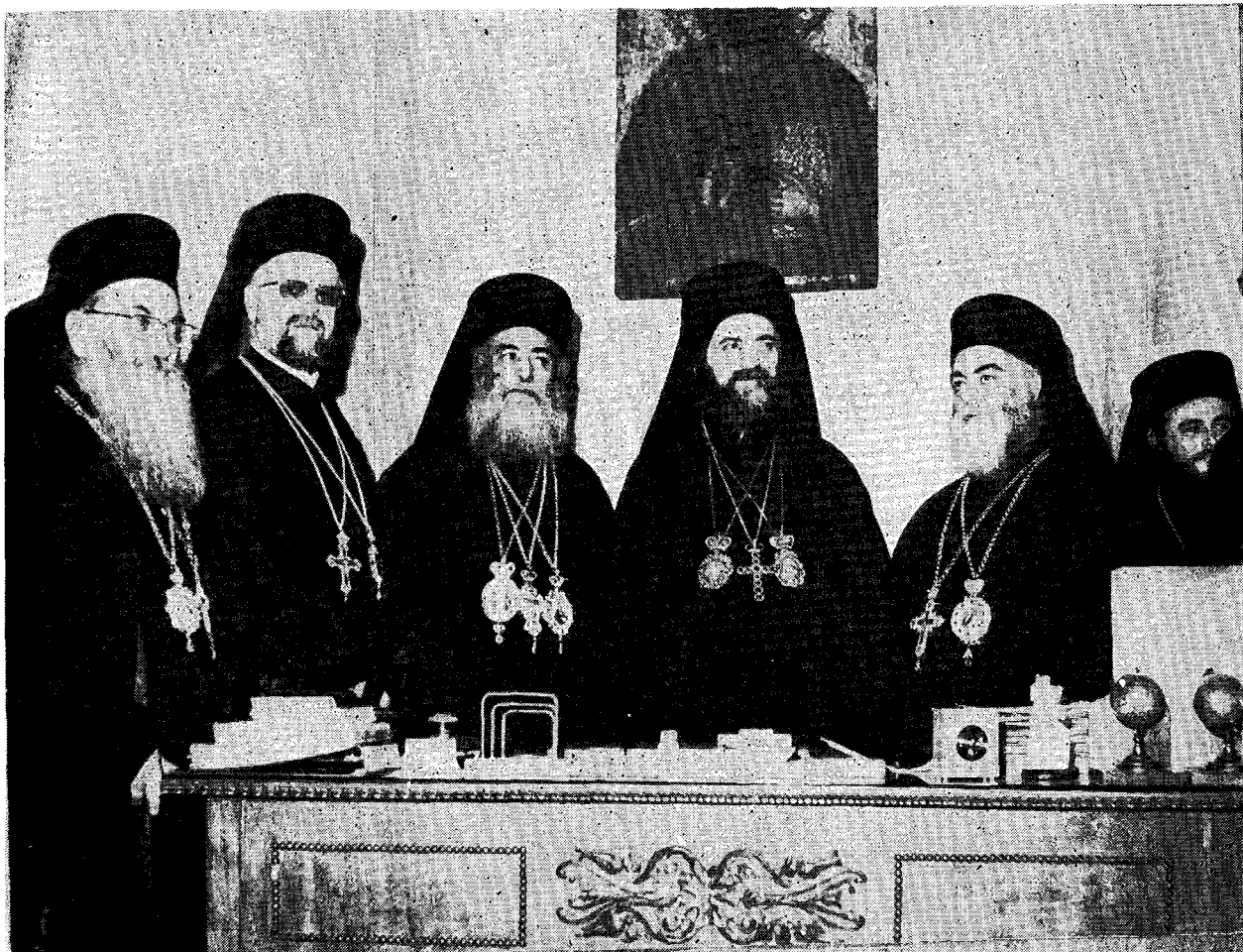
Εἰς τὸ ἀπέριττον Πατριαρχικὸν Γραφεῖον ἐνθα ἡ Α.Θ.Π. ὑπεδέχθη τὸν Μακαριώτατον καὶ τὰ μέλη τῆς Ἀκολουθίας αὐτοῦ.

Ἐγείροντες τὸ ποτήριον τοῦτο, προπινομεν ὑπὲρ ὑγείας τῆς Ὑμετέρας Θειοτάτης Παναγιότητος καὶ