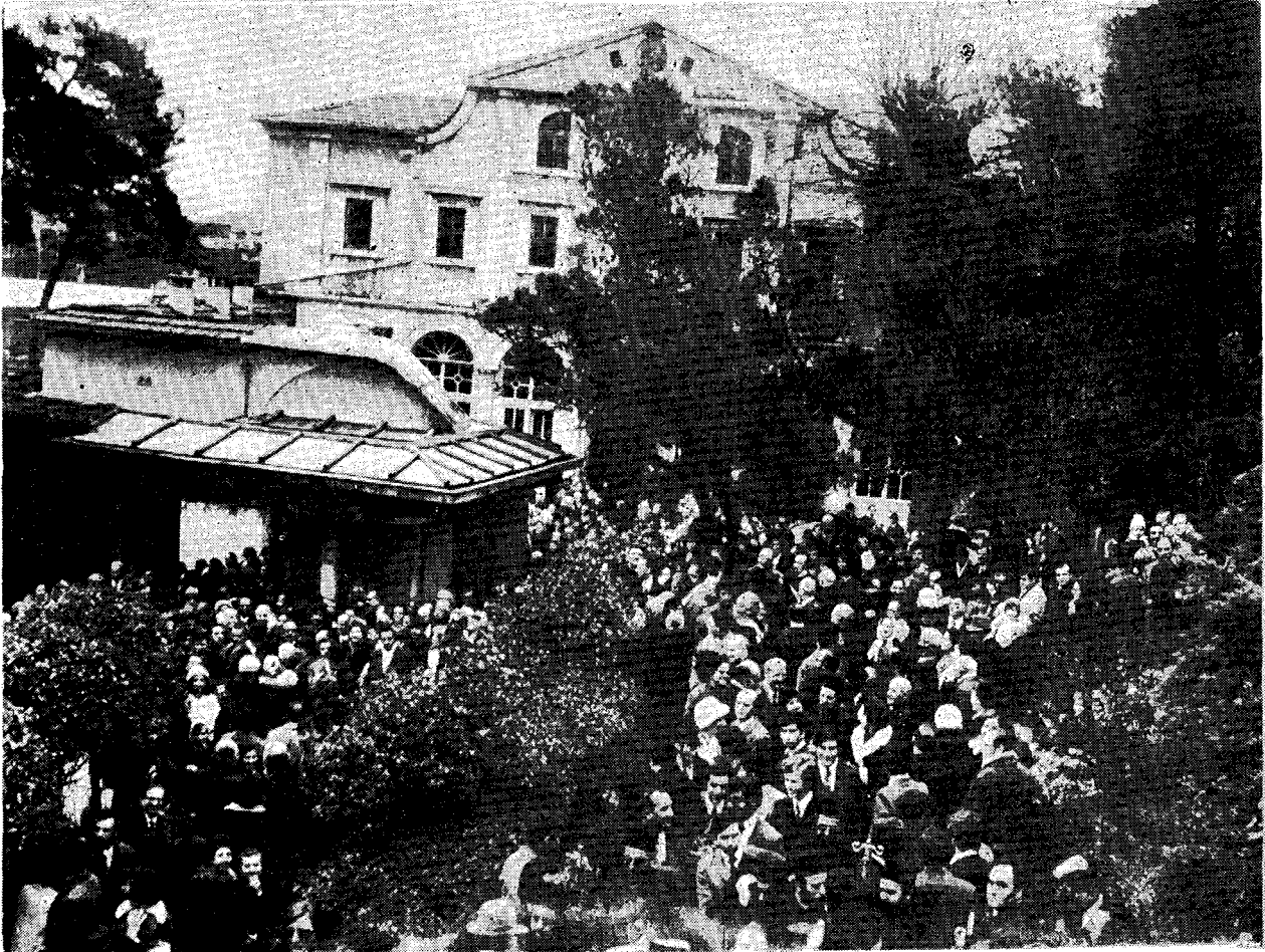
Μετὰ τὸ πέρας τῆς Θ. Λειτουργίας εἰς τὸν Πατριαρχικὸν Ναὸν τῇ Κυριακῇ τῆς Σταυροπροσκυνήσεως, ὁ λαὸς ἐκχύνεται εἰς τὴν αὐλὴν τῶν Πατριαρχείων, ἐνῶ οἱ συλλειτουργήσαντες Ἀρχιερεῖς βαδίζουν πρὸς τὰ Πατριαρχικὰ δώματα.

Τῇ στεροῇ δὲ ταύτῃ πίστει καὶ ἀκραδάντῳ ἐλπί-δι χαιρετίζω καὶ ἀσπάζομαι ἐκ μέρους τῆς Α.Θ. Μακαριότητος τὴν Ὑμετέραν πολυέραστον Παναγιότητα καὶ τὴν περὶ Ἀδελφὴν Ἁγίαν καὶ Ἱερὰν Σύνοδον, βέβαιος ὢν, ὅτι ὁ πλοῦς τῆς ὁλκάδος τῆς Ὁρθόδοξου Ἐκκλη-σίας ἀποβήσεται, σὺν Θεῷ, εὐδιέστερος καὶ αἰσιώτερος, ἢ δὲ Παράδοσις αὐτῆς, συνεχιστής καὶ φοιρὴς τῆς ὁ-ποίας ἐτάχθη ὑπὸ τῆς Θείας Προνοίας ἡ Ὑμετέρα κο-ρυφὴ τῆς Ὁρθοδοξίας μετὰ τῆς περὶ Ἀδελφὴν Ἁγίας καὶ