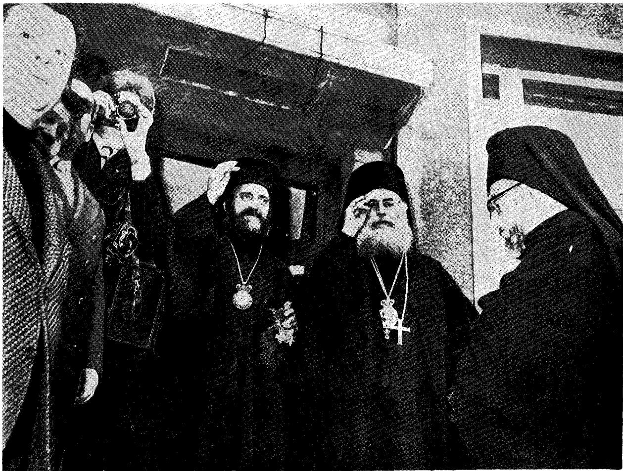
Μετά την πανηγυρικήν Θ. Λειτουργίαν. Οί δύο Προκαθήμενοι άπονέμουν από του ύψους της θύρας του Πατριαρχικού δώματος την εύλογίαν των πρός τά άναμένοντα εις την αύλήν πλήθη πιστών.

Εις τό Νοσοκομείον ένοσηλεύετο ό ήδη μακαριστός Μητρ. Πριγκηποννήσιον Δωρόθεος πρός όν ό Μακαριώτατος ηύχήθη ταχείαν άνάρρωσιν. Τό έσπέρας της ίδιας ήμέρας ό Παναγ. Οίκουμεν. Πατριάρχης, συνοδευόμενος ύπό του Σεβ. Χαλκηδόνας, ανταπέδωκεν εις τό Ξενοδοχείον «Χίλτον» την προηγηθείσαν έπίσκεψιν παρ' αυτόν του Μακαριωτάτου και των μελών της άκολουθίας αυτού.