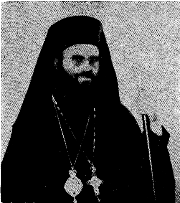
† Ὁ Σεβ. Μητροπολίτης Λαρίσης, Πλαταμῶνος καὶ Τυρνάβου κ. Σεραφεῖμ

Νησιώτη, ὥστε νὰ ἀποκτήσης οὕτω τὰ ἀπαραίτητα πνευματικά ἐφόδια, διὰ τῶν ὁποίων μετέπειτα ὡς Ἱερεὺς καὶ Ἱεροκλήρῳ κατέστησες ζωντανήν τὴν παρουσίαν τῆς Ἐκκλησίας εἰς τε τὸ Σχολεῖον, ὡς καὶ εἰς πλείστας Στρατιωτικὰς Μονάδας, ὅπου καρποφόρως εἰργάσθης καὶ ὁπόθεν ἀξίως ἀπεκόμισες εὐφήμες μνείας.