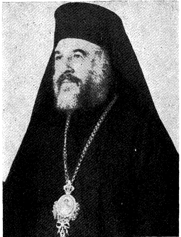
† Ὁ Σεβ. Μητροπολίτης Θεσσαλιώτιδος καὶ Φαναριοφερσάλων κ. Κλεόπας

Ἐγεννήθη ἐν Ἀταλείᾳ, τὴν καταγωγὴν ἔλκων ἐκ πατρὸς ἐκΜαζεϊκῶν Καλαβρύτων, ἐν ἔτει 1915. Ἀνετράφη ἐν Ἀθήναις, ὅπου καὶ ἔλαβε τὴν στοιχειώδη μόρφωσιν. Ἐν συνεχείᾳ ἤκουσε τὰ γράμματα τῆς μέσης ἐκπαιδεύσεως καὶ ἐν τέλει ἐφοίτησεν εἰς τὴν Θεολογικὴν Σχολὴν τοῦ Πανεπιστημίου Ἀθηνῶν.