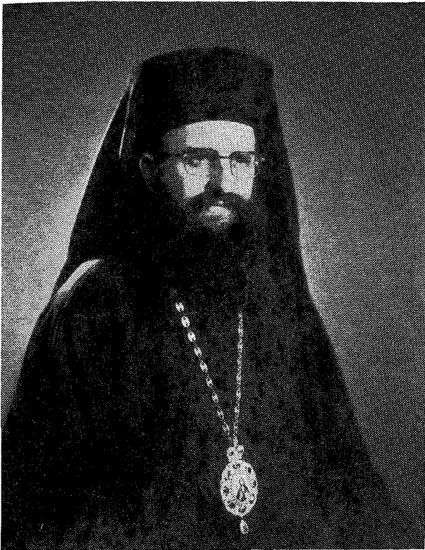
† Ὁ Σεβ. Μητροπολίτης Ἀλεξανδρουπόλεως κ. Ἄ ν θ ι μ ο ς

Του καὶ ἀναδειχθῶ ἄξιος εἰς τὴν ἐν τῇ Ἐκκλησίᾳ νέαν διακονίαν μου. Θεωρῶ ὑποχρέωσίν μου κατὰ τὴν ὥραν ταύτην νὰ ἐκφράσω τὰς εὐχαριστίας μου πρὸς τὸν Μακαριώτατον Πρῶτον τῆς Ἱερᾶς Συνόδου Ἀρχιεπίσκοπον Ἀθηνῶν κ. Σεραφεῖμ καὶ τοὺς Σεβασμιώτατους Ἀρχιερεῖς, μέλη Ἀδτιῆς, οἵτινες με ἐτίμησαν διὰ τῆς ψήφου των καὶ με ἐξέλεξαν Ἐπίσκοπον τῆς Ὀρθοδόξου Ἐκκλησίας τοῦ Χριστοῦ. Ἄλλ' ὅλος ἰδιαίτερός ἀποτελεῖ δι' ἐμὲ καθήκον νὰ ἐκφράσω τὴν βαθεῖαν ἐγγνωμοσύνην μου πρὸς ὑμᾶς, Σεβασμιώτατε Ἅγιε Θήρας, δι' ὅλην τὴν πρὸς ἐμὲ ἐπὶ ἔτη πολλὰ ἐπιδειχθεῖσαν πατρικὴν ἀγάπην σας. Σὰς ἐγνώρισα, θεία ἐπινεύσει, καὶ σὰς ἐθεώρησα ἀπὸ τῆς πρώτης στιγμῆς πνευματικὸν πατέρα μου, τῆς πατρότητος ταύτης ἐπικυρωθείσης διὰ τῆς διὰ τῶν τιμίων χειρῶν σας χειροτονίας εἰς τοὺς βαθμοὺς τοῦ διακόνου καὶ τοῦ πρεσβυτέρου, καὶ σήμερον τοῦ Ἐπισκόπου. Ἡ ταπεινώσις σας, ἡ σωφροσύνη σας, ἡ εἰρήνη σας, τὸ καλοκάγαθον τῆς καρδίας σας, ἡ ἀγάπη σας, ἡ εὐγένειά σας, τὸ ἐκκλησιαστικὸν φρόνημά σας καὶ ὁ ὑποδειγματικὸς βίος σας, ἀπετέλεσαν δι' ἐμὲ διαρκὲς μάθημα ἱερατικοῦ ἥθους. Σὰς εὐχαριστῶ καὶ σὰς ἐγγνωμονῶ δι' ὅλα.