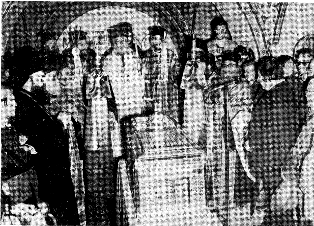
Ὁ Μακ. Ἀρχιεπίσκοπος Ἀθηνῶν καὶ πάσης Ἑλλάδος κ. Σεραφείμ κατὰ τὴν τελετὴν τῆς μεταφορᾶς τῶν λειψάνων τοῦ Ἱερομάρτυρος Γρηγορίου Ε΄ ἐκ τοῦ παρεκκλησίου εἰς τὸν κυρίως Καθεδρικὸν Ναὸν Ἀθηνῶν.

Κατὰ τὸν ἔχοντα τὴν τιμὴν νὰ σᾶς εὐχαριστῆ σήμερα, Μακαριώτατε, ἐκ μέρους τῶν ἀπανταχοῦ τοῦ κόσμου Δημησιανῶν, ὁ Γρηγόριος ὁ Ε΄, ἐνῶ ὠδηγεῖτο ὑπὸ τῶν δεινῶν νὰ κρεμασθῆ εἰς τὴν μεσαιάν πόλιν τῶν Πατριαρχείων τῆς Κωνσταντινουπόλεως, ἔδωκε παραγγελίαν διὰ μίαν θαυμασίαν πολιτιστικὴν γεφύρωσιν. Τὸ δράμα τὸ «Πόλη — Ἀθήνα — Σπάρτη — Δημησιόνα» πρέπει νὰ πραγματοποιηθῆ διὰ τοὺς νέους. Ὅλοι αἱ σημεριναὶ ἐκδηλώσεις τῆς νεολαίας, ἀκόμη καὶ αἱ πλέον ἐπαναστατικαί, τὸν Χριστὸν καὶ τὸν Γρηγόριον ἔχον ὡς πρότυπα, παράλληλα τρίπτυχα: Ἀγάπη — Ἀδελφότης — Εὐαγγέλιον, τοῦ Χριστοῦ τὸ Εὐαγγέλιον. Ἀξιοπρέπεια — Ἐλευθερία — Ἀνεξαρτησία, τοῦ Γρηγορίου τὸ Σχοινί.