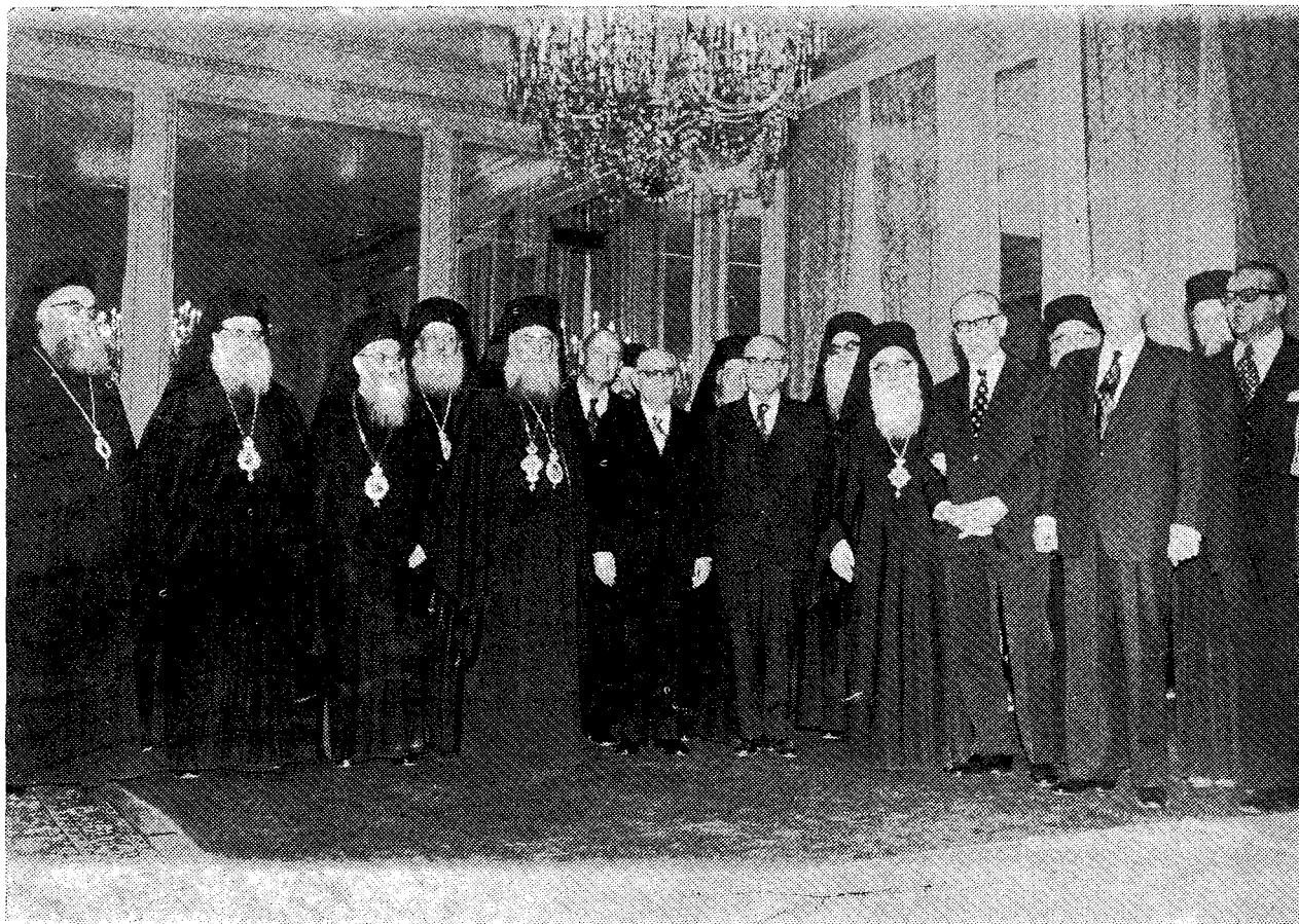
Ὁ Μακρ. Ἀρχιεπίσκοπος Ἀθηνῶν κ. Σεραφεῖμ καὶ ὁ Πρόεδρος τῆς Δημοκρατίας κ. Μ. Στασινοπούλου, ἐν μέσῳ Ἱεραρχῶν τῆς Ἐκκλησίας τῆς Ἑλλάδος καὶ ἐκπροσώπων τῆς Πολιτείας εἰς ἀναμνηστικὸν στιγμιότυπον κατὰ τὸ ἐπίσημον γεῦμα ἐπὶ τῇ ἐορτῇ τῆς Κυριακῆς τῆς Ὁρθοδοξίας (23/3/1975).

Οὕτως ἡ ὅλη ἐόρτιος ἐκδήλωσις ἐπὶ τῇ ἐπετείῳ τοῦ θριάμβου τῆς Ὁρθοδοξίας κατὰ τῶν κακοδόξων ἐχθρῶν αὐτῆς ἐτόνισε μὲν καὶ ὑπεγράμμισε τὴν ζῶσαν καὶ ἀκατάλυτον ἰσχὺν τῶν Χριστιανοελληνικῶν παραδόσεων, ὑπέμνησε δὲ πρὸς πάντας τὸν σωστικὸν ρόλον τῆς Ὁρθοδοξίας δι' ἐλόκληρον τὸν κόσμον οὐ μόνον εἰς τὸ παρελθόν, ἀλλὰ καὶ εἰς τὸ παρόν, ὅτε ἡ πνευματικὴ καὶ ἠθικὴ πτώσις τοῦ συγχρόνου ἀνθρώπου ἐγκυμονεῖ κάθε εἶδος κινδύνων καὶ θλίψεων.