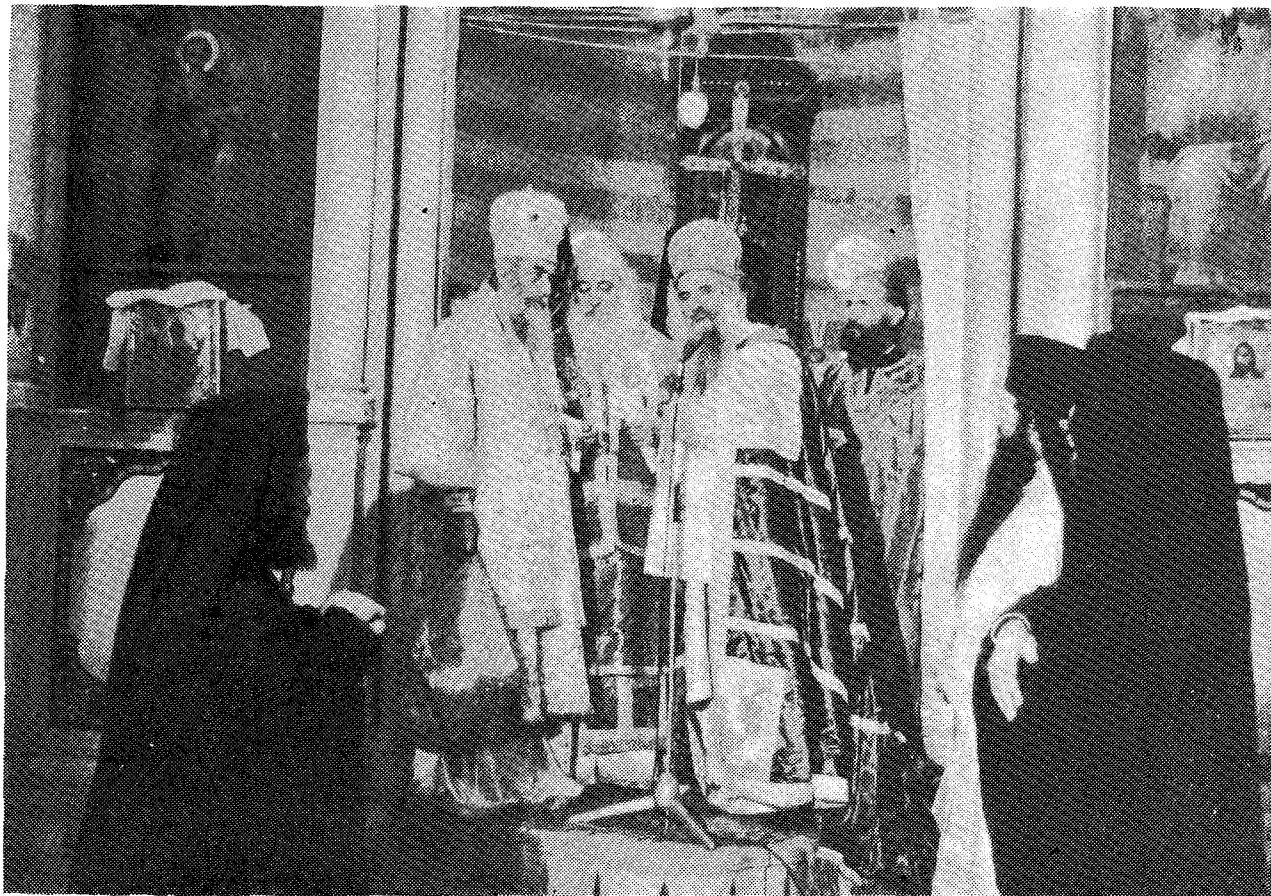
'Ο Μακ. Πατριάρχης 'Αντιοχείας κ. 'Η λ ί α ς προσφωνῶν τὸν Μακ. 'Αρχιεπίσκοπον κ. Σ ε ρ α φ ε ἰ μ μετὰ τὴν Θ. Λειτουργίαν ἐν τῷ 'Ι. Πατριαρχικῷ Ναφ. 'Εν μέσῳ τῶν δύο Προκαθημένων ὁ Θεοφ. 'Επίσκοπος Δέρβης κ. Κ ο σ μ ᾶ ς.

Εἰς αὐτὸ παρεκάθησαν—ἐκτὸς τοῦ Πατριάρχου, τοῦ 'Αρχιεπισκόπου καὶ τῆς Συνοδείας Του—οἱ Σ.ε.β. Μητροπολίται Βόστρον κ. Βασίλειος, Βαγδάτης κ. Κωνσταντῖνος, 'Επιφανείας κ. 'Αθανάσιος, Λαοδικείας