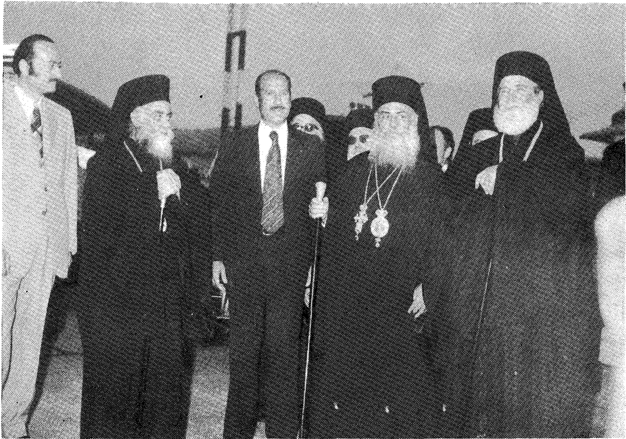
Ὁ Μακ. Ἀρχιεπίσκοπος Ἀθηνῶν κ. Σερφεῖμ καὶ οἱ Σεβ. Κίτρος κ. Βαρνάβας καὶ Φθιώτιδος κ. Δαμασκηνός μετὰ τοῦ Ἀντιπροέδρου τῆς Λιθανικῆς Κυβερνήσεως κ. Μ. Σασίν καὶ τοῦ Ὑπουργοῦ Οἰκονομικῶν κ. Ἀμπάς Χάλαφ.