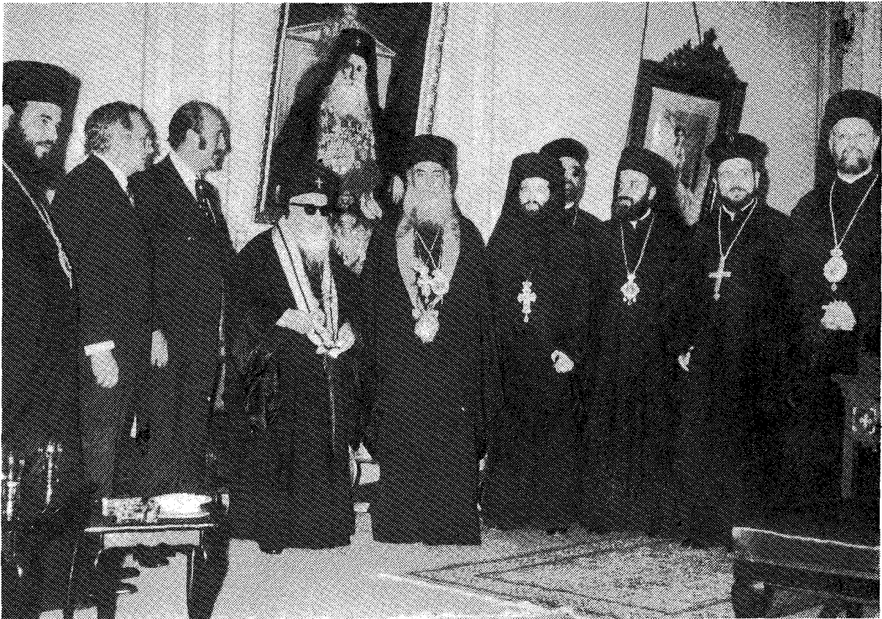
Ὁ Μακ. Ἀρχιεπίσκοπος Ἀθηνῶν κ. Σεραφεῖμ καὶ ὁ Σεβ. Μητροπολίτης Βηρυτοῦ κ. Ἡλίας, ἐν μέσῳ Ἱεραρχῶν τῆς Ἐκκλησίας τῆς Ἑλλάδος καὶ τοῦ Πατριαρχείου Ἀντιοχείας. Δεξιὰ τοῦ Μητρ. κ. Ἡλίου ὁ Ἀντιπρόεδρος τῆς Κυβερνήσεως τοῦ Λιβάνου κ. Μιχαὴλ Σασίν.

Ὁ Ἐξοχώτατος Πρόεδρος τῆς Λιβανικῆς Δημοκρατίας κ. Σόλομὼν Φραντζίε μοῦ ἀνέθεσε τὴν ἐξαίρε-