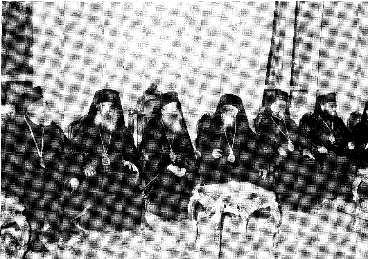
Ὁ Μακ. Πατριάρχης Ἀντιοχείας κ. Ἡ λ ί α ς καὶ ὁ Μακ. Ἀρχιεπίσκοπος Ἀθηνῶν κ. Σ ε ρ α φ ε ῖ μ ἐν μέσῳ τῶν Σεβ. Μητροπολιτῶν Κίτρους κ. Β α ρ ν ᾶ β α, Κορινθίας κ. Π α ν τ ε λ ε ῆ μ ο ν ο ς, Φθιώτιδος κ. Δ α μ α σ κ η ν ο ῦ καὶ Δημητριάδος κ. Χ ρ ι σ τ ο δ ο ῦ λ ο υ.

Ἐνοῦντες, ὑπὸ τὰς σκέψεις αὐτάς, τὰς δεήσεις ἡμῶν πρὸς Κύριον, μετὰ τοῦ θεολέκτου τούτου Λαοῦ, ὅστις ἐν τῷ προσώπῳ Ἑμῶν εἶρε τὸν Ποιμένα τὸν Καλόν, τὸν τιθέντα τὴν ψυχὴν αὐτοῦ ὑπὲρ τῶν ἐμπεπιστευμένων Αὐτῷ Λογικῶν Προβάτων, εὐχόμεθα, ὅπως ὁ Κύριος χαρίζηται Ἑμᾶς, Μακαριώτατε, ταῖς Ἀγίαις Αὐτοῦ Ἐκκλησίαις, σῶρον, ἐντιμον, ὑγιᾶ,