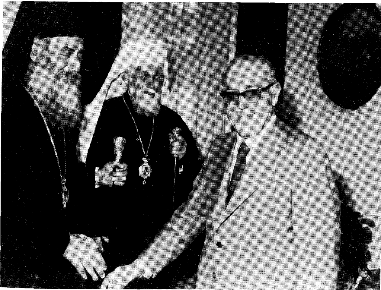
Ὁ Μακ. Πατριάρχης Βουλγαρίας κ. Μάξιμος ἐν μέσῳ τοῦ Μακ. Ἀρχιεπισκόπου Ἀθηνῶν κ. Σεραφεῖμ και τοῦ Προέδρου τῆς Ἑλληνικῆς Δημοκρατίας κ. Μ. Στασινοπούλου.

7. Τὴν μεσημβρίαν τῆς αὐτῆς ἡμέρας πρὸς τιμὴν τοῦ ἀγιωτάτου Πατριάρχου παρέθεσεν εἰς τὸ ξενοδοχεῖον «Βασιλεὺς Γεώργιος» πρόγευμα ὁ ἐξοχώτατος Ὑφυπουργὸς Ἐξωτερικῶν κ. Κωνσταντῖνος Σταυρόπουλος, λόγῳ ἀπουσίας εἰς τὸ ἐξωτερικὸν τοῦ Ὑπουργοῦ κ. Δημ. Μπιτσιῦ. Εἰς τὸ Γεῦμα αὐτό, ἐκτὸς τοῦ Πατριάρχου και τῶν Συνοδῶν του, τοῦ Μακ. Ἀρχιεπισκόπου και τῆς Ἱερᾶς Συνόδου, παρεκάθησαν ὁ ἐξοχώτατος Πρέσβυς τῆς Βουλγαρίας κ. Γεώργιος Πετκόφ, ὁ Πρύτανις τοῦ Ἐθνικοῦ Πανεπιστημίου κ. Ἀνδρέας Φυτράκης, ὁ Κοσμητὼρ τῆς Θεολ. Σχολῆς κ. Σάββας Ἀγουρίδης, ὁ Γεν. Διευθυντὴς Ὁρησκει-