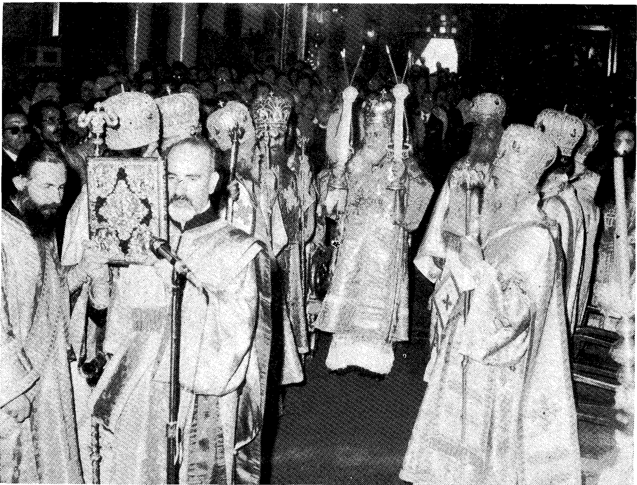
Στιγμιότυπον από την Θείαν Λειτουργίαν, ην έτέλεσεν ο Μακ. Πατριάρχης Βουλγαρίας κ. Μ ά ξ ι μ ο ς έν τῷ Ίερῷ Μητροπολιτικῷ Ναῷ Άθηνῶν μεθ' έτέρων Ίεραρχῶν της Άκολουθίας του και της Έκκλησίας της Έλλάδος.

Ηδφράνθημεν, Μακαριώτατε, επί τοις ειρημένοις