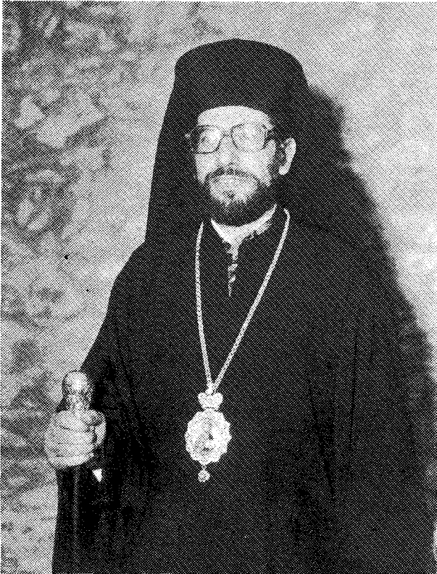
† Ὁ Σεβ. Μητροπολίτης Γαρδικίου κ. Χρυσόστομος

τοῦ Γυμνασιακοῦ αὐτῆς Τμήματος, κατὰ Ἰούλιον δὲ τοῦ 1956 ἔλαβε τὸ Ἀπολυτήριο τοῦ Γυμνασίου μὲ τὸν βαθμὸν «Ἀριστα».