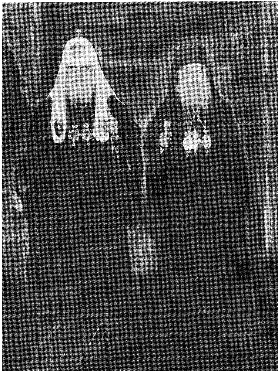
Ὁ Μακ. Πατριάρχης Μόσχας καὶ πάσης Ρωσίας κ. Ποιμὴν καὶ ὁ Μακ. Ἀρχιεπίσκοπος Ἀθηνῶν καὶ πάσης Ἑλλάδος κ. Σεραφεῖμ.

ΕΤΟΣ ΝΓ' | ΤΕΥΧ. Α' | ΑΘΗΝΑΙ, Ι. ΓΕΝΝΑΔΙΟΥ 14, Τ. 140-ΤΗΛ. 718-308 | 16 ΣΕΠΤΕΜΒΡΙΟΥ 1976 | ΑΡΙΘ. 21