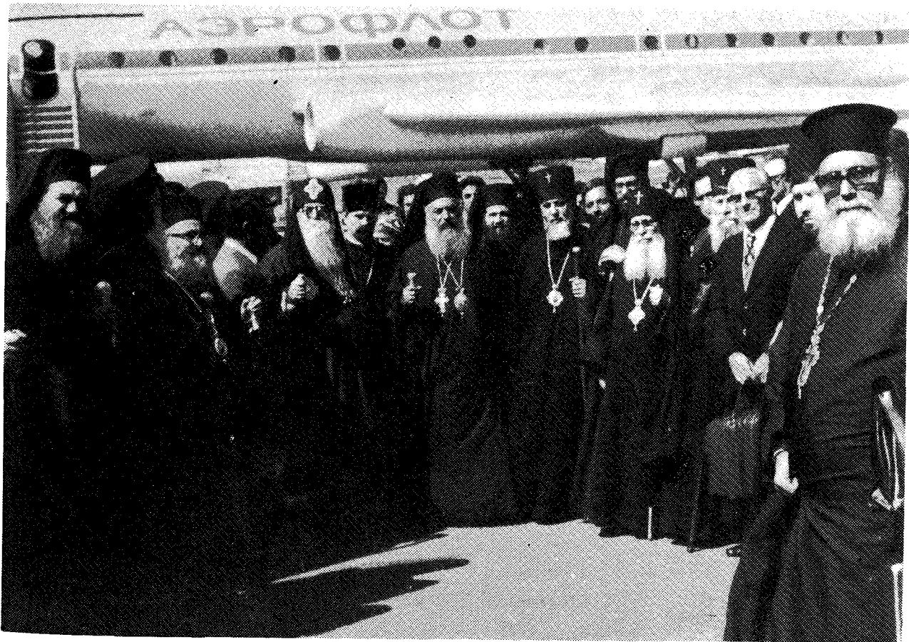
Οἱ Προκλήμενοι τῶν Ἐκκλησιῶν Ἑλλάδος κ. Σεραφείμ καὶ Γεωργίας κ. Δαβίδ Ε', περιστοιχούμενοι ὑπὸ Ἀρχιερέων, κληρικῶν καὶ λαϊκῶν κατὰ τὴν ἀφίξιν τῆς Ἑλλ. ἀντιπροσωπείας εἰς τὸ ἀεροδρόμιον τῆς Τυφλίδος.

Μεταφέρομεν ἀσπασμὸν ἀγάπης καὶ κοινωνίας τῆς Ἐκκλησίας τῆς Ἑλλάδος πρὸς δλόκληρον τὴν Ἱεραρχίαν, τὸν κληρὸν καὶ τὸν εὐλογημένον λαόν τῆς Γεωργίας. Καὶ ἐπικαλούμεθα τὴν εὐλογίαν τοῦ Ἀρχιεπίσκοπου Χριστοῦ ἐπὶ τε τὸν Κλήρον καὶ τὸν Λαόν, ἵνα ἐνισχύσῃ ἅπαντας εἰς τὸν ἀγῶνα ὑπὲρ τῆς δόξης