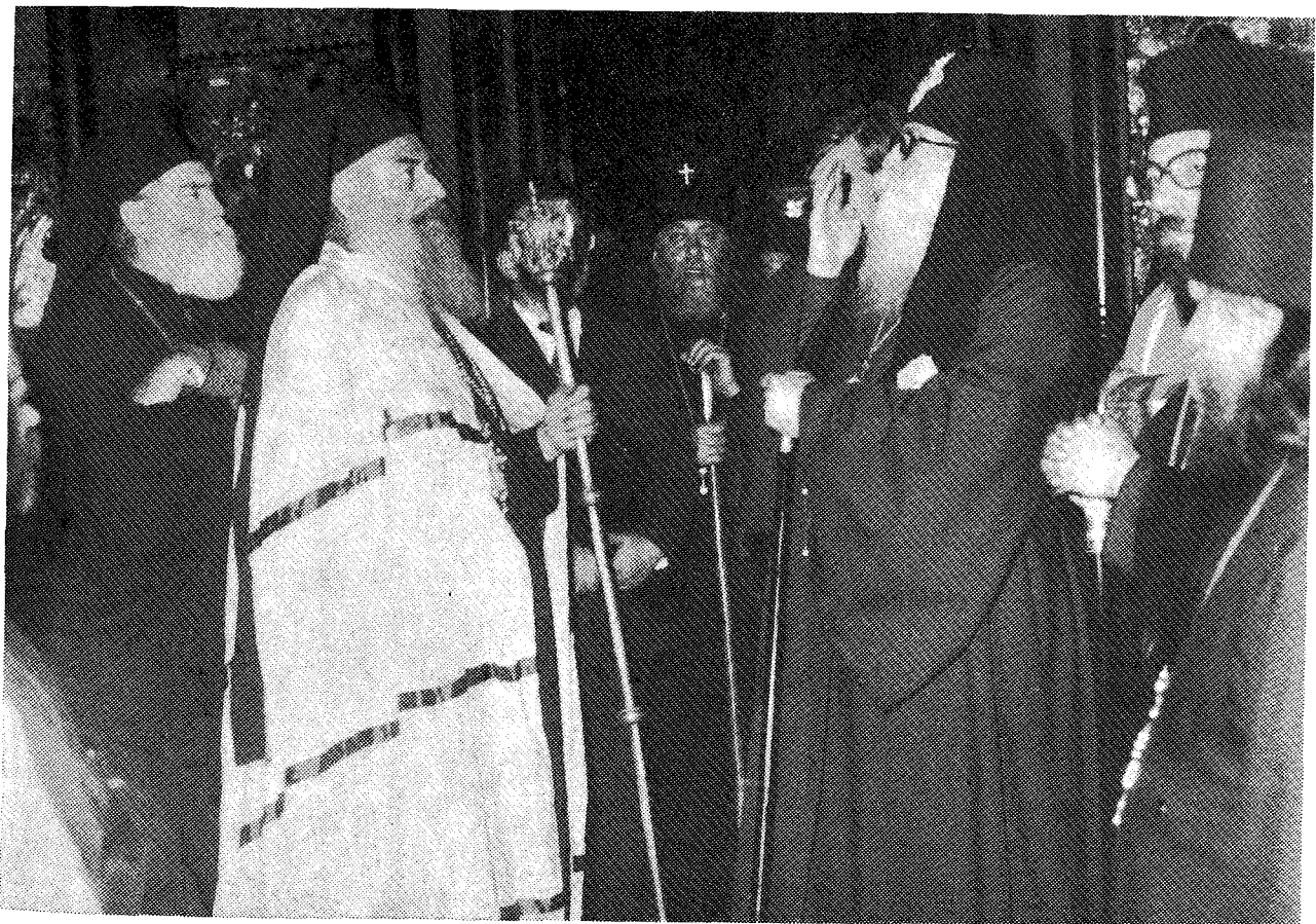
Ὁ Μακ. Ἀρχιεπίσκοπος Ἀθηνῶν καὶ πάσης Ἑλλάδος κ. Σεραφεῖμ καὶ ὁ Πατριάρχης Γεωργίας κ. Δαβίδ ὁ Ε', μετὰ τῆς ἀκολουθίας τῶν, κατὰ τὴν Δοξολογίαν ἐπὶ τῇ ἀφίξει εἰς Τυφλίδα.

Π.χ. α) εἰς τὴν Σύνοδον τῆς Νικαίας (325) ἔλαβε μέρος ὁ ἐπίσκοπος Πιτυοῦντος ἅγιος Πατροφίλος. β) ἐν συνεχείᾳ θὰ ἠδυνάμεθα νὰ ὁμιλήσωμεν διὰ μακρῶν περὶ τῆς λογοτεχνίας, τέχνης, ἀρχιτεκτονικῆς, φιλοσοφίας κλπ. Περιοριζόμεθα νὰ τονίσωμεν, ὅτι μέρος τῆς λογοτεχνικῆς δραστηριότητος τῆς χώρας μας ἦτο ἡ μετάφρασις τῶν ἔργων πολιτισμοῦ τῶν Ἑλλήνων. Αἱ ἐργασίαι τῶν Γεωργιανῶν μεταφραστῶν ἐπλούτισαν καὶ τὴν Γεωργιανὴν καὶ τὴν Ἑλληνικὴν λογοτεχνίαν. Μετεφράσθησαν τότε τὰ ἔργα τῶν: Ἰωάννου τοῦ Χρυσοστόμου, Γρηγορίου τοῦ Θεολόγου, Γρηγορίου Νύσσης, Βασιλείου τοῦ Μεγάλου, Ρωμανοῦ τοῦ Μελωδοῦ, Ἰωάννου τοῦ Δαμασκηνοῦ κ.ἄ. γ) τὸ κορύφωμα ὅμως τῆς τοιαύτης δραστηριότητος ἦτο