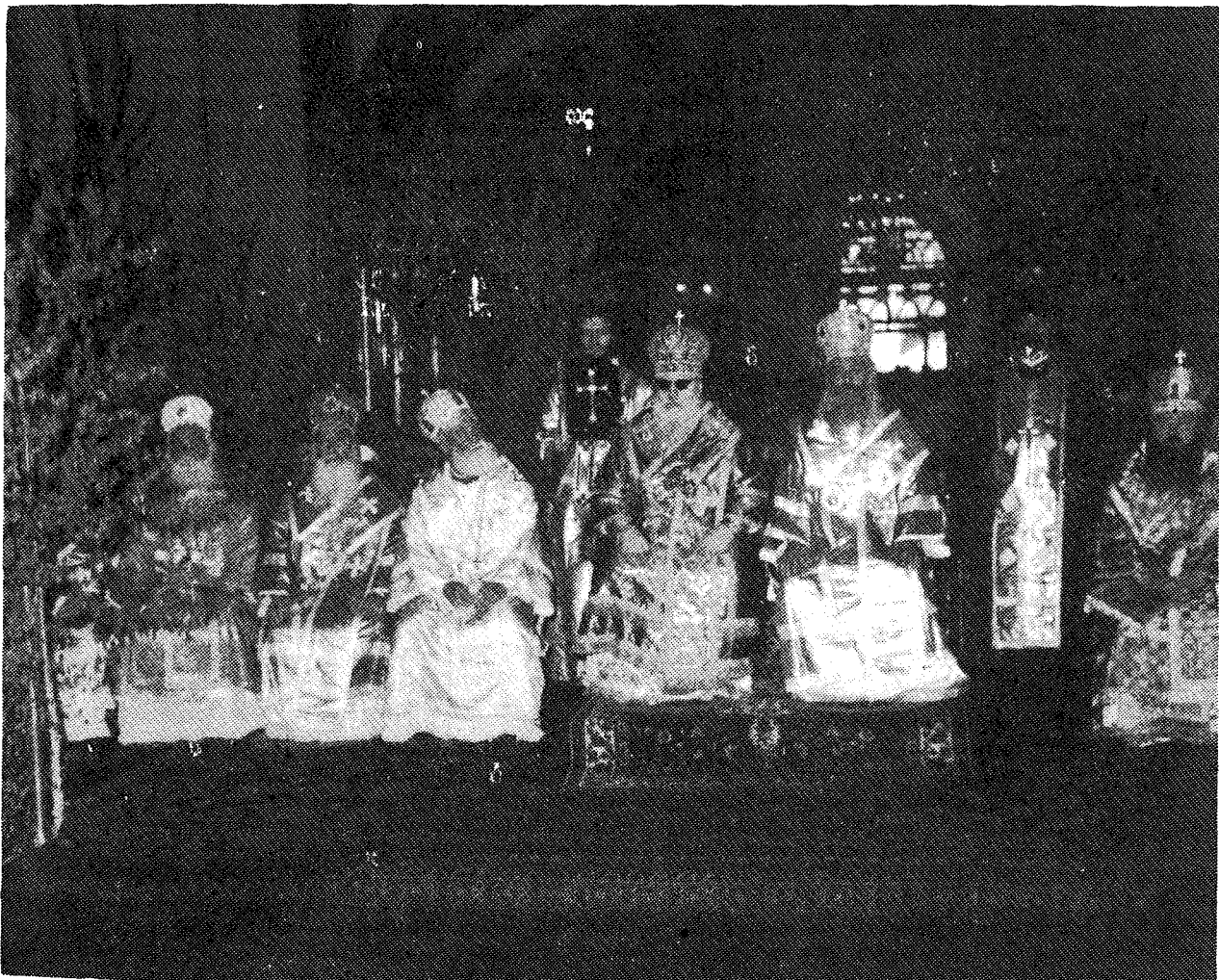
Οἱ Προκαθήμενοι τῶν δύο ἀδελφῶν Ἐκκλησιῶν μετὰ τῆς ἀκολουθίας αὐτῶν κατὰ τὴν Θεῖαν Λειτουργίαν.

Εἶθε δὲ ἡ χάρις τοῦ Ἁγίου Πνεύματος νὰ πληροῖ