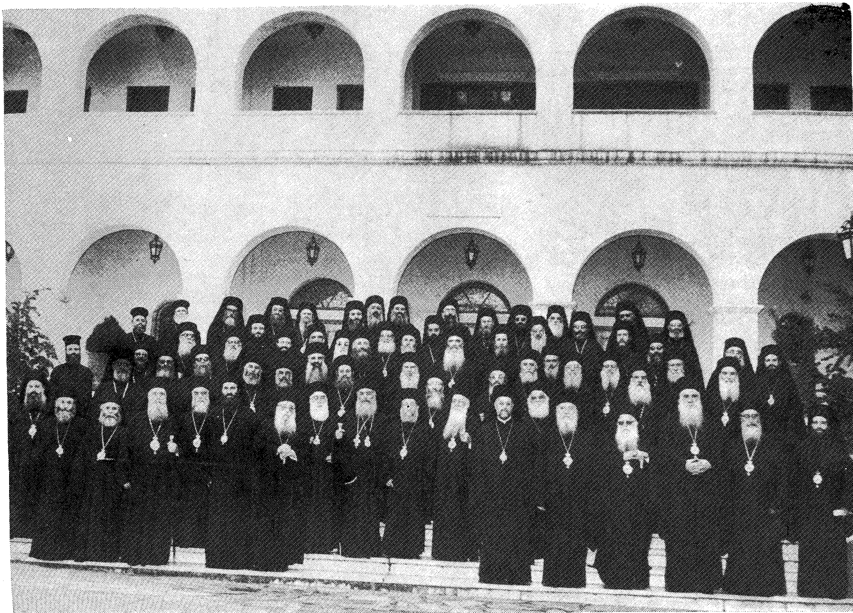
Ἡ Ἱερά Σύνοδος τῆς Ἱεραρχίας τῆς Ἐκκλησίας τῆς Ἑλλάδος, ἐπὶ τῇ τακτικῇ συνελούσει Αὐτῆς, ἐν τοῖς προπυλαίοις τῆς ἱερᾶς Μονῆς Πεντέλης.