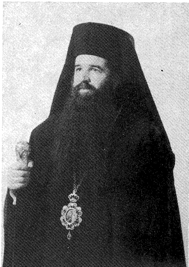
† Ὁ Σεβασμ. Μητροπολίτης Καλαβρύτων καὶ Αἰγιαλείας κ. Ἀ μ β ρ ο σ ι ο ς

Καὶ ὁ ἐνδόμυχος πόθος ἐνισχύθη ἔτι μᾶλλον, ὅτε πρὸ βμηρον περίπου, μετὰ ἀπὸ μίαν ἐξαίρετον ὁμιλίαν τοῦ τότε Τιτουλαρίου Ἐπισκόπου Ταλαντίου καὶ ἡδὴ Ποιμενάρχου μας Ἀμβροσίου, ὁ μακαριστός, τότε Ποιμενάρχης μας Γεώργιος, εἰς μίαν ἀνύσφαιραν ἄκρως συγκινητικὴν, ἐλλησίασεν ἐν ἀγάπῃ καὶ ἠσπάσθη τὸ πρόσωπον τοῦ τότε Ἐπισκόπου Ἀμβροσίου καὶ ἐν συνεχείᾳ, ἀφροῦ ἀφήρσε ἀπὸ τὸ ἰδικόν του σιῆθος τὸ Ἀρχιερατικὸν του Ἐγκόλιον, τὸ προο-