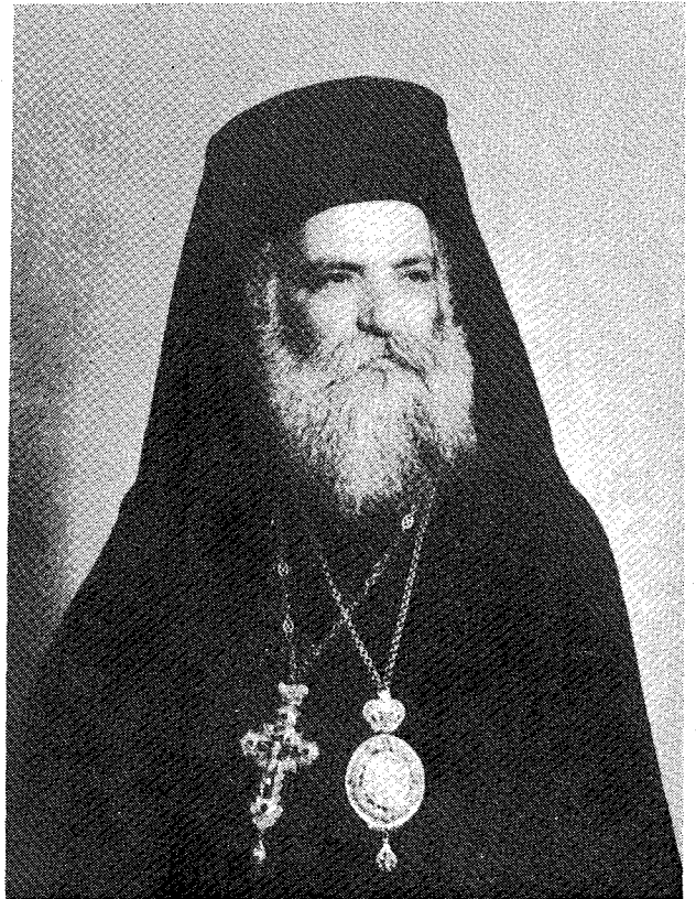
(†) Ὁ εἰς Κύριον ἐκδημήσας Μητροπολίτης Χίου Κυρὸς Χρυσόστομος

Ἀκμαῖος ἔτι τὴν ἡλικίαν ἐξεδήμεσεν εἰς Κύριον ὁ Μητροπολίτης Χίου, Ψαρῶν καὶ Οἰνουσσῶν Κυρὸς Χρυσόστομος (Γιαλούρης). Ὁ μεταστάς ἐγεννήθη ἐν Παλαιοχωρίῳ Λέσβου τὸ 1916. Ἀριστοῦχος τῆς Θεολογικῆς Σχολῆς τοῦ Πανεπιστημίου Ἀθηνῶν καὶ, ἐν συνεχείᾳ, τῆς Σχολῆς Ἱεροκηρύκων τῆς Ἀποστολικῆς Διακονίας, ἐσπούδασε καὶ τὴν Βυζαντινὴν Μουσικὴν.