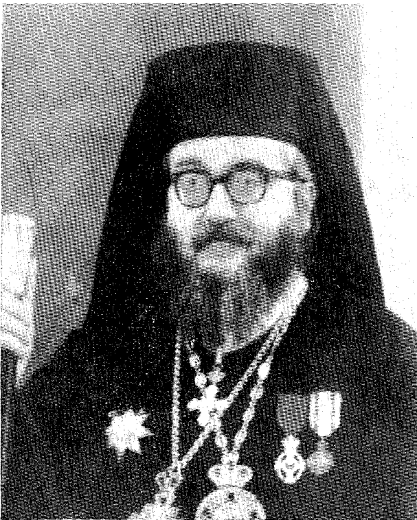
† Ὁ εἰς Κύριον ἐκδημήσας Μητροπολίτης πρ. Βεροίας καὶ Ναούσης Κυρὸς Κ α λ λ ί ν ι κ ο ς

Ὡς Ἐπίσκοπος Ὁλύμπου ὁ Καλλίνικος παρουσίασε πλουσίαν δράσιν, ἣτις ἐφθασεν εἰς ἕξαρσιν κατὰ τὴν ἐπισυμβάσαν γερμανικὴν κατοχὴν, καθ' ἣν ἐπέδειξεν ἔθναρχικὰς ἱκανότητες.