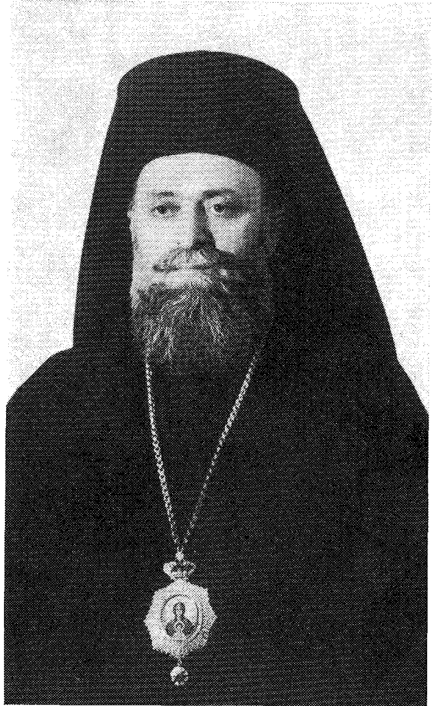
† Ὁ Σεβασμ. Μητροπολίτης Χίου, Ψαρῶν καὶ Οἴνουσσῶν κ. Νικηφόρος

Καὶ διὰ τὴν πνευματικὴν σου ἰκανότητα καὶ τὴν ἐν τῇ Ἐκκλησίᾳ, ὅπου ἂν ἐτάχθῃς, ἀκαταπύνητον δραστηριότητά σου, ἀλλὰ καὶ διὰ τὸ ἦ θ ο ς σου, τὰς ἀρετὰς σου καὶ τὸν εὐ θ ὸ καὶ ἀ κ ἑ ρ α ι ο ν χ α ρ α κ τ ῆ ρ α σου, ἡ Ἐκκλησία τῆς Ἑλλάδος, διὰ τῆς Ἱερᾶς Συνόδου τῆς Σεπτιῆς Ἱεραρχίας Αὐτῆς, λαβοῦσα πάντα ταῦτα, τὰ πνευματικὰ καὶ ἠθικά σου προσόντα ὑπ' ὄψει, ἀλλὰ καὶ τὴν λαμπρότητα σου μὲν ὅσοις, τὴν ὁποῖαν ἀπέκτησας τόσον ἐδῶ ὅσοι καὶ ἐν τῇ Ἑσπερίᾳ, ἔγνω νὰ σὲ προαγάγῃ καὶ νὰ σὲ ἀνταμείψῃ, ἀνθ' ὧν ὑπὲρ τῆς Μητροδὸς Ἐκκλησίας ἐκοιτίσας καὶ προσέφερας, καὶ νὰ παραδώσῃ μετὰ ἐμπιστοσύνην εἰς τὰς χεῖρας σου τὸν λαὸν μίας Μητρο-