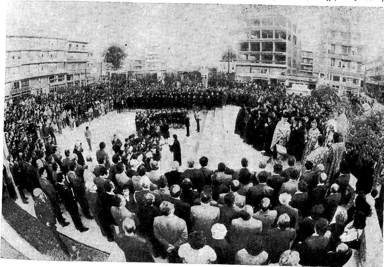
Κατὰ τὴν ἰ. Ἀκολουθίαν εἰς τὴν Κεντρικὴν Πλατεῖαν Κατερίνης μὲ συμμετοχὴν τῶν ἐπισήμων καὶ χιλιάδων λαοῦ.

Διὰ τὴν εὐχάριστον ἔκκληξιν ἐξήσαμεν ἀπὸ μίαν συνβίωσιν ὅλων τῶν στρωμάτων τῶν πολιτῶν, τῆς Ἐκκλησίας καὶ τῶν Ἀρχῶν, τῶν πολιτικῶν καὶ στρατιωτικῶν ὁργάνων, τῶν καθηγητῶν καὶ τῶν μαθητῶν. Αὐτὸ εἶναι ἴσως εὐχάριστον καὶ ἴσως ὠραῖον, ὥστε δὲν μπορεῖ νὰ ξεχασθῇ ποτέ. Πολλὸν περισσότερο, ὅτι δὲν πρόκειται περὶ περιπτώσεως ἢ ὁποῖα παρατηρεῖται παντοῦ εἰς τὸν κόσμον. Διὰ τοῦτο νὰ εἴμεθα ἐγγνώμονες πρὸς τὸν Θεόν, ὁ ὁποῖός μας συνήγαγεν ὅλους, ἐπισχυμένους διὰ τῆς