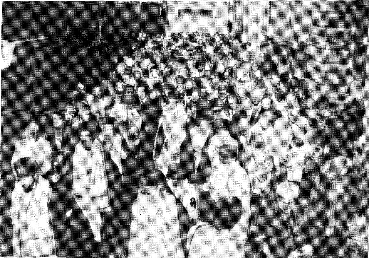
Ἡ νεκρώσιμος πομπή ἐνῶ μεταφέρει τὸ σκήνωμα τοῦ μακαριστοῦ Πατριάρχου εἰς τὴν τελευταίαν του κατοικίαν.

Μετὰ τὴν ἀπόλυσιν τῆς νεκρώσιμου ἀκολουθίας σχηματισθεῖσης πομπῆς, ἧς προηγούντο ὁ Σταυρὸς καὶ τὰ ἱερὰ λάβαρα, οἱ πρόσκοποι τῶν Ὁρθοδόξων Κοινοτήτων τῆς Ἱερουσαλὴμ καὶ τῶν γειτονικῶν πόλεων, καὶ οἱ βαστάζοντες τὰ παρῶσημα τοῦ μεταστάντος Πατριάρχου, ἐγένετο ἡ ἐκφορά τοῦ ἱεροῦ σκήνου, πεζῇ, διὰ τῶν ὁδῶν τῆς Ἁγίας Πόλεως καὶ ἕως τοῦ Ἀρμενικοῦ Μοναστηρίου, εὐρισκομένου πλησίον