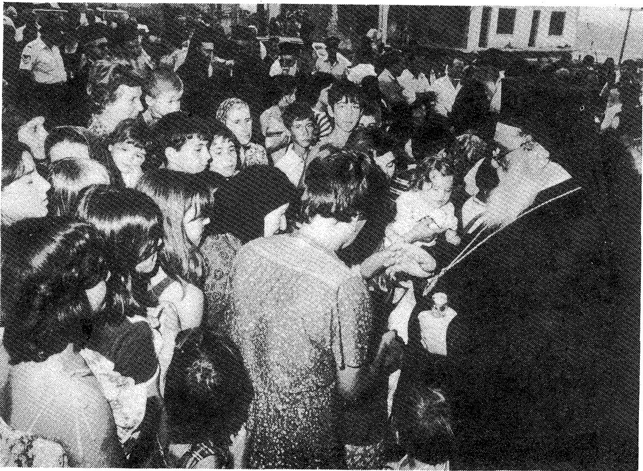
Πλήθος Χριστιανῶν, ἰδιαιτέρως δὲ παιδιῶν, σπεύδουν νὰ ἀσπασθοῦν τὴν Δεξιὰν τοῦ Μακ. Πατριάρχου, κατὰ τὴν ἐπίσκεψίν Του εἰς τὰς πληγείσας ἐκ τῶν σεισμῶν Πλαταιάς.

Ἐπὶ τῇ εὐσήμερ ὅμως εὐκαιρίᾳ ταύτῃ, οὐ δυνάμεθα, μὴ ἐπιβεβαιῶσαι, ἅπερ Ὑμεῖς, οἱ ἐκ τῆς ἐνδελεχοῦς ἐγκύψεως αισθανόμενοι τὴν φλόγαν τῶν πραγμάτων, καθημερινῶς θεδαιοῦτε, ὅτι «ἐν ἀρχῇ ἦν ὁ Λόγος καὶ ὁ Λόγος ἦν πρὸς τὸν Θεὸν καὶ Θεὸς ἦν