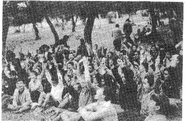
Ἀξιοποίησις τοῦ Διημέρου διὰ τὴν ποιμαντικὴν τῶν παιδιῶν.

Κατὰ τὸ θέρος και διὰ τὴν τέλεσιν τῆς θ. Λειτουργίας εἰς χῶρους μεγάλῆς συγκεντρώσεως πληθυσμοῦ ἐν τῇ Περιφέρειᾳ (Κατασκηνώσεις παιδῶν, ἐκδρομαίς κλπ) συνιστᾶται ἡ χρησιμοποίησις κινητῶν παρεκκλησιῶν trailer—church. (Πλείονα, βλ. II, 179).