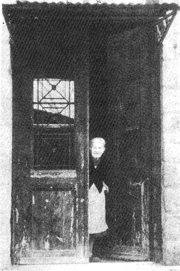
Ποιμαντικὴ μέριμνα διὰ τοὺς μὴ μετακινουμένους...

Οὕτω, τὸ Σάββατον προσφέρεται διὰ τὴν διοργάνωσιν πρῶτον, μᾶς πρωϊνῆς θ. Λειτουργίας (7-9 π.μ.) διὰ τὰς γενικὰς ἀνάγκας τῆς Ἐνορίας (Μνημόσυνα καὶ τὴν θείαν Κοινωνίαν τῶν Βρεφῶν) καὶ δεύτερον, μᾶς εἰδικῆς (δευτέρας) μαθητικῆς θ. Λειτουργίας (9-10 π.μ.), εἰς τὴν ὁποίαν δύναται νὰ προσέρχωνται: ἐλευθέρως 15 οἱ μαθηταὶ καὶ αἱ μαθήτριαι: ἄλλων τῶν σχολικῶν τάξεων καὶ βαθμίδων.