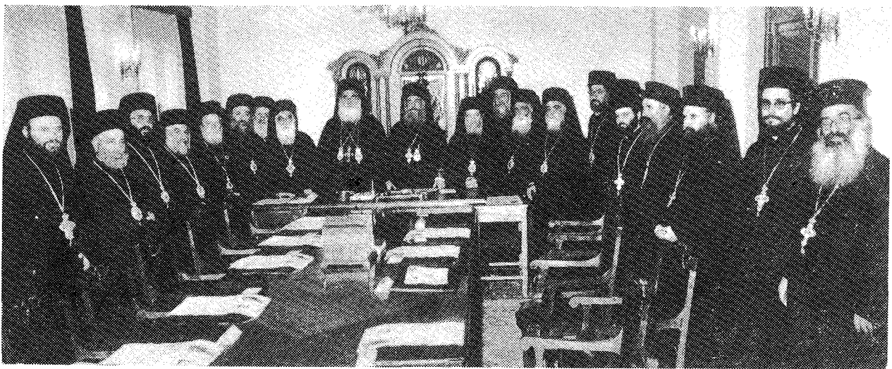
Ὁ Μακ. Πατριάρχης Ἱεροσολύμων κ. Διόδωρος μετὰ τῶν Ἀρχιερατικῶν μελῶν τῆς Συνοδείας αὐτοῦ, δεξιὰ τοῦ Προκαθημένου τῆς Ἐκκλησίας τῆς Ἑλλάδος, ἐν μέσῳ τῶν μελῶν τῆς Διαρκοῦς Ἱερᾶς Συνόδου.

Δοξολογοῦντες ὄθεν, Μακαριώτατε, Ἁγιε Ἱεροσολύμων, τὸν Πανάγιον Τριαδικόν Θεόν ἐπὶ τῇ εὐ-