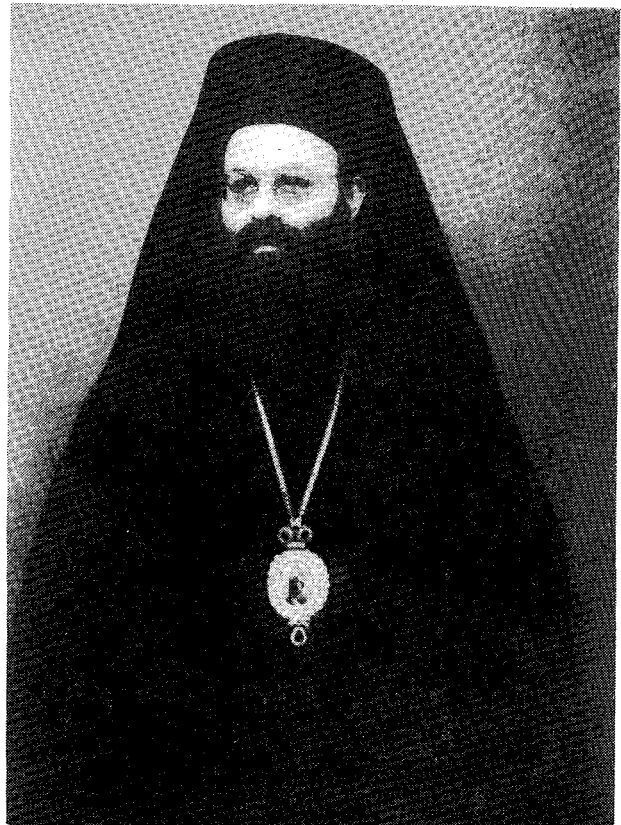
Ὁ Σεβ. Μητροπολίτης Τρίκκης καὶ Σταγῶν κ. Ἀλέξιος

Ἐν συνεχείᾳ τὸν προσεφώνησεν ὁ Δήμαρχος τῆς πόλεως κ. Κ. Παπαστεργίου, ὁ ὅποιος ἀφ' οὗ ἀναφέρθη ἐν συντομίᾳ εἰς τοὺς προκατόχους του Μητροπολίτας καὶ τοὺς συναισθηματικὸς δεσμοὺς τοῦ λαοῦ μετ' αὐτῶν, εἶπεν: