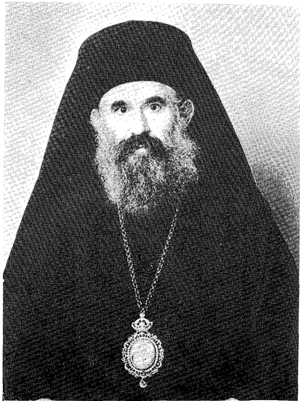
† Ὁ Σεβ. Μητροπολίτης Ἡλείας καὶ Ὠλένης κ. Γερμανός

Πρέπει νὰ εἶναι ὁ ἀκατάπαντος φωτεινὸς σηματοδότης τῆς ὁδοῦ τοῦ Θεοῦ, ὥστε, καταφεύγοντες σ' αὐτὴν οἱ κουρασμένοι στρατοκόποι αὐτῆς τῆς γῆς, 15 νὰ εὐρίσκουν ἀνάπαισιν καὶ χαρὰν. Νὰ εἶναι ὁ πνευματικὸς φάρος, πὸν θὰ ὑποδεικνύῃ τοὺς ποικιλωνύμους καὶ ποικιλομόρφους κινδύνους τῆς ζωῆς, ἀλλὰ καὶ πὸν θὰ φανερώσῃ τὴν εἴσοδον τῆς Ὁρθοδόξου