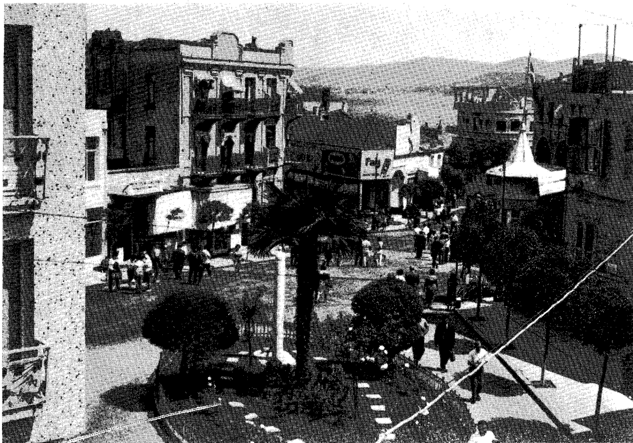
Τὸ πάρκο πὸν κατασκευάστηκε στὴ θέση τοῦ ἱ. ναοῦ Ἰωάννου τοῦ Προδρόμου τῆς νήσου Πριγκήπου (Εἰκ. 3).