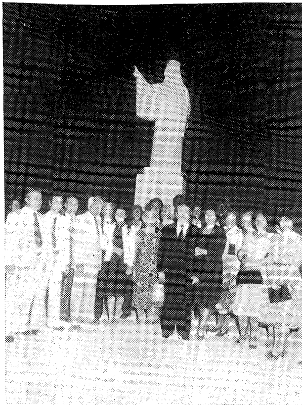
Ὁ Δήμαρχος Ὁρεστιάδος, τὸ Δημοτικὸν Συμβούλιον καὶ συμπολίται των εἰς ἀναμνηστικὴν φωτογραφίαν πρὸ τοῦ ἀποκαλυφθέντος ἀνδριάντος.

9. Ἀλλὰ πρὶν ἢ κατακλείσω τὸν διὰ τὰ Ἀποκαλυπτήρια τοῦ Ἀνδριάντος ἐπιμνημόσυνον, ἅμα καὶ πανηγυρικὸν λόγον μου εἰς τὸν Ἐθνομάρτυρα Πατριάρχην μας, ἐπιτραπέιτω εἰς ἐμὲ νὰ εὐχαριστήσω ἐντελῶς ἰδιαιτέρως τὸν σεβαστὸν καὶ πολὺ ἀγαπητὸν μου, ρέκτην δὲ καὶ δραστηριώτατον Μητροπολίτην Διδυμοτείχου, Ὁρεστιάδος καὶ Σουφλίου Κύριον Ἀγαθὰγγελον, τὸν ἄλλοτε ποτε καὶ φοιτητὴν μου, τὸν ἐξαιρέτου δράσεως καὶ ἐπιδόσεως εἰς πλεῖστα ἔργα κοινῆς ὠφελείας καὶ εὐρυτέρας μορφώσεως