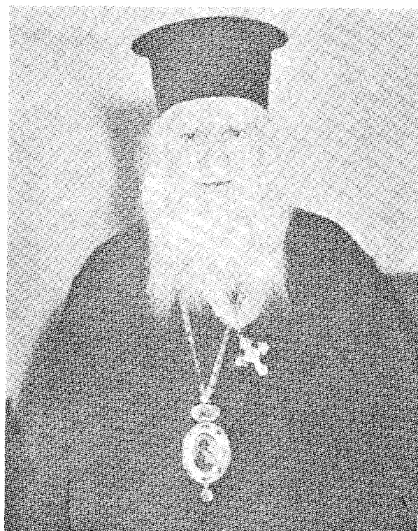
† Ὁ ἀείμνηστος πρ. Θήρας κυρός Γ α β ρ ι ἡ λ.

Τὴν 2αν μεσημβριανὴν τῆς αὐτῆς ἡμέρας ἡ σορὸς μεταφέρθη εἰς τὸν Καθεδρικὸν Ναὸν τῶν Ἀθηνῶν, ὅπου ἐψάλη ἡ ἐξόδιος Ἀκολουθία, προεξάρχοντος τοῦ Μακ. Ἀρχιεπισκόπου Ἀθηνῶν καὶ πάσης Ἑλλάδος κ. Σ ε -