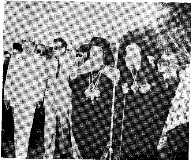
Ἀπὸ τὴν ὑποδοχὴν τοῦ Σεβ. κ. Νεκταρίου εἰς Κάλυμνον.

Τὴν Παρασκευὴν 17ην Ἰουνίου μετέβη εἰς Κωνσταντινούπολιν, ὅπου αὐθημερὸν ἐτελέσθη ἐνώπιον τῆς Α. Θ. Παναγιότητος τὸ Μικρὸν Μήνυμα, ἐν δὲ τῷ πανσέπτῳ πατριαρχικῷ Ναῷ τοῦ Ἁγίου Γεωργίου τὸ Μέγα Μήνυμα. Κατὰ τὸ μικρὸν Μήνυμα ἡ Α. Θ. Παναγιότης προσφωνῶν τὸν Σεβ. κ. Νεκτάριον εἶπεν καὶ τὰ ἑξῆς: «... Ἡ Ἐκκλησία ἔχουσα ὑπ' ὄψει τὴν πολυσχιδῆ δράσιν, ἣν ἐντὸς βραχείας χρονικοῦ διαστήματος ἀνέπτυξεν ἡ ὑμετέρα Ἱερότης ἐν τῇ προηγουμένη αὐτῆς Μητροπόλει: Καρπάθου καὶ Κάσου καὶ ἐκτιμήσασα τὸν ποιμαντορικὸν ζήλον καὶ τὰς οργανωτικὰς αὐτῆς ἰκανότητας, διὰ τῆς προσφάτου προαγωγῆς αὐτῆς ἠθέλησεν ὅπως δώσῃ αὐτῇ μείζονας εὐκαιρίας καὶ εὐρύτερον ἔδαφος ἵνα ἀναπτύξῃ καὶ πολλαπλασιάσῃ αὐτὴ τὰ ἤδη πολλαπλᾶ τάλαντα αὐτῆς καὶ θέσῃ ταῦτα εἰς τὴν διάθεσιν τοῦ φιλοχριστοῦ λαοῦ...». Εἰς τοὺς λόγους τούτους τῆς Α. Θ. Παναγιότητος ἀπήντησεν λίαν συγκεκινημένος ὁ Σεβ. Μητροπολίτης κ. Νεκτάριος καταλήξας ὡς ἑξῆς: «... Ἐφ' ὅσον ζῶ καὶ ἀναπνέω καὶ ὑπάρχω, θά ὑμῶν καὶ δοξάζω τὸν Κύριον καὶ Δεσπότην καὶ Θεόν μου καὶ τὸν εἰς τὸν Αὐτοῦ τόπον καθήμενον Ἡγούμενον τῆς ὑπ' οὐρανὸν Ὁρθοδοξίας, τὸν προσκυνητὸν ἡμῶν Αἰθέτην καὶ Δεσπότην, τὸν Οἰκουμενικὸν Πατριάρχην, θά ἀγαπῶ καὶ τιμῶ καιρμένη καρδίᾳ καὶ ἐρωτικῇ τοῦ πνεύματος διαθέσει, τὸ Πάνσεπτον καὶ Ἱερόν Φανάριον καὶ ὅτι τοῦτο ἐκφράζει: ἐν τῇ πανορθοδόξῳ ἐκκλησιαστικῇ συνειδήσει: καὶ θά διακονῶ καὶ κηρύττω τὰ ὑψηλὰ καὶ εὐθυνοφώρα μηνύματα καὶ τὴν μυστικὴν κενωτικὴν δόξαν, ἣν ἐψηλάφησα καὶ ἐθεασάμην ἐν τῇ ἀγίᾳ καὶ εὐλογημένῃ πόλει: τῆς Κωνσταντινουπόλεως...».