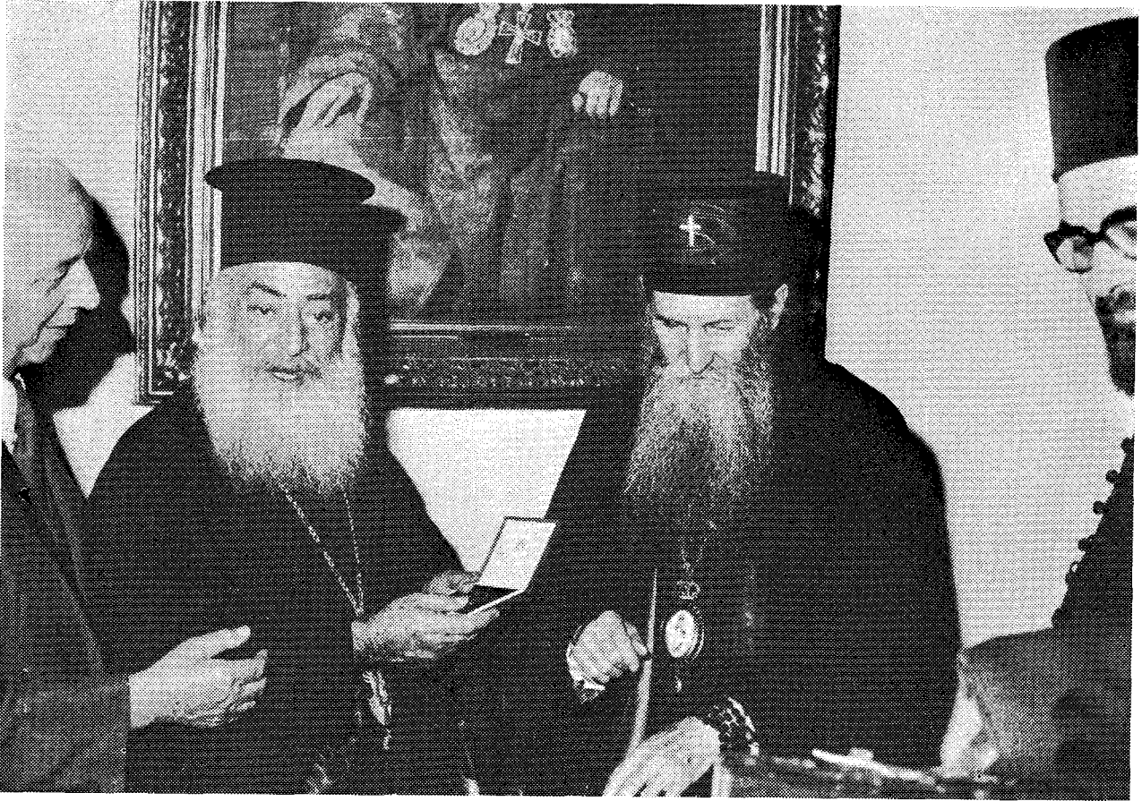
Άπό τήν άπονομή στον Μακ. Άρχιεπίσκοπο κ. Σεραφείμ τοῦ χρυσοῦ μεταλλίου τῆς 25ετηρίδας ἀπό τήν ἀνάρρηση στον Πατριαρχικό Θρόνο τῆς Σερβίας τοῦ Μακ. κ. Γερμανοῦ.

τόν Προκαθήμενο τῆς Ἑλληνικῆς Ὁρθόδοξης Ἐκκλησίας Ἀρχιεπίσκοπο κ. Σεραφείμ.