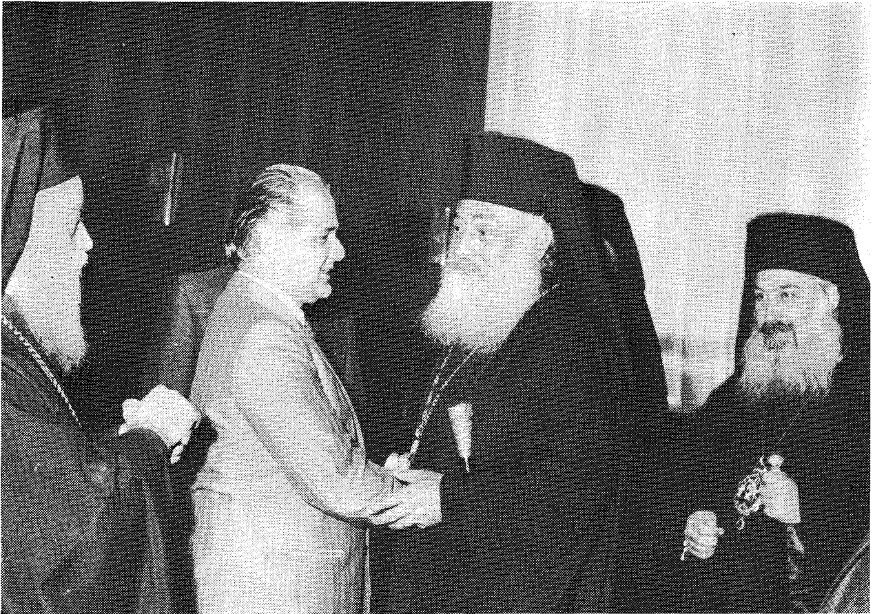
Άπό τή συνάντηση τοῦ Μκκ. Ἀρχιεπισκόπου κ. Σεραφεῖμ μετὸν Ἀντιπρόεδρο τῆς Γιουγκοσλαβικῆς Κυβερνήσεως Δρα Σόκκοβιτς. Ἐκατέρωθεν οἱ Σεβ. Κίτρους καὶ Ν. Κρήνης.

ἀπαλλάξας αὐτὴν ἀπὸ τοὺς ἀπεινεῖς διώκτας τῆς τῆς ἐποχῆς ἐκείνης, ὡς εἶπον καὶ εἰς τὸν Ἱερὸν Ναὸν, ἡ Ἐκκλησία ἦτο ἐκείνη ἡ ὁποία ἀνέλαβε τὸν πρωτεύοντα ρόλον νὰ ἀγωνισθῆ διὰ νὰ ἀποτινάξῃ τὸν τουρκικὸν ζυγὸν καὶ νὰ φέρῃ τὴν ἐλευθερίαν καὶ εἰς τὸ Σερβικὸν καὶ εἰς τὸ Ἑλληνικὸν Ἔθνος. Ἡ Ἐκκλησία, ἡ ταμειοῦχος αὐτῆ τῆς Ἀληθείας, ἡ ὁποία Ἀλήθεια λέγεται καὶ διδάσκειται καὶ καθιστᾷ τὸν Ἄνθρωπον ἐλεύθερον.