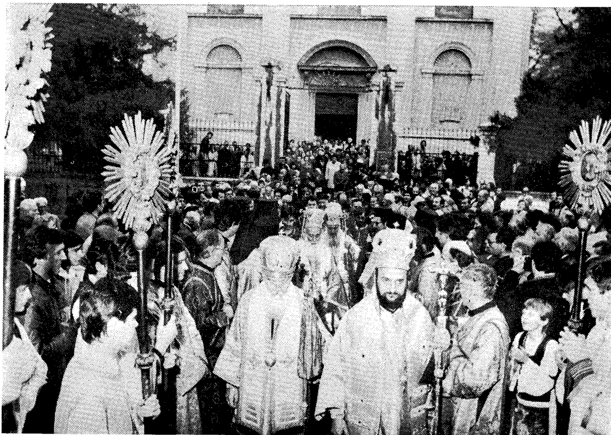
Μετά τὸ ἀρχιερατικὸ συλλειτουργοῦ στὸν Καθεδρικό Ναὸ τοῦ Βελιγραδίου. Ἐν πομπῇ οἱ δύο Προκαθήμενοι μαζί με τὰ μέλη τῶν συνοδιῶν τους κατευθύνονται πρὸς τὸ ἀπέναντι μέγαρο τοῦ Πατριαρχείου.