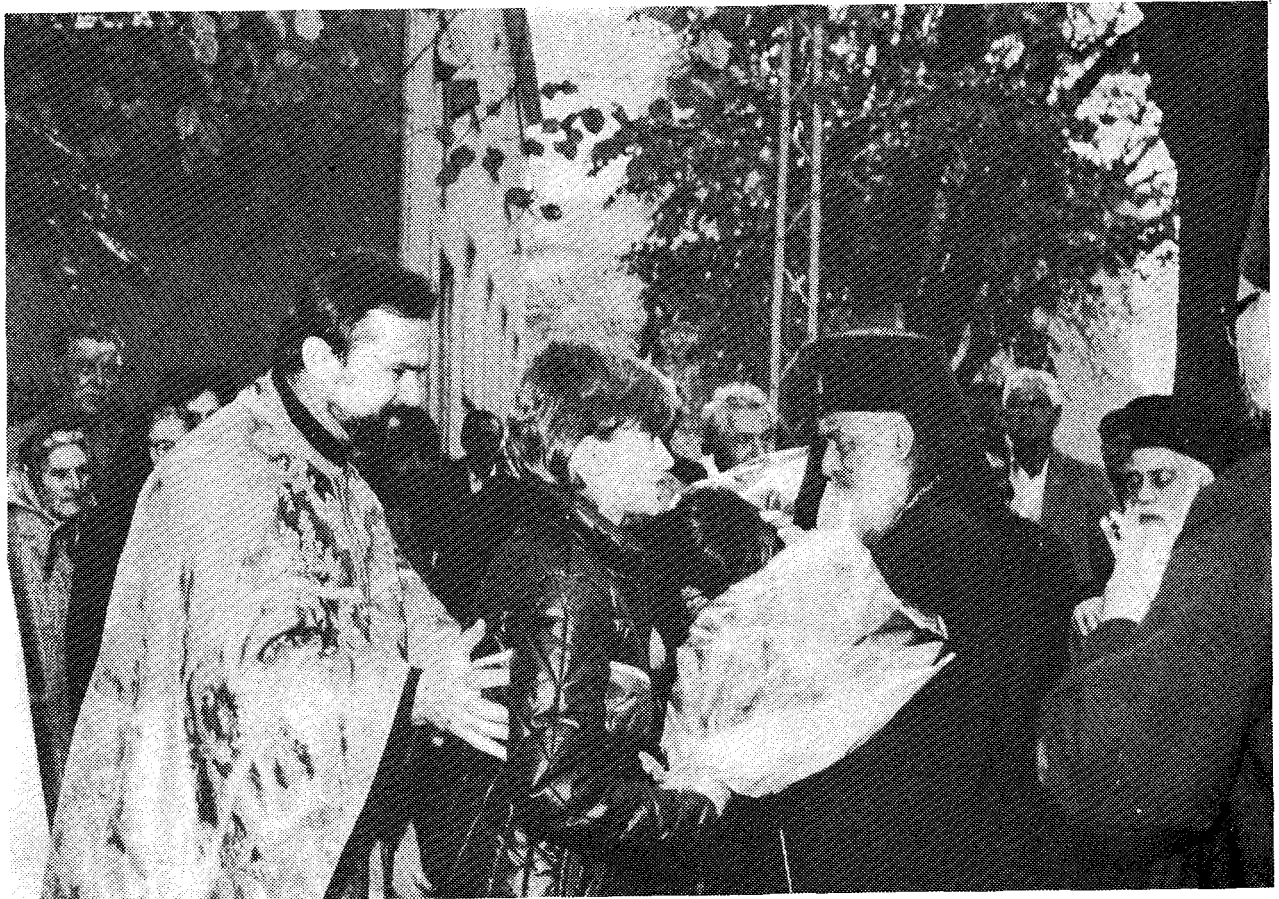
Παντοῦ ὁ πιστὸς ὀρθόδοξος σερβικὸς λαὸς ἐπαφύλαξε στὸν Μακ. Ἀρχιεπίσκοπο Ἀθηνῶν κ. Σεραφεῖμ καὶ τὰ μέλη τῆς συνοδίας του ἐγκάρδια ὑποδοχή. Ἄνω: Νεάνιδα τοῦ προσφέρει ἄνθη.

σκέφους τῆς Ὑμετέρας Μακαριότητος καὶ τῆς Αὐτοῦ Ἁγιότητος τοῦ Πατριάρχου τῶν Σέρβων. Ἡ ὑψηλὴ αὐτῆ ἐπίσκεψις ἀποτελεῖ ἐξαιρετικὸν γεγονός καὶ θὰ μείνῃ εἰς αἰωνίαν ἀνάμνησιν εἰς τὰ χρονικά τῆς παλαιᾶς αὐτῆς ἐπαρχίας. Χαιρόμεθα ὅλοι ἡμεῖς καὶ κανχώμεθα καὶ εἴμεθα εὐγνώμονες βαθέως πρὸς τὸν Θεόν, διότι εἶχομεν τὴν εὐκαιρίαν εἰς τὴν ἀνθοδέσμη τῶν καλῶν καὶ τῶν ἱερῶν δεσμῶν μεταξὺ τοῦ ἰδικοῦ μας καὶ τοῦ ἑλληνικοῦ λαοῦ, τῆς ἡμετέρας καὶ τῆς Ἁγίας Ἐκκλησίας τῆς Ἑλλάδος νὰ προσθέσωμεν ἓν μικρὸν ἄνθος, τὸ ὁποῖον ἄνθος εἰς τὴν ἀνθοδέσμη αὐτὴν, ποὺ ἔχει ὠραιότατα χρώματα καὶ θαυμαστὸν ἄρωμα, θὰ τὴν κάνει ἀκόμη πιὸ ὁμορφὴ καὶ μυρωδάτη. Οἱ δεσμοὶ μας εἶναι ἱεροί, διότι ὁ ἰδικός μας ὁ Ἅγιος Σάββας ἔθεσε τοὺς δεσμοὺς αὐτοὺς ἐπὶ τῶν ἱερῶν θεμελιῶν καὶ τῶν αἰωνίων ἀρχῶν τοῦ Ἐδαγγελίου καὶ εἰς τὰ κοινὰ ιδεώδη τῆς Πίστεώς μας καὶ τῆς Ἐκκλησίας μας. Εἶναι ἡγιασμένοι μὲ τὴν χάριν τοῦ Ἁγίου Πνεύματος. Πολὺ χαιρόμεθα διότι οἱ καλοὶ αὐτοὶ δεσμοὶ καὶ σήμερον ζοῦν καὶ ἀμοιβαίως ἐμβαθύνονται τόσον ἐκ μέρους τῶν δύο Ἁγίων Ἐκκλησιῶν μας ὅσον καὶ ἐκ μέρους τῶν κρατῶν μας. Ἐν τῇ πνευματικῇ αὐτῇ κοινωνίᾳ καὶ ἐνότητι ἐν Χριστῷ, πλὴν τῶν προαναφερθέντων συντελεστῶν πολὺ συμβάλλουν καὶ οἱ τάφοι