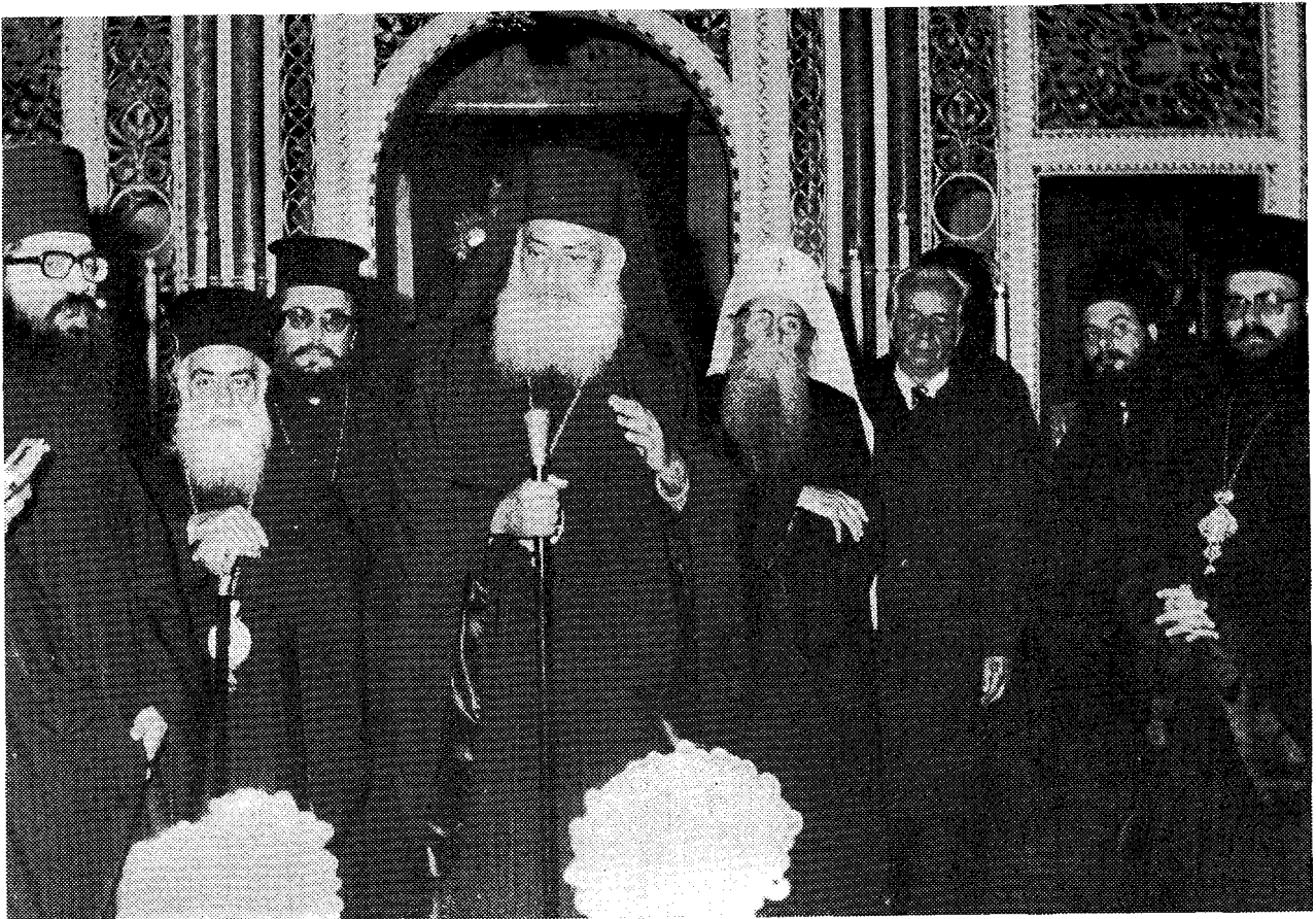
Ὁ Μακ. Ἀρχιεπίσκοπος κ. Σεραφεῖμ ἀπευθίνει νουθεσίες πρὸς μοναχούς. Δίπλα του ὁ Μακ. Πατριάρχης κ. Γερμανός, ὁ Σεβ. Κίτρος κ. Βαρνάβας καὶ ἄλλα μέλη τῶν δύο συνοδιῶν.

«Ὁ Πρόεδρος τῆς Ἐθνοσυνελεύσεως τῆς Σ.Δ. Σερβίας κ. Branko Pesic δέχθηκε τὸν Πατριάρχη τῆς Σερβικῆς Ὁρθόδοξης Ἐκκλησίας κ. Γερμανὸ καὶ