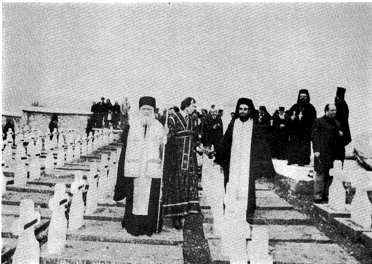
Μετά τὸ μνημόσυνο στὸ Πιρότ, ὁ Μακ. Ἀρχιεπίσκοπος ἔβρανε μὲ ἄνθη τοὺς τάφους τῶν Ἑλλήνων στρατιωτῶν, ποὺ ἔπεσαν ἐκεῖ τὸ 1918. Μεταξὺ τους κι ἕνας στρατιωτικὸς ἱερέας.

τῶν πεσόντων εἰς τὸν κοινὸν ἀγῶνα τῆς πίστεώς μας. Οἱ τάφοι τοῦ Πιρότ, Μακαριώτατε, εἰς τοὺς ὁποίους σήμερον ἐτελέσατε τὸ μνημόσυνον καὶ οἱ τάφοι τῶν ἰδικῶν μας ἡρώων εἰς τὸ Ζεϊτινλίκ, εἰς τὴν Κέοκχορ, εἰς τὴν νῆσον Βίδο καὶ εἰς ἄλλα μέρη εἶναι ζωντανὰ πηγαὶ ἐμπνεύσεως τῆς ἀδιασπάστου ἀδελφότητος τῶν λαῶν μας καὶ τῶν Ἐκκλησιῶν μας.