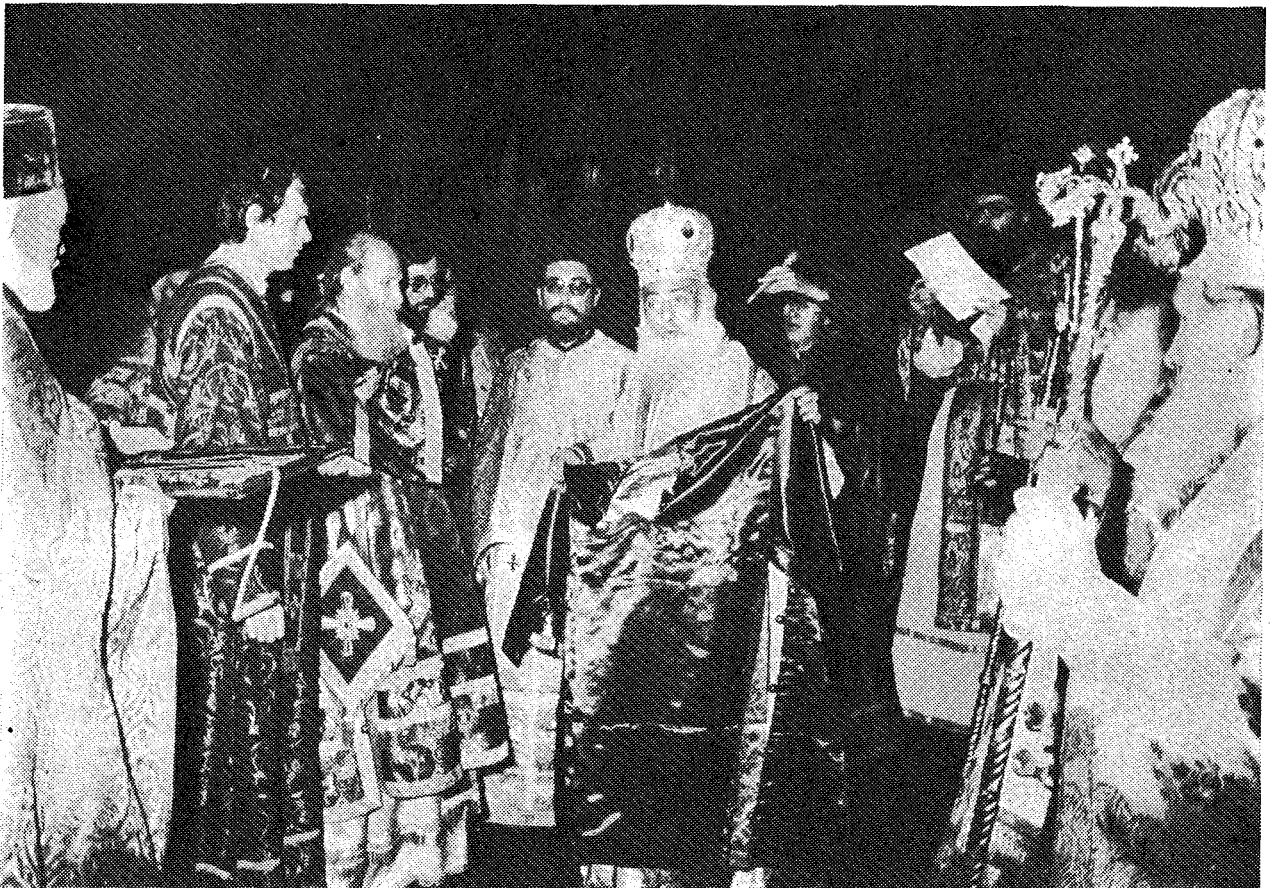
Ὁ Μακ. Ἀρχιεπίσκοπος κ. Σεραφεῖμ ἐτοιμάζεται νὰ ντύσῃ τὸν Μακ. Πατριάρχην κ. Γερμανὸν μετ' ὁ σακκοῦ τῆς ἀρχιερατικῆς στολῆς, τὴν ὁποία τοῦ προσέφερε κατὰ τὴν Θ. Λειτουργίαν.

Τὸ πρῶτον ταξίδιον τὸ ἔκαναν οἱ Θεσσαλονικεῖς ἀδελφοὶ Κύριλλος καὶ Μεθόδιος μετ' ὁ σκοπὸν καὶ πρόθεσιν τὰς γνώσεις τὰς ἰδικὰς των νὰ μεταφέρουν εἰς τὸν λαὸν τῆς κεντρικῆς Ἑυρώπης καὶ τῆς Βορείου Βαλκανικῆς, δηλαδὴ εἰς τὰς περιοχὰς ὅπου ἔζον Σέρβοι. Τὸ δεύτερον ταξίδιον γεωγραφικῶς ἀντιθέτον κατευθύνσεως ἀπὸ τὸ πρῶτον, ὑπῆρξε τὸ ταξίδιον τοῦ νεαροῦ πρίγκηπος Ράστκο Νέμενιτς ἐκ Βορρᾶ πρὸς Νότον, τοῦτέστιν ἐκ τῆς Σερβίας πρὸς τὸ Ἅγιον Ὄρος τοῦ Ἄθω μετ' ὁ σκοπὸν νὰ ἀποκτήσῃ τὰς γνώσεις ἐκεῖνας, αἱ ὁποῖαι πλούσιαι ὑπῆρξαν τότε εἰς τὸ Ἅγιον Ὄρος, δηλ. τὰς εἶχον οἱ ἐκεῖ ἀσκούμενοι μοναχοί. Ἀμφότερα τὰ ταξίδια ὑπῆρξαν παρὰ Θεοῦ ἠὲλογημένα καὶ ἐπέτυχαν πλήρως. Ἀμφό-