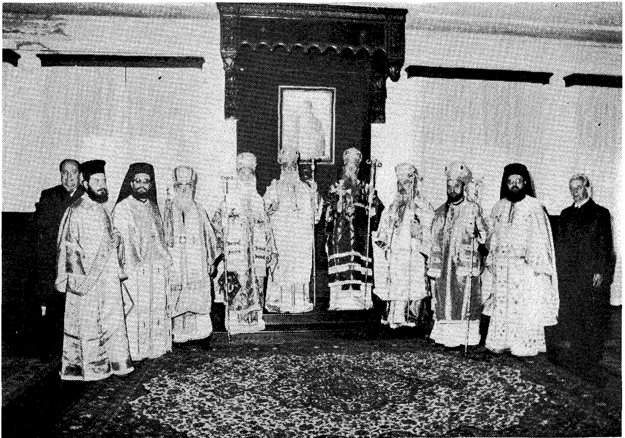
Άναμνηστική φωτογραφία των δύο Προκαθήμενων με τα μέλη των δύο αντιπροσωπειών στην αίθουσα του Θρόνου των Πατριαρχείων μετά τη Θεία Λειτουργία της 30ής Οκτωβρίου.

Δίπλα στο Έλληνικό Νεκροταφείο του Πιρότ βρίσκεται κενότάφιο για τους Σέρβους στρατιώτες, που έπεσαν στον ίδιο αγώνα. Άμέσως μετά το μνημόσυνο, οι δυο Προκαθήμενοι κατευθύνθηκαν εκεί με τα μέλη των συνοδιών τους και τέλεσαν τρισάγιο. Ο καιρός εύτυχως ευνόησε όλες τις υπαίθριες εκδηλώσεις. Από το Πιρότ οι δυο συνοδίες μαζί με τον Πανιερ. κ. Ειρηναίο μετέβησαν και ξεναγήθηκαν στο μνημείο τής θηριωδίας των Τούρκων στη Νίσα, όπου έχτισαν στα 1809 τα κεφάλια των Σέρβων που