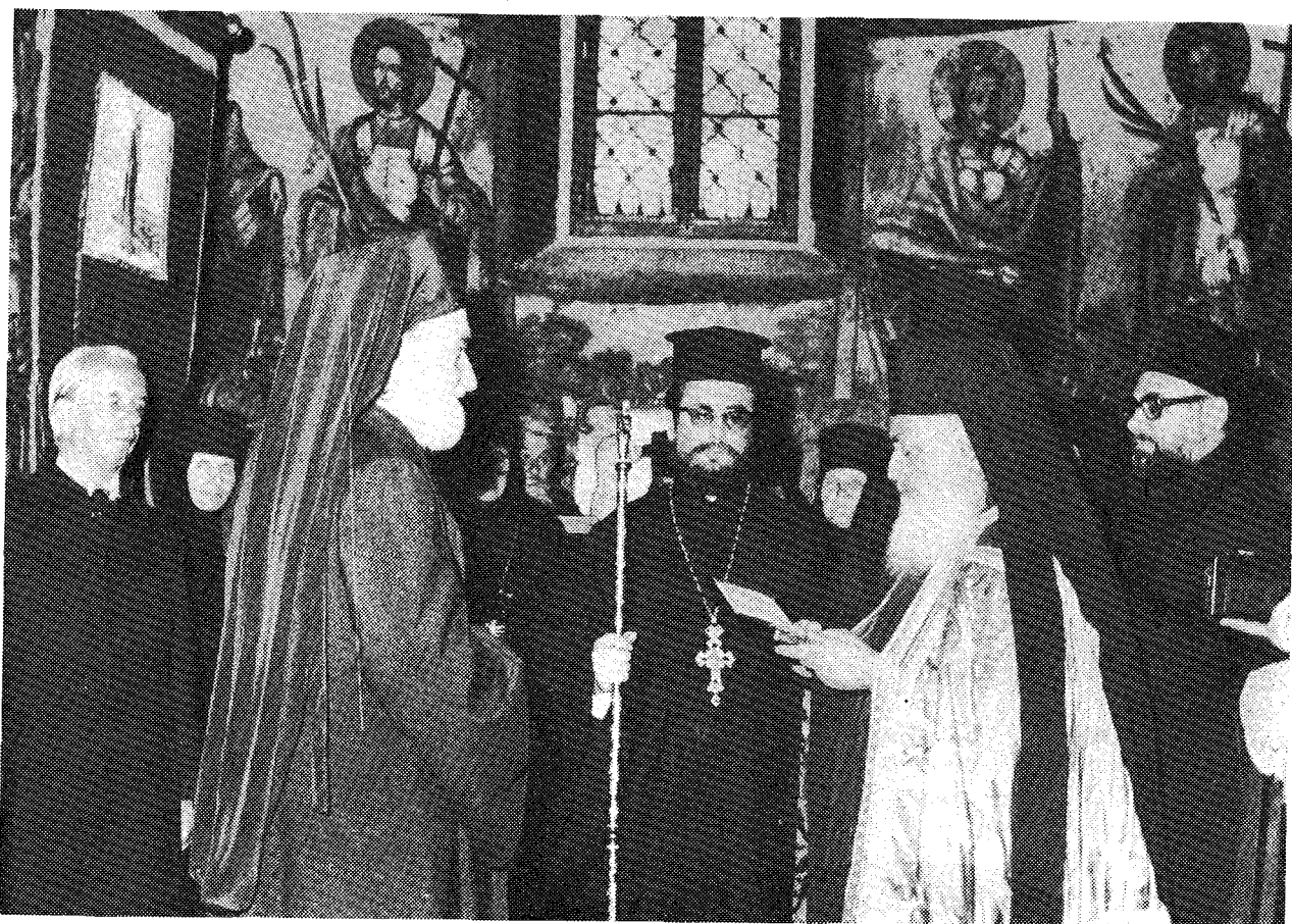
Ο Μακ. Αρχιεπίσκοπος κ. Σεραφείμ προσφέρει στον Πάνιερ. Έπίσκοπο Σέρμ κ. Ανδρέα εγκόλπιο σε ανάμνηση της επίσκεψής του στην Ι. Μ. Κρουσέντολ. Στο κέντρο ο Αρχιεπίσκοπος π. Τιμόθεος.

μοναχῶν καὶ εὐρίσκει τὸν δεύτερον ἀνώτερον τοῦ πρώτου.