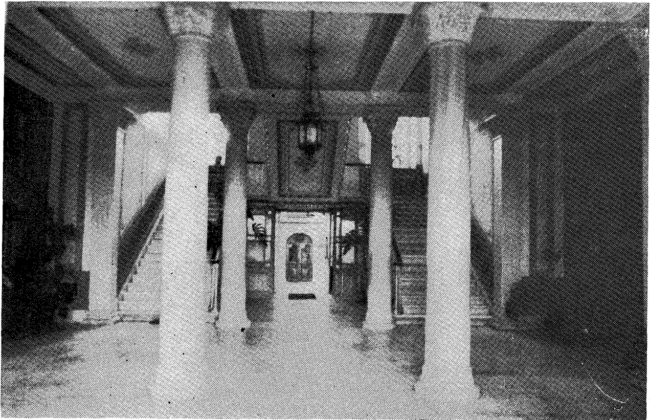
Ὁ χώρος ὁ ἐνῶνων τοὺς δύο διαδρόμους ὅπου ἔνθεν καὶ ἔνθεν αἱ αἰθούσαι τῶν παραδόσεων καὶ τὰ σπουδαστήρια.

290. Ἰδιαιτέρως πρέπει νὰ τονισθῇ ἐνταῦθα ἡ προσφορὰ τῶν Καθηγητῶν εἰς τὸ θεῖον κήρυγμα κατὰ τὰς Κυριακὰς καὶ λοιπὰς ἑορτάς τοῦ ἔτους, τόσοσ εἰς τοὺς ἱ. Ναοὺς τῆς Ἱερᾶς Ἀρχιεπισκοπῆς Κων/λεως ὅσον καὶ εἰς τοὺς Ναοὺς τῶν πέριξ Μητροπόλεων. Οὐχὶ μόνον διὰ τοῦ θεῖου κηρύγματος ἀλλὰ καὶ διὰ διαφόρων ἄλλων ἐπικαίρων ὁμιλιῶν, γενομένων εἰς τὰς διαφόρους αἰθούσας τῶν Κοινοτήτων καὶ τῶν διαφόρων Συλλόγων, βοηθοῦν τὴν Ἐκκλησίαν εἰς τὴν ἐπιτυχίαν τοῦ πνευματικοῦ καὶ ἐν γένει τοῦ ποιμαντικοῦ αὐτῆς ἔργου.