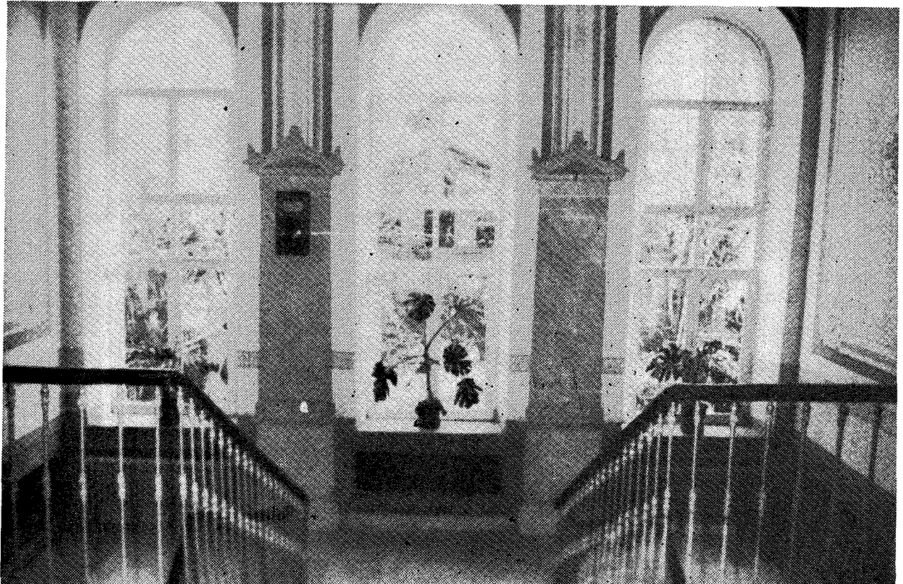
Ἡ μαρμαρινὴ κλιμαξὴ ἡ ὀδηγοῦσα πρὸς τὸν ἄνω ὄροφον ἐνθα τὰ γραφεῖα τοῦ Σχολάρχου, ἡ Γραμματεία, τὸ Συνοδικόν, τὰ δωμάτια τῶν Καθηγητῶν καὶ τὰ πατριαρχικά δώματα.

γικοί καὶ γόνιμοι διδάσκαλοι τῆς Ὀρθοδόξου Θεολογίας, θεσπέσιοι ἐρμηνευταὶ τοῦ Εὐαγγελίου, ἱεροφάνται τῆς ἐπιστήμης, πνευματοφόροι προσωπικότητες καὶ ἐμπνευσμένοι εἰσηγηταὶ πολλῶν καθαρῶς ἐπιστημονικῶν εἰσηγήσεων καὶ προτάσεων ἐπὶ ἐπιστημονικῆς ἐρεύνης καὶ ἀντιμετωπίσεως χρηζόντων δυσκολωτάτων θεμάτων τοῦ Οἰκουμενικοῦ Θρόνου, ὀλοκλήρου τῆς Ὀρθοδόξου Ἐκκλησίας καὶ κατ' ἐπέκτασιν ἀπάσης τῆς Χριστιανοσύνης. Αἱ πρὸς τὴν Ἀγίαν καὶ Ἱεράν Σύνοδον τοῦ Οἰκουμενικοῦ Θρόνου ὑποβληθεῖσαι συγκεκριμένα γραπτὰ εἰσηγήσεις τῶν ἢ εἰσηγήσεις ἐν σχεδίῳ ἢ τελειωτικὰ κείμενα δι' ἀποδοχὴν, ἀπόφασιν καὶ κοινοποίησιν ἢ δημοσιευσιν ἀποτελοῦν ἀληθεῖς ὀγκῶδεις πραγματείας, εἰς τὰς ὁποίας ἱστορικῶς, θεολογικῶς, ἐκκλησιολογικῶς καὶ κανονικῶς ἐπισταμένως μελετῶσιν, ἐρευνῶσιν καὶ ἐνδελεχῶς ἀναλύουσι τὸ ὑπὸ τῆς Ἐκκλησίας τιθέμενον εἰς αὐτοὺς θέμα (πρόβλημα). Αἱ εἰσηγήσεις τῶν, λόγῳ τῶν ἀναλυτικῶν καὶ συνθετικῶν δεξιότητων τῆς εἰς βάθος καὶ πλάτος κριτικῆς μεθόδου ἐργασίας, τὴν ὁποίαν ἀκολουθοῦν ἐν τῇ διαπραγματεύσει τοῦ θέματος, εἰς οὐδὲν ἀπολύτως ὑστεροῦν καὶ αὐτῶν ἔτι τῶν καλυτέρων καθαρῶς ἐπιστημονικῶν ἐρευνῶν, τῶν ὑποβαλλομένων εἰς τὰ διάφορα πνευματικὰ καθιδρύματα πρὸς λῆψιν ἐπιστημονικῶν τίτλων. Διὰ τὸν λόγον δὲ τοῦτον τὸ ἔργον τῶν εἶναι ὄντως μεγάλο, ἢ δὲ προσφορὰ τῶν τόσο εἰς τὰ Θεολογικὰ Γράμματα ὅσον καὶ εἰς αὐτὴν ταύτην τὴν Ἐκκλησίαν εἶναι ἀναμ-