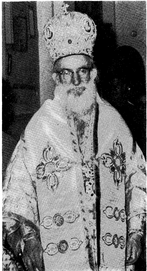
Ὁ ἀοίδιμος Ἱεράρχης τελῶν τὴν θείαν Μυσταγωγίαν.

Τὴν στοιχειώδη καὶ ἐγκύκλιον Παιδείαν ἐπεράτωσεν εἰς τὴν ἰδιαιτέραν του πατρίδα· τὰς δὲ περαιτέρω σπουδὰς του ἀνέστειλε σοβαρὰ ἀσθένεια, ἐκ τῆς ὁποίας ἀπηλλάγη διὰ τῆς θαυματουργικῆς δυνάμεως τοῦ Ἁγίου Γεωργίου εἰς τὴν Μονὴν τοῦ ὁποίου ἀφιερῶθη ἐπὶ ἕν ἔτος, κατό- πιν ὑποσχέσεως τῆς μητρὸς του.