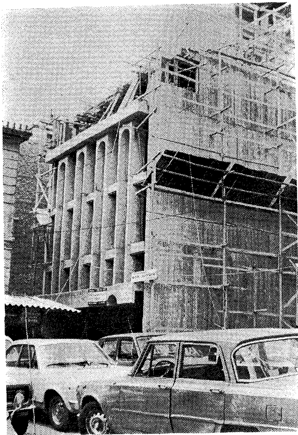
Τὸ Κέντρο στὴ φάση ἀποπερατώσεως τοῦ σκελετοῦ τοῦ κτιρίου.

Συγκεκριμένα τὸ Κ.Δ.Σ. κατὰ τὴ ΛΣΤ' Περίοδο (Μάιος 1981-Άπρίλιος 1982) 5 ἀσχολήθηκε με τὴν πορεία τῶν ἐργασιῶν ἀνεγέρσεως στὶς συνεδρίες 12.6.81 (ἐνέκρινε ὑπερβάσεις τῆς ἀρχικῆς δαπάνης), 11.9.81 (ἐνέκρινε τὴν ὑπογραφή τοῦ συμφωνητικοῦ γιὰ τὴ συνέχιση τῶν ἐργασιῶν ἀποπερατώσεως τοῦ κτιρίου), 14.12.81 (ἐνημερώθηκε γιὰ τὴν πορεία τοῦ ἔργου) καὶ 12.3.82 (ἐνέκρινε τὴ διενέργεια μειοδοτικοῦ διαγωνισμοῦ γιὰ τὴν προμήθεια καὶ ἐγκατάσταση τῶν μηχανημάτων κλιματισμοῦ).