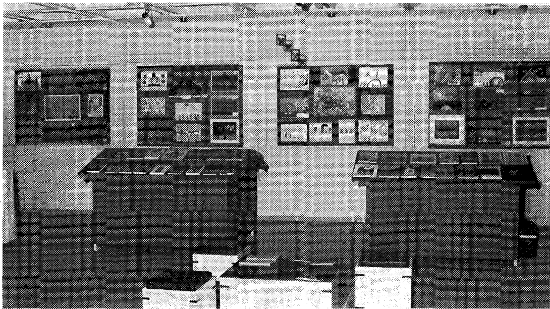
Έκθεση παιδικού βιβλίου στον 1' όροφο του Κέντρου.

Παρ' όλα αυτά, Μακαριώτατε, υπάρχουν και σήμερα κληρικοί και μοναχοί καλλιτέχνες, που — παράλληλα με τα ποιμαντικά και άλλα καθήκοντά τους—, βρίσκουν τον καιρό να άσχοληθούν και με την καλλιτεχνική δημιουργία. Κι αυτό, για να αξιοποιήσουν το καλλιτεχνικό δώρο του Θεού. Για να προσ-