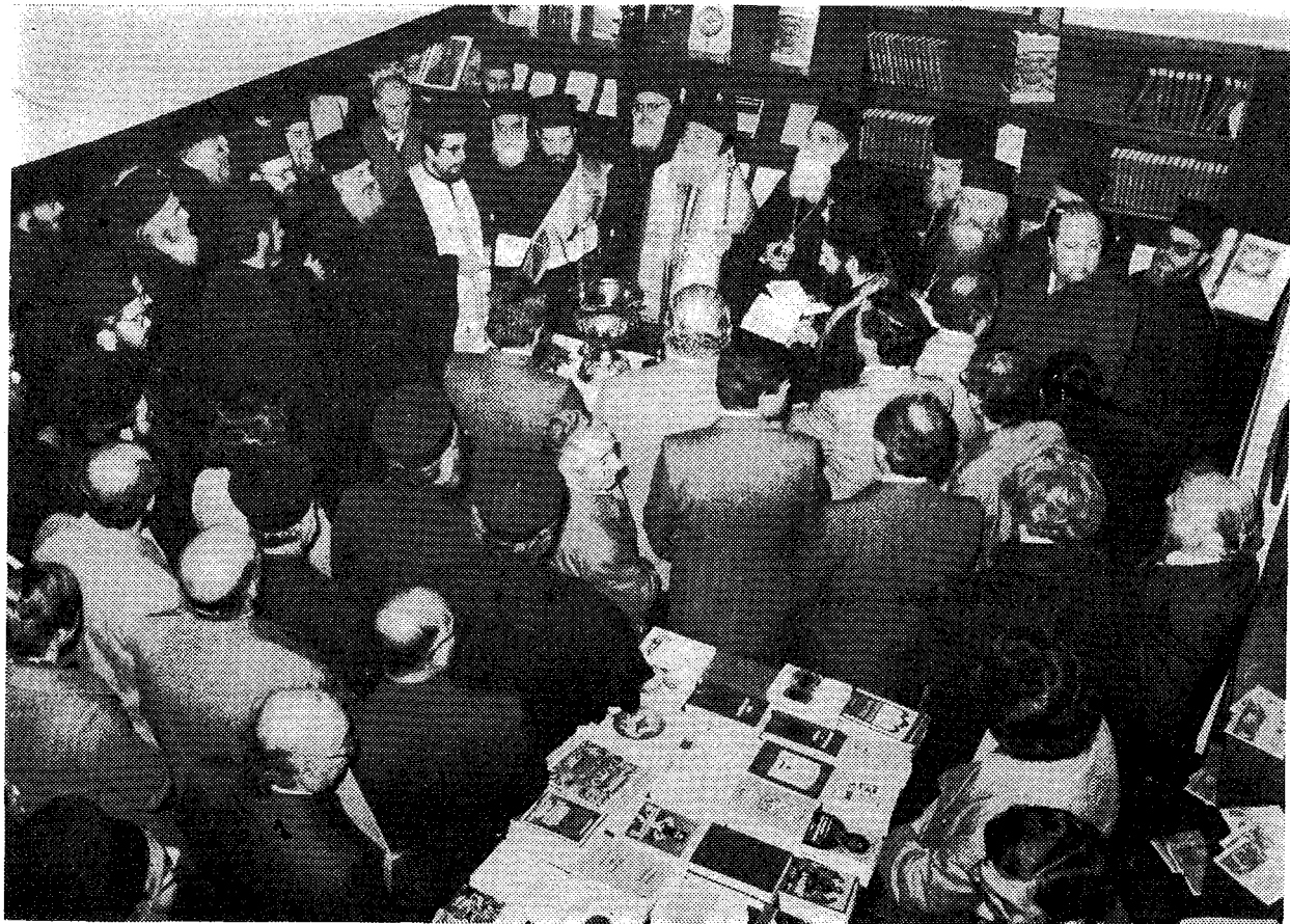
Η τελετή εγκαινιασμού του Κέντρου Βιβλίου και Έπικοινωνίας από τον Μακαριώτατο (14.12.1983).

Το κτίριο έχει συνολικό όγκο 2.300 κυβ. μέτρα και έμβαδόν 650 τ.μ. Το ισόγειο θα χρησιμοποιηθεί ως βιβλιοπωλείο: στους όρόφους πρώτο και δεύτερο θα γίνονται εκθέσεις ορθόδοξου έντύπου με έμφαση κάθε φορά σ' ένα θέμα. Έτσι, σήμερα αρχίζουμε με