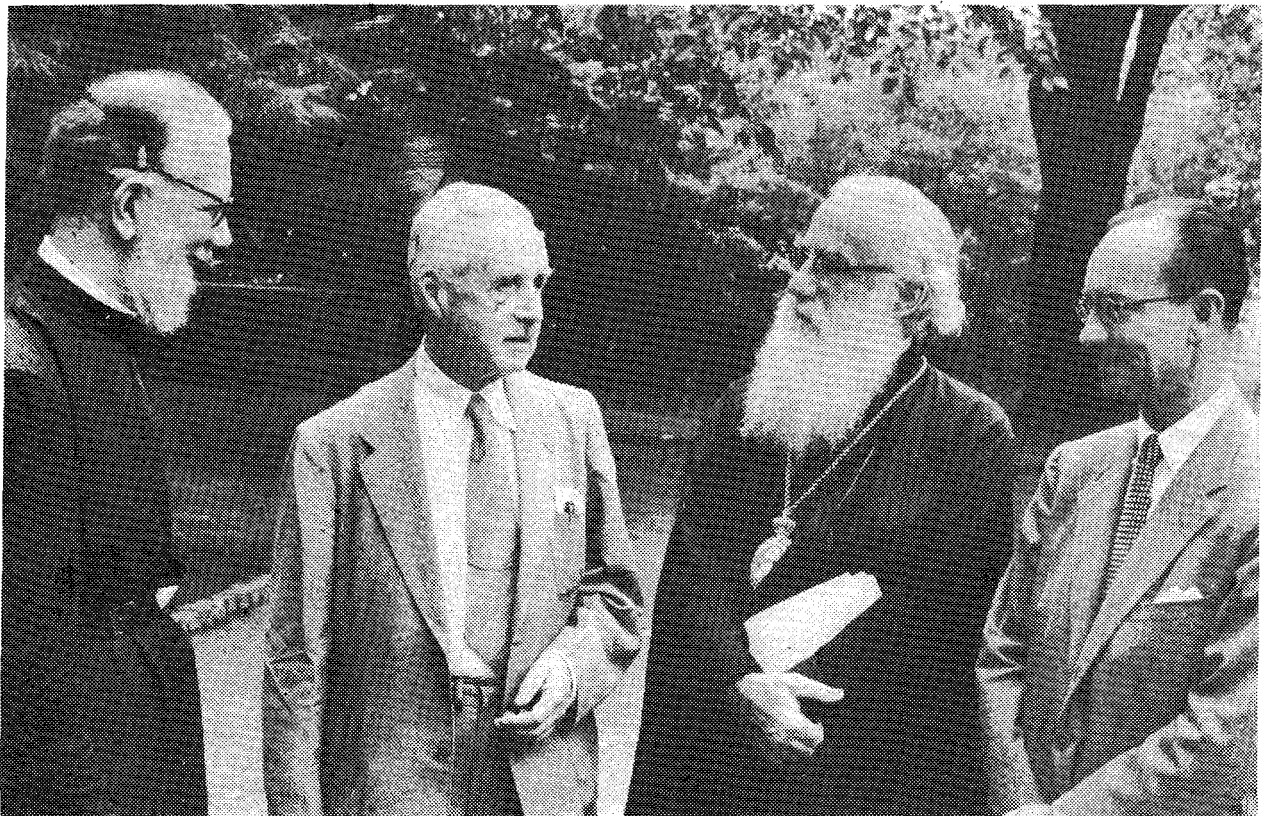
Ὁ μακαριστὸς Ἀρχιεπίσκοπος Ἀμερικῆς Μιχαήλ μετὰ τοῦ διασήμου ρώσου θεολόγου πρωτοπρεσβυτέρου Γεωργίου Φλωρόφσκυ († 1979), τοῦ σκότου καθηγητοῦ John Baille καὶ ἐνὸς ἄλλου ἄξιωματοῦχοῦ τοῦ Π. Σ. Ε., κατὰ τὸ συνέδριον τῆς Κεντρικῆς Ἐπιτροπῆς τοῦ Π. Σ. Ε., ἐν New Haven, τῶν Η. Π. Α., (30 Ἰουλίου - 7 Αὐγούστου 1957).