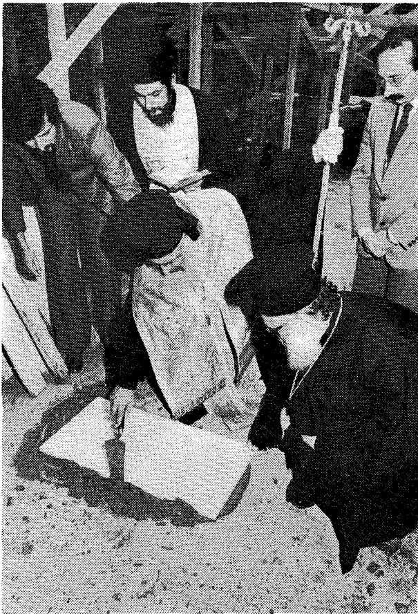
Ὁ Μακ. Ἀρχιεπίσκοπος Ἀθηνῶν κ. Σεραφεὶμ καταθέτει τὸν θεμέλιον λίθον τοῦ Κέντρου (22.2.1981).

»Τὸ κτίριο, τὸ ὁποῖο σὲ λίγο θὰ θεμελιωθῆ, πρόκειται νὰ στεγάσῃ τὸ «Κέντρο Βιβλίου καὶ Ἐπικοινωνίας» τῆς Α.Δ. τῆς Ἐκκλησίας τῆς Ἑλλάδος. Ἡ προοπτικὴ του εἶναι νὰ λειτουργήσῃ μέσα στὴς εὐρύτερες ἱεραποστολικὲς καὶ μορφωτικὲς δραστηριότητες τῆς Α.Δ., σὰν ἄξων συγκεντρώσεως καὶ δια-