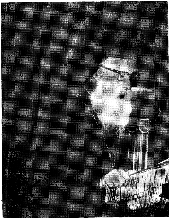
Ό Σεβ. Σισανίου και Σιατίστης κ. Αντώνιος κηρύσσει τόν θεϊον λόγον.

Στή συνοδική Θεία Λειτουργία χοροστάτησε έφέτος ό Σεβ. Μητροπολίτης Τριφυλίας και Όλυμπίας κ. Στέφανος, πλαισιούμενος από τους πανοσ. άρχιμ. Χρυσ.