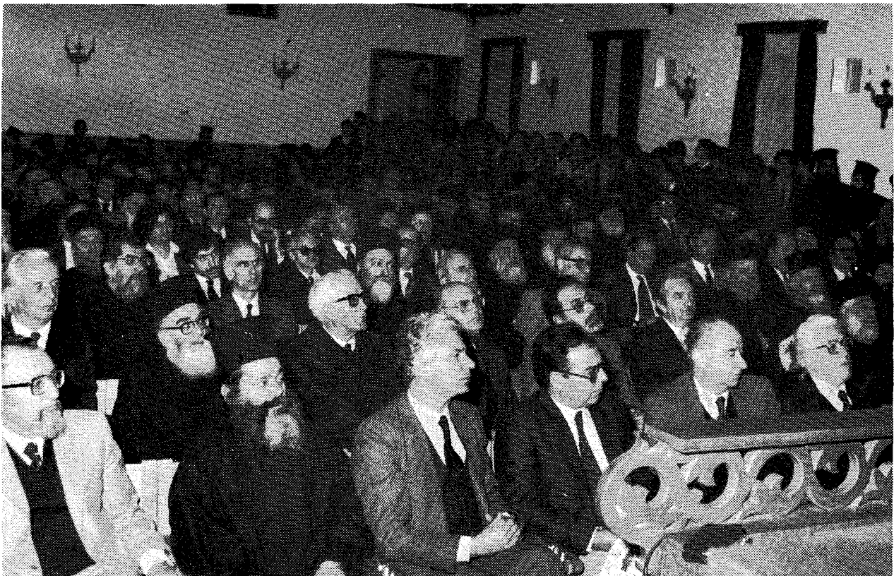
Ένα τμήμα του άκροατηρίου εις την μεγάλην αίθουσαν του Διορθοδόξου Κέντρου, ενώ παρακολουθεί την εισήγηση.