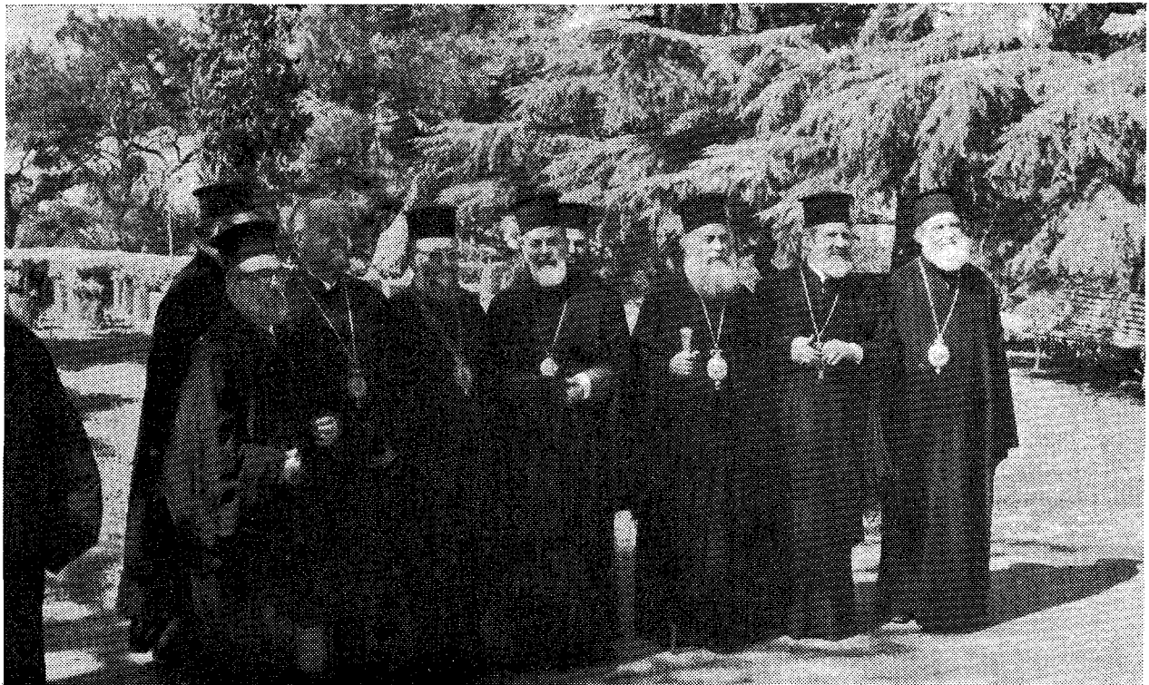
Ἀπὸ τὴν ἐπίσκεψιν τοῦ προκαθημένου τῆς Ἐκκλησίας τῆς Ἑλλάδος Μακαριωτάτου Ἀρχιεπισκόπου Ἀθηνῶν καὶ Πάσης Ἑλλάδος κ. κ. Σεραφεῖμ εἰς τὴν Πατριαρχικὴν Θεολογικὴν Σχολὴν τῆς Χάλκης.

307. Διὰ τὴν ἀνεκτίμητον φιλοσοφικὴν προσφορὰν τοῦ Χρ. Ἀνδρούτσου εἰς τὴν Φιλοσοφίαν, καὶ δὴ εἰς τὴν πλατωνικὴν τοιαύτην ἰδὲ Κ. Δ. ΓΕΩΡΓΙΟΥΑΝ, Χρῆστος Ἀνδρούτσος, «Ἡλιος, Νεώτερον Ἐγκυκλοπαιδικὸν Λεξικόν, II, 795-798.