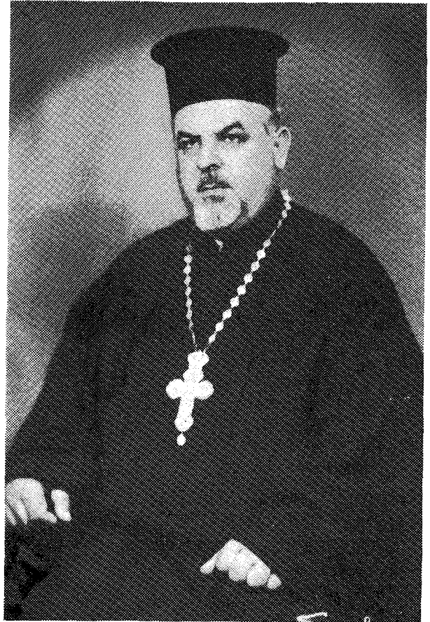
Γεώργιος Ἀναστασιάδης, Μέγας Οἰκονόμος.

Εἰς τὸ πρόσωπον, τὸ πνεῦμα, τὴν ψυχὴν και τὴν καρδίαν τοῦ αἰοδίμου πατρὸς Γεωργίου Ἀναστασιάδης ἠσθάνθημεν και ἐβίωσαμεν κατὰ τρόπον πολὺ ἔντονον ἅπαντες ἀνεξαιρέτως ἡμεῖς οἱ μαθηταὶ του τὸ ὕψος και τὸ βάθος και γενικώτερον ὅλον τὸ μεγαλεῖον τῆς βιβλικῆς ἰωαννείου ἐκφράσεως «παιδί μου», «παιδιά μου». Ἡ πρῶτος και βιβλικὴ μορφή του, ὁ σοφὸς του λόγος, οἱ ἐνθουσιασμοὶ και αἱ παραινέσεις, οἱ ἔπαινοι και αἱ σπάνια, ἀλλὰ πάντοτε ἄνευ ὀργῆς και θυμοῦ, ἐπιπλήξεις του δὲν ἦσαν τίποτε ἄλλο εἰ μὴ καθαρὰ ἀποστάγματα τῆς ὄντως μεγάλης και ἀνυποκρίτου πρὸς ὅλους ἡμᾶς πατρικῆς του ἀγάπης και θαλπωρῆς. Ὁ πατήρ Γεώργιος Ἀναστασιάδης εἶχε τὸν ἰδικὸν του τρόπον και τὴν ἰδικὴν του μέθοδον διὰ