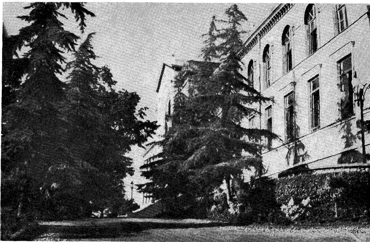
Μερική όψη τῆς δυτικῆς πλευρᾶς τοῦ κτιρίου τῆς Σχολῆς μετὰ τοῦ κήπου αὐτῆς.

κυριαρχεῖ ἡ γονιμότητα τῆς σκέψεως καὶ κρίσεώς του, ὡς καὶ ἡ ψυχικὴ του εὐφορία, ἡ ὁποία ἐκφράζεται διὰ μιᾶς θερμῆς καὶ ρεούσης ποιητικῆς γλώσσης ὡς καὶ δι' ἐνὸς ὑψίστου λυρισμοῦ, ὁ ὁποῖος διακρίνει τὰς ἐπισημονικὰς αὐτοῦ μελέτας, τὰς ἀναφερομένας κυρίως (α) εἰς τὴν αἰσθητικὴν θεώρησιν τῆς ἀρχιτεκτονικῆς, (β) εἰς τὸ φαινόμενον τῆς τέχνης ὡς φιλοσοφίας τῆς τέχνης καὶ αἰσθητικῆς, καὶ (γ) εἰς τὴν χριστιανικὴν τέχνην 328 .