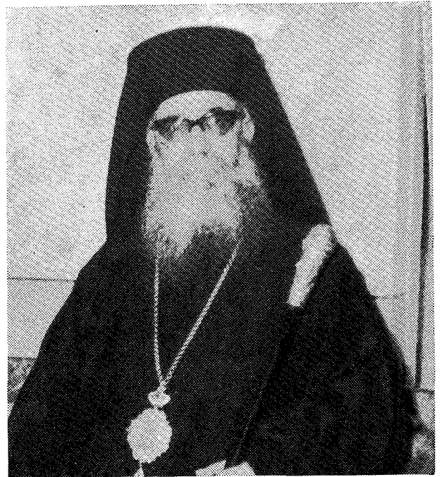
Ὁ ἀοιδίμος Μητροπολίτης Μηθύμνης Ἰάκωβος.

Συνηθίζεται σὲ στιγμὲς ὅπως αὐτὴ ἐδῶ νὰ ἀναπολοῦν οἱ ὀμιληταὶ τὴ ζωὴ καὶ τὴ δράση τοῦ ἐκλιπόντος. Ὅμως ἐγὼ δὲν θὰ ἐπιχειρήσω κάτι τέτοιο. Γιατὶ ὅλοι ἐσεῖς, ποὺ περιβάλλετε μὲ σεβασμὸ τὸ σκῆνωμα τοῦ ἀειμνήστου Ἱεράρχου, γνωρίζετε, ἴσως καλύτερα ἀπὸ τὸν ὀμιλοῦντα, κάθε σταθμὸ τῆς ζωῆς του, κάθε πτυχὴ τῆς θεοφιλοῦς καὶ γονίμου διακονίας του στὸν Ἀμπελιῶνα τοῦ Χριστοῦ, ἀφοῦ ὑπῆρξε σάρκα ἀπὸ τὴ σάρκα σας, γέννημα καὶ ἀνάθρεμμα τοῦ γησιοῦ σας, καὶ ἀφοῦ ἀπὸ τὰ πενήντα χρόνια τῆς ἐκκλησιαστικῆς δράσεως καὶ προσφορᾶς του τὰ τριάντα ἦταν χρόνια ἱεραποστολικοῦ καὶ ποιμαντικοῦ μόχθου στὶς δύο Μητροπολιτικὲς περιφέρειες τῆς Λέσβου καὶ ἀπὸ αὐτὰ τὰ εἴκοσι στὴν Ἐπαρχία Μηθύμνης, ἔπου ἡ Ἐκκλησία τὸν ἔταξε, ἄξια καὶ δίκαια, Ποιμενάρχη. Θὰ παραλείψω, λοιπόν, κάθε ἀνα-