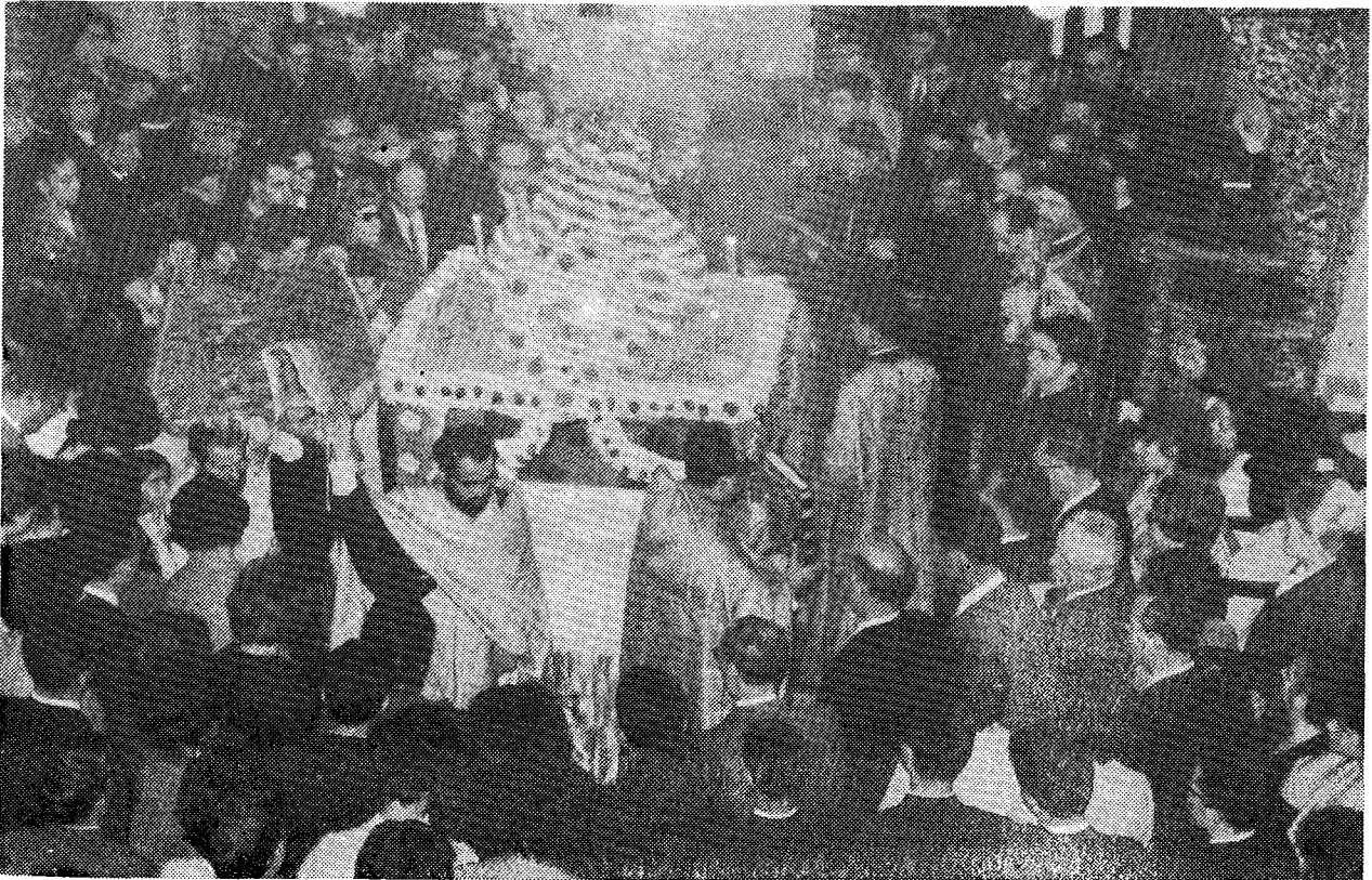
Ἡ τελετὴ τῆς ἀποκαθλώσεως ἐν τῷ Ναιδίῳ τῆς Σχολῆς. Διακρίνονται δεξιὰ καὶ ἀριστερὰ οἱ ἐκ τῶν μαθητῶν τῆς Σχολῆς ἀποτελούμενοι χοροὶ, ἐπὶ δὲ τοῦ Δεσποτικοῦ ὁ ἡγούμενος τῆς Ἱερᾶς Μονῆς καὶ Σχολάρχης τῆς Σχολῆς Σεβ. Μητροπολίτης Σταυρουπόλεως κ. Μάξιμος.

Εἰς τὴν διδασκαλίαν τῶν μαθημάτων του κατέρθανε νὰ συνδυάζῃ τὴν ξηρὰν καὶ ἀκαμπτον πολλάκις λογικὴν τῶν ἀγγλοσαξόνων θεολόγων ἐπιστημόνων καὶ τὴν εὐελιξίαν καὶ ἐλευθερίαν τοῦ ἑλληνικοῦ πνεύματος μὲ τὴν μεταφυσικὴν ἀνατολικὴν θεολογίαν καὶ τὴν ἀγωνιώδη ἐλευθερίαν τοῦ ἀνθρώπου τοῦ εἰκοστοῦ αἰῶνος μὲ τὴν συντηρητικὴν πάντοτε Ὁρθόδοξον Παράδοσιν. Τὴν τελευταίαν ταύτην ὡς καὶ τὴν ἀκριβῆ πίστιν τῆς Ὁρθοδόξου ἀλλὰ καὶ τῆς μιᾶς ἀδαι-