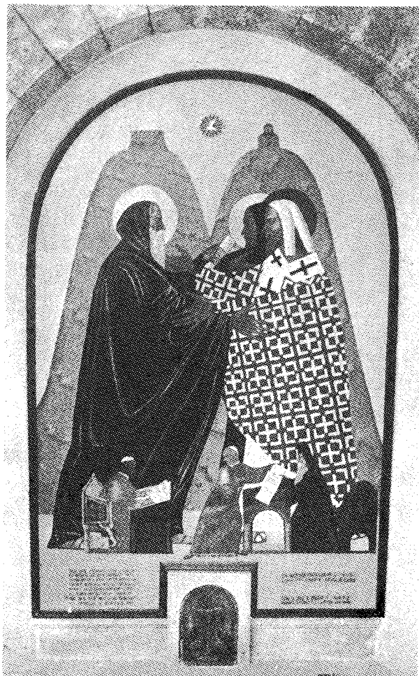
Λεπτομέρεια από τήν τοιχογραφία της βασιλικής του Άγίου Νικολάου (Μπάρι).

Πάπας από τήν πλευρά του είναι πιό στατικός, ίσιος σαν κολώνη, με δλέμια διαπεραστικό. Ένώ με τά χέρια του προσφέρει τήν τιάρα στα τρία παιδιά που βρίσκονται μπροστά του, τά μάτια του είναι καρφωμένα στόν Άθηναγόρα και ένα έλαφρό μειδίαμα που μόλις ξεχωρίζει στα χείλη του άσφαλώς άπευθύνεται στόν Πατριάρχη. Οι μορφές τους δημιουργούν μεταξύ τους μιá έντονη αντίθεση, που πάντως δένει άρμονικά. Ο λευκός καταρακτής που γαμίζει τό πρόσωπο του Άθηναγόρα αντίπαράτίθεται στο πρόσωπο του Παύλου ΣΤ', που μένει γυμνό με λίγα κοντά γκριζόμαυρα μαλλιά. Η κατάλευκη γενιάδα του Πατριάρχη τονίζεται ακόμα περισσότερο από τό μαύρο καλικάμι: που τήν περιβάλλει σαν πλαίσιο. Άντίθετα ή λευκή παπαλίνα του Ποντίφηκα φέγγει, λαμπυρίζει μάλλον, έχοντας σαν υπόδαθρο τό σκούρο χρώμα των μαλλιών του. Οι πτυχώσεις των άμφίων τους είναι ιδιαίτερα πλούσιες γιγαντώνοντας ακόμα πιό πολύ τις μορφές τους. Είναι τό μόνο κοινό σημείο τους. Άντίθετα, οι μορφές των Ένδων είναι ίσχνές, γά γά τονισθεί περισσότερο τό μέγεθος των δύο Ιεραρχών. Άκόμα και ο Αρχιεπίσκοπος Ramsey περνάει σε δεύτερη μοίρα, άφου