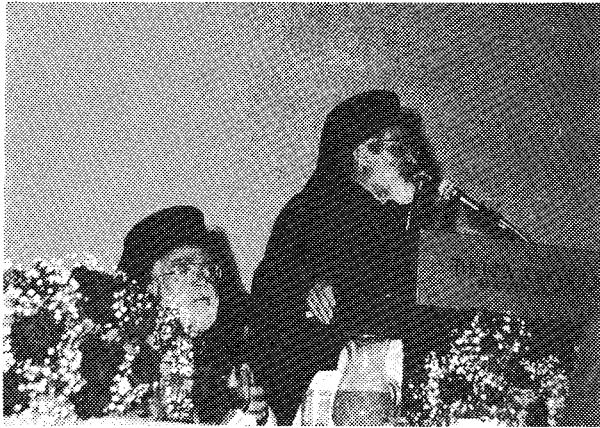
Ὁ Σεβ. Ἀρχιεπίσκοπος κ. Ἰάκωβος καὶ ὁ Σεβ. Μητροπολίτης Σταυρουπόλεως κ. Μάξιμος τῆ στιγμῆ, κατὰ τὴν ὁποία ὁ δευτέρως ἀπευθύνει χαιρετισμὸ κατὰ τὸ μεγάλο δεῖπνο.

Πρόσεχε, «ὡ ἀρχαία ψυχὴ ζεῖ μέσα μας ἀδέλφια κρυμμένη».