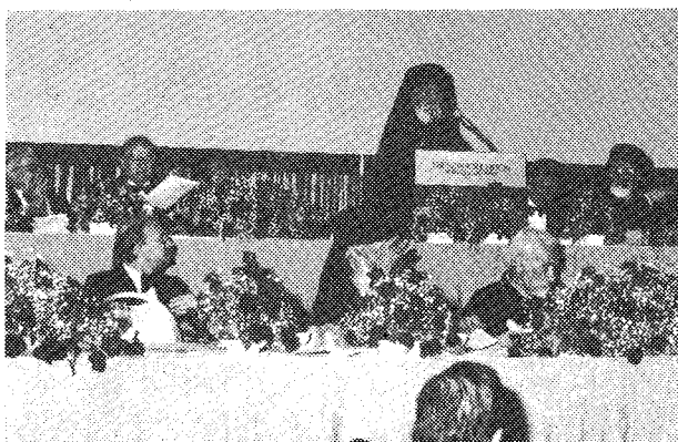
Ὁ Σεβ. Ἀρχιεπίσκοπος κ. Ἰάκωβος κατὰ τὴν ἀντιφώνησιν τοῦ στοῦ μεγάλο δεῖπνο γιὰ τὴ λήξιν τῆς ΚΖ' Κληρικολαϊκῆς.

Εἶναι γνωστὴ ἡ κρίσις, τὴν ὁποῖαν διέρχεται σήμερον ὁ κόσμος. Δὲν εἶναι κρίσις ἀπλῶς ἱστορικῆ, ἀλλὰ κρίσις αὐτῆς τῆς ἱστορίας. Ἡ τεχνολογία τῆς ζωῆς καὶ ἡ ὑποβίβασις αὐτῆς, εἰς τὴν ὑλικὴν καὶ βιολογικὴν ἐπιβίωσιν, ἀπεμάκρυνεν τὰς ἠθικὰς καὶ πνευματικὰς ἀξίας, ἀπὸ τοὺς ἰδανικοὺς στόχους τοῦ ἀνθρώπου. Ἐντεῦθεν καὶ ἡ σύγχρονος κατὰ πτωσις καὶ ἡ ἠθικὴ ἐξαθλίωσις, ἡ ὁποία δὲν συνοδεύεται ἀπλῶς ἀπὸ μίαν ἠδξημένην ἀμαρτωλότητα, ἀλλὰ χειρότερον τοῦτου, ἀπὸ μίαν μειωμένην αἴσθησιν τῆς ἀμαρτίας.