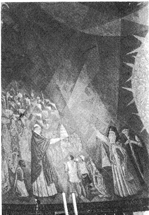
Λεπτομέρεια της τοιχογραφίας με τον Πατριάρχη Άθηναγόρα στην ίδια βασιλική του Άγίου Βαρνάβα.

τόξου της άψίδας διακρίνεται ο Θεός Πατήρ ένθρονος σε δύοξα.