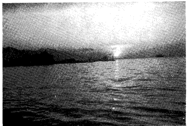
Δύση στό λιμάνι τῆς Σμύρνης....

Ὅταν γυρίζουμε τό θραδάκι: στό ξενοδοχεῖο, ἕνας λουστράκος μᾶς πλησιάζει. Ὁ ἀριθμός τῶν λουστρων δίνει: τό μέτρο τῆς φτώχειας στήν Ἀνατολή. Ἡ Σμύρνη ἔχει: ἀφθονους. Τό προσωπάκι: του εἶναι μαυρισμένο ἀπό τή θρωμιά. Εἶναι ζήτημα ἀν ἔπαισε ποτέ στά χέρια του σαπούνι. Παρά ταῦτα δυό χαριπιά ὁμορφα ματάκια καί δυό σειρές μαργαριταρένια δόντια λάμπουν. Εἶναι φορτωμένος μέ τό κλασικό κασσελάκι, κρεμασμένο ἀπό τόν ὄμο του. Μοῦ δείχνει: τά παπούτσια μου καί θέλει: σώνει: καί καλᾶ νά μου τά γυαλίσει. Δέν ἔχω καμμιᾶ ὄρεξη γιά τέτοια δουλειά αὐτή τήν ὥρα. Ἐπιμένει, ὅμως, μέ τήν παυδική του διάθεση, πού δέν τοῦ λείπει.