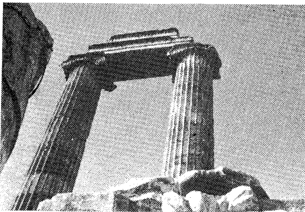
Ἐρείπια τοῦ Ναοῦ τοῦ Διδυμαίου Ἀπόλλωνος.

Βέβαια, ὁ τροχὸς σὲ λίγο γύρισε. Ἦρθε ὁ Ἀλέξανδρος καὶ σάρωσε, κυριολεκτικὰ, τοὺς Πέρσες. Καὶ οἱ Διάδοχοί του, ξανάκτισαν τὸ Ναὸ τοῦ Διδυμαίου Ἀπόλλωνος, με ἀπαράμιλλο κάλλος. Πρῶτος καὶ καλύτερος ἀπ' αὐτούς, ὁ Σέλευκος ὁ Α' βασιλεὺς τῆς Συρίας, πού συνέβαλε στὴν ἀποκατάστασί του καὶ ἔφερε ἀπὸ τὴν Περσία τὸ ἄγαλμα τοῦ θεοῦ.