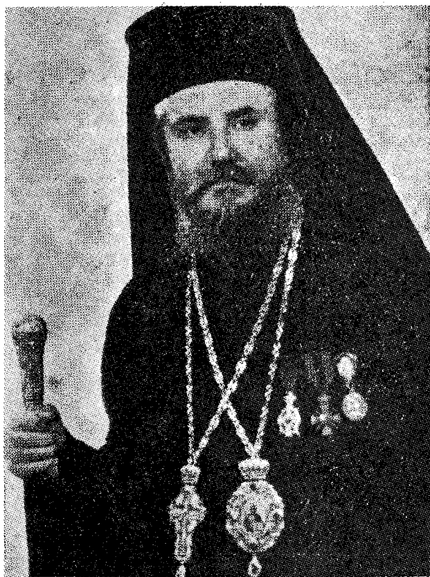
Ό Σεβ. Μητροπολίτης πρ. Λαρίσης και Πλαταμώνος κυρός Ίάκωβος.

Έκτοτε, και ως χθές, έζη έντίμως και άσκητικώς. Έχων εκκλησιαστικόν ως εκ τής πνευματικής αύτου καταγωγής φρόνημα, ούδέποτε ήκούσθη κατά τό διάστημα τών 17 αύτων διατρεξάντων έτών γογγύζων κατά τών εκάστοτε κρατούντων εν τή Έκκλησιαστική ήγεσία. Έφρόνει και έβίον τό τού Ίωάννου τού Χρυσοστόμου: «Έκκλησίας όνομά έστιν όμονοίας και συμφωνίας όνομα». Ό άσκητισμός του, διά τόν όποιον δυνάμεθα σήμερα νά τόν προβάλλωμεν ως ύπόδειγμα, τόν καταξιώνει ως εκκλησιαστικόν άνδρα περιωπής, άφου ή άσκησις είναι ή πεμπουσία τής Όρθοδοξου ήμών πίστεως. Διά τής άσκήσεως, είναι καταφανές, ν ε υ ρ ο υ τ α ι τό Σώμα τής Έκκλησίας, ήτις άλλως θα ήτο παραλελυμένη. Καρπός τής άσκήσεως, είναι ή τελεία ύπακοή τού ανθρώπου εις τόν Θεόν, καρ-