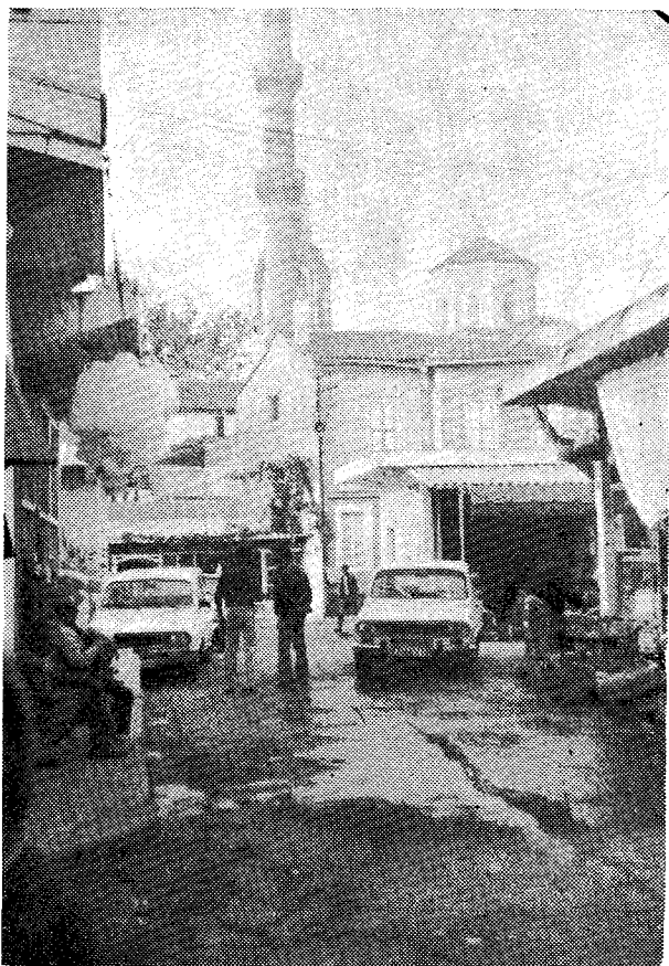
Ο ιερός Ναός του Αγίου Νικολάου Κυδωνιών—Τζαμί.

τιλήγη, να μείνουμε εκεί δυο μέρες και τελικά να ξαναδοῦμε τὸν αττικό οὐρανό.