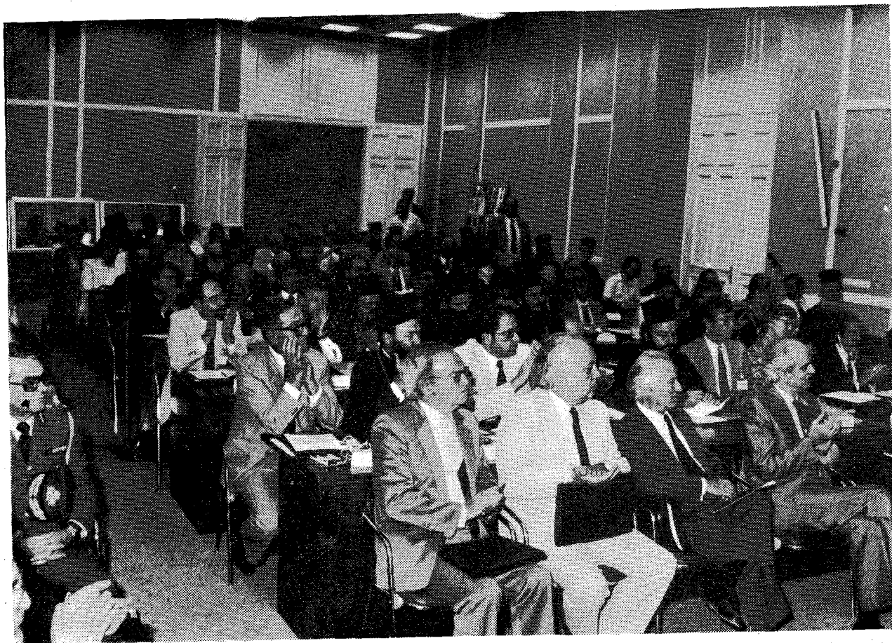
Άποψη των επίσημων, προσκεκλημένων και συνέδρων κατά τις έργασίες τής Όλομελείας των συνέδρων.

Τήν καθολική αυτή άποδοχή έσπευσε ό Μακα-