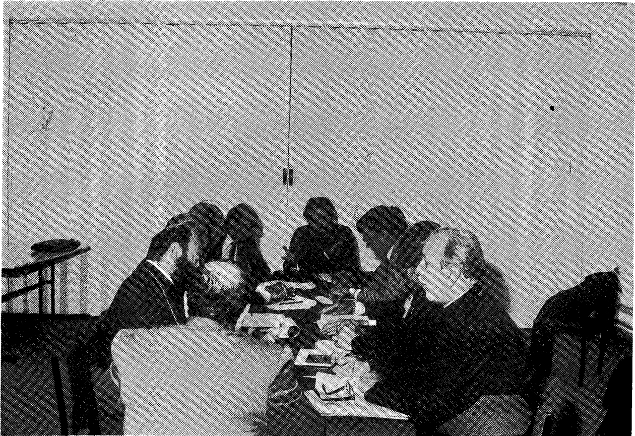
Ἀπὸ τῆς ἐργασίας τῆς γαλλόφωνης ἐμάδας.

Τέταρτον , τέλος, ὅτι πᾶσαι αἱ Ἐκκλησίαι εἶναι ἀποφασισμέναι νὰ ἀγωνισθοῦν διὰ μίαν δικαίαν, συμμετοχικὴν, ἀλληλέγγυον καὶ οἰκολογικῶς υπεύθυνον κοινωνίαν, συνεχίζουσαι τὸ ἔργον τοῦ Κυρίου, τὸ ὅποιον κατὰ τὴν ρῆσιν τοῦ Ἰδίου ἐγκεῖται εἰς τὸν εὐαγγελισμόν τῶν πτωχῶν, τὴν ἴασιν τῶν συντετριμμένων τὴν καρδίαν, τὴν ἀπελευθέρωσιν τῶν αἰχμαλώτων, τὴν ἀνάβλεψιν τῶν τυφλῶν, τὴν ἀπελευθέρωσιν τῶν καταπιεζομένων καὶ τὸ κήρυγμα τοῦ ἔτους εὐνοίας τοῦ Κυρίου (Λουκᾶ δ', 18-19).