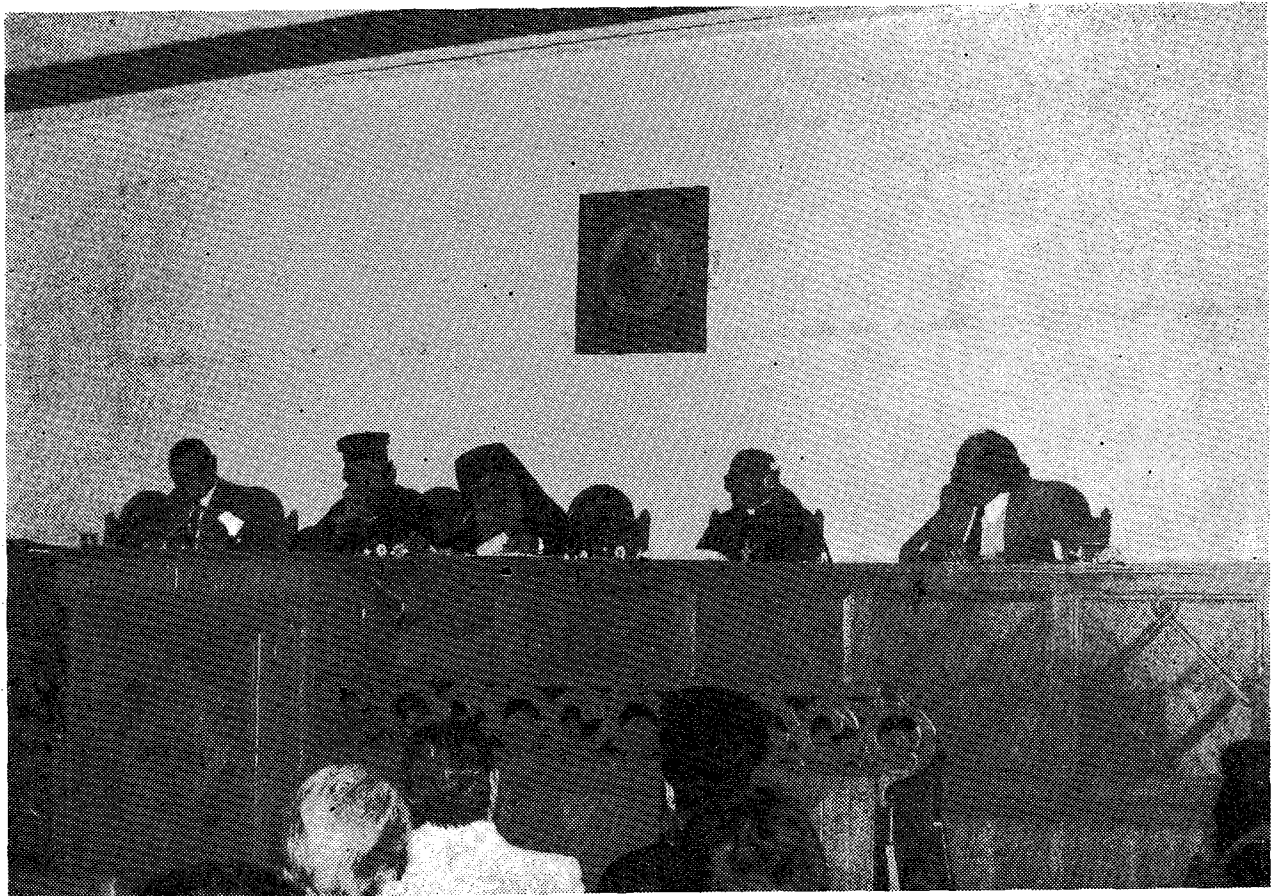
Ἀπὸ τὴν τελικὴ συνεδρία τῆς Ὀλομελείας τῶν συνέδρων στὸ Διορθόδοξο Κέντρο.

«Σὺ δὲ ὅταν ἀκούσεις τὴ λέξη πείνα, νὰ μὴν τὴν ἀντιπαρέλθεις μέ ἀδιαφορία... Γιατὶ ἡ πείνα, εἶναι ὅπως ἓνας δῆμιος πὸν βρίσκεται μέσα στὰ σπλάγγνα