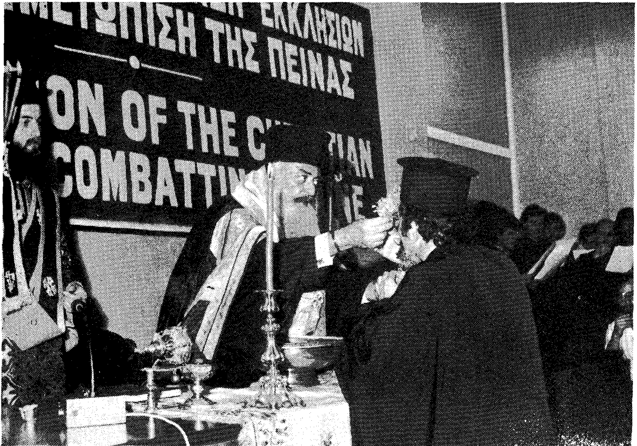
Ὁ Μακ. Ἀρχιεπίσκοπος Ἀθηνῶν καὶ πάσης Ἑλλάδος κ. Σεραφεῖμ ραντίζει μετὸν Ἁγιασμό τῆς ἐνάρξεως τῶν Σεβ. Μητροπολιτῶν Ἑλβετίας κ. Δαμασκηνῶ, ἐκπρόσωπο τῆς Μεγάλῃς τοῦ Χριστοῦ Ἐκκλησίας.

«Ὁ ὑπὸ τοῦ Παναγίου Πνεύματος ἀενάως διεπόμενος Θεανθρώπινος ὄργανισμός τῆς Ἐκκλησίας ἀσφαλῆς παρακαταθήκη τυγχάνων τῶν ἀποκεκαλυμμένων τοῖς ἀνθρώποις διὰ Ἰησοῦ Χριστοῦ ἀληθειῶν τῶν διὰ τὴν σωτηρίαν προοριζομένων διὰ τῶν ἐκπροσώπων Αὐτοῦ θέσιν ἐπέχει λιμένος τῶν τοῦ βίου ἀναγκῶν ἅμα καὶ ταμεῖον χάριτος ἐν ᾧ δέον ἐπιλύεσθαι πάντα τὰ κοινωνικὰ προβλήματα τὰ ἀπασχολοῦντα τὴν ἀνθρωπότητα, τοῦθ' ὅπερ καὶ ὑπαγορεύεται διὰ τῆς Κυριακῆς ἐντολῆς «ἐφ' ὅσον ἐποιήσατε ἐνὶ τούτων τῶν ἀδελφῶν μου τῶν ἐλαχίστων ἐμοὶ ἐποιήσατε» (Ματθ. 25, 40). Τούτων τῶν θείων προσταγμάτων καὶ ἡμεῖς κατακολουθοῦντες ἐχάρημεν σφό-