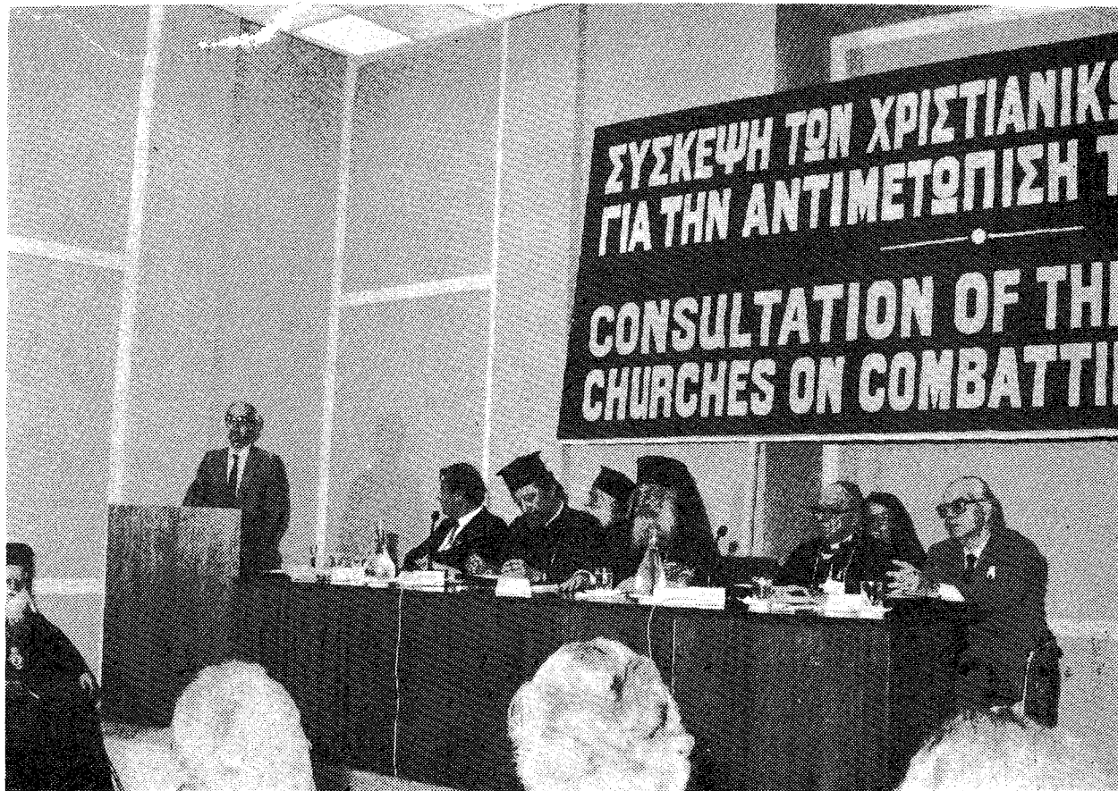
Ο Υπουργός Έθν. Παιδείας και Θρησκευμάτων κ. 'Απ. Κακλαμάνης άπευθύνει χαιρετισμό πρὸς τοὺς συνέδρους.

ριώτατος νά γνωρίσει στους 'Αρχηγούς και Προκαθημένους τῶν Χριστιανικῶν 'Εκκλησιῶν με δεύτερη ἐπιστολή του, τὸ κείμενο τῆς ὁποίας ἔχει ὡς ἑξῆς: