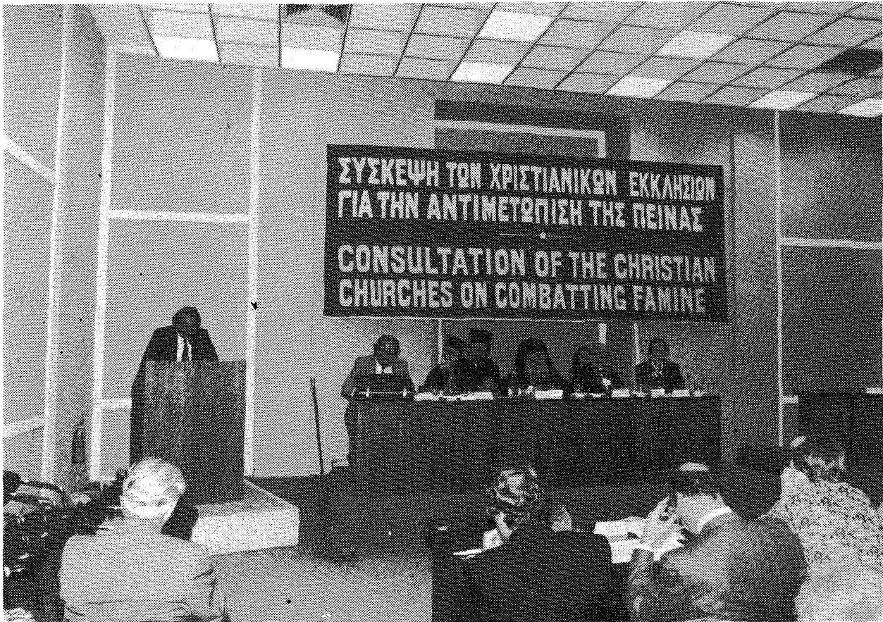
Στιγμιότυπο από τις εργασίες της 'Ολομελείας της Συσκέψεως υπό την προεδρία του Μακ. 'Αρχιεπισκόπου 'Αθηνών και πάσης 'Ελλάδος κ. Σεραφείμ.

δρα αναγνώντες κατ' ἴδιαν καὶ τῇ περὶ 'Ημᾶς ΚΘ' (16-3-1984) Συνεδρία τῆς 'Αγίας καὶ 'Ιερᾶς Συνόδου τὰ τίμια Γράμματα τῆς ὑμετέρας Μακαριότητος... 'Ανταποκρινόμενοι, ὅθεν, τῇ προτάσει καὶ εἰσηγήσει Ἀδτῆς, τοῦτο μὲν ἐπιθυμοῦμεν διαβιβασθῆναι Ἀδτῇ τὰς συγκαρητηρίους ἡμῶν Ἐδχὰς ἐπὶ τῇ πάνυ ἀξιεπαίνῳ πρωτοβουλίᾳ, ἣν Ἀδτῆ ἔσχεν συγκαλέσασθαι ἐν τῷ 'Αστει τῶν 'Αθηνῶν τοιοῦτον συμπόσιον μελέτης περὶ τῶν λιμοκτονούντων σενανθρώπων ἡμῶν, ὅπερ καὶ τιμῆσει ἰδιαζόντως τὴν τε Χριστιανικὴν 'Ορθόδοξον 'Εκκλησίαν καὶ τὴν τῆς 'Ελλάδος τοιαύτην, τοῦτο δὲ διαβεβαιώσασθαι Ἀδτῇ ὅτι τὸ ἡμέτερον Πατριαρχεῖον προθύμως συμμετάσχει ἐν τῇ προσκέψει».