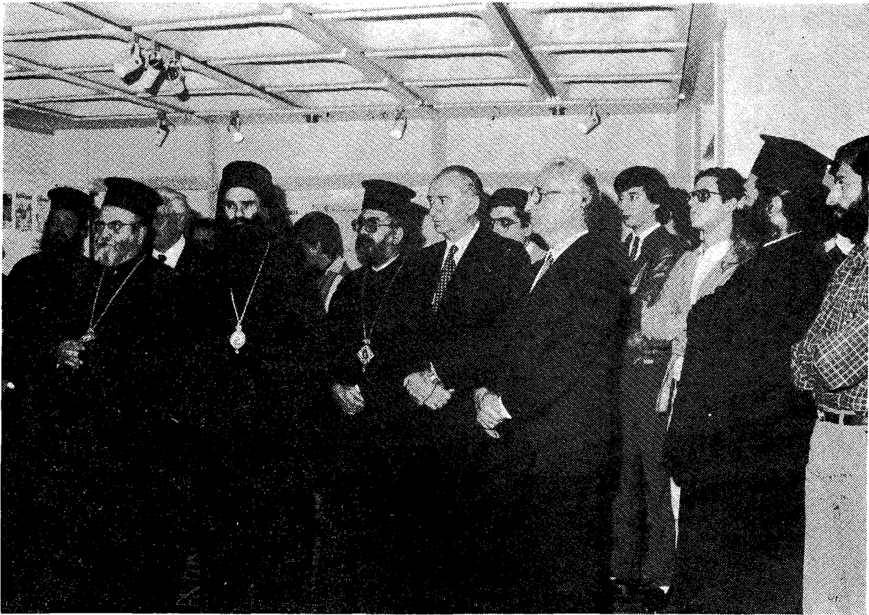
Ἀπὸ τὰ ἐγκαινία τῆς Β' Ἐκθέσεως Πανορθοδόξου Ἐκκλησιαστικοῦ Τύπου ποὺ ὀργάνωσε τὸ Γραφεῖο Τύπου τῆς Ἱερᾶς Συνόδου στὸ Κέντρο Βιβλίου καὶ Ἐπικοινωνίας τῆς Ἀποστολικῆς Διακονίας.