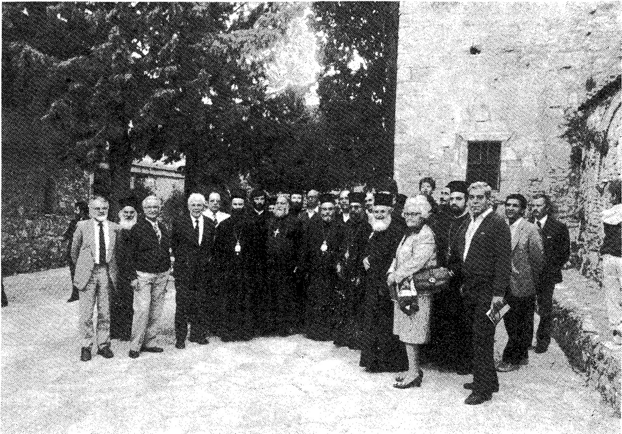
Οἱ σύνεδροι στὴν Ἱ.Μ. Ὁσίου Μελετίου περιστοιχίζουσι τὸν Σεβ. Μητροπολίτη Μεγάρων καὶ Σαλαμίνος κ. Βαρθολομαῖο.

Ἐπ' εὐκαιρία ἐπιθυμῶ νὰ ἐκφράσω θερμότητα εὐχαριστίας καὶ πρὸς τὴν Ἑλληνικὴν Κυβέρνησιν διὰ τὴν ἀποτελεσματικὴν συμβολὴν αὐτῆς εἰς τὴν πραγματοποίησιν τοῦ Συνεδρίου, ὡς καὶ πρὸς τὰ μέλη τῆς τε Τιμητικῆς καὶ τῆς Ὀργανωτικῆς Ἐκτελεστικῆς Ἐπιτροπῆς τοῦ Συνεδρίου διὰ τὴν προσφορὰν ἐνὸς ἐκάστου, προσέτι δὲ πρὸς τὸ Ἀνώτατον Πνευματικὸν Ἰδρυμα τῆς χώρας μας, τὸ Παγκόσμιον Συμβούλιον Ἐκκλησιῶν καὶ τὴν «Γιούνισεφ» διὰ τὴν ἀποστολὴν ἀρμοδίων εἰσηγητῶν καὶ πρὸς τοὺς ἐκπροσώπους τοῦ ἑλληνικοῦ καὶ ξένου Τύπου, οἱ ὁποῖοι καλύπτουσι τὰς ἐργασίας τοῦ Συνεδρίου μας».