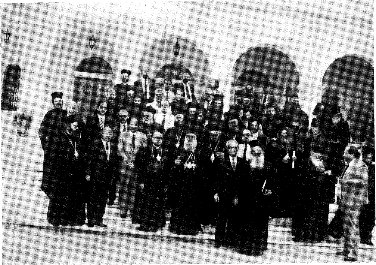
Ἀναμνηστικὴ φωτογραφία τῶν συνέδρων μὲ τὸν Μακαριώτατο μετὰ τὴ λήξη τῶν ἔργασιῶν τῆς Συσκέψεως στὸ Διορθόδοξο Κέντρο τῆς Ἱ. Μονῆς Πεντέλης.

Ἡ Καθολικὴ Ἐκκλησία ἐπωφελεῖται τῆς εὐκαιρίας γιὰ νὰ ἐκφράσει πρὸς τὸν Μακαριώτατο Ἀρχιεπίσκοπο, τὴν Ἱεραρχία, τὸν ἱερό κλῆρο καὶ τὸν πιστὸ λαὸ τῆς Σεβασμίας Ὁρθοδόξου Ἐκκλησίας τῆς Ἑλλάδος τὸν ἀδελφικὸ τῆς ἀσπασμὸ εἰρήνης καὶ σεβασμοῦ καὶ τὴ διαβεβαίωση τοῦ εὐλικρινοῦς τῆς