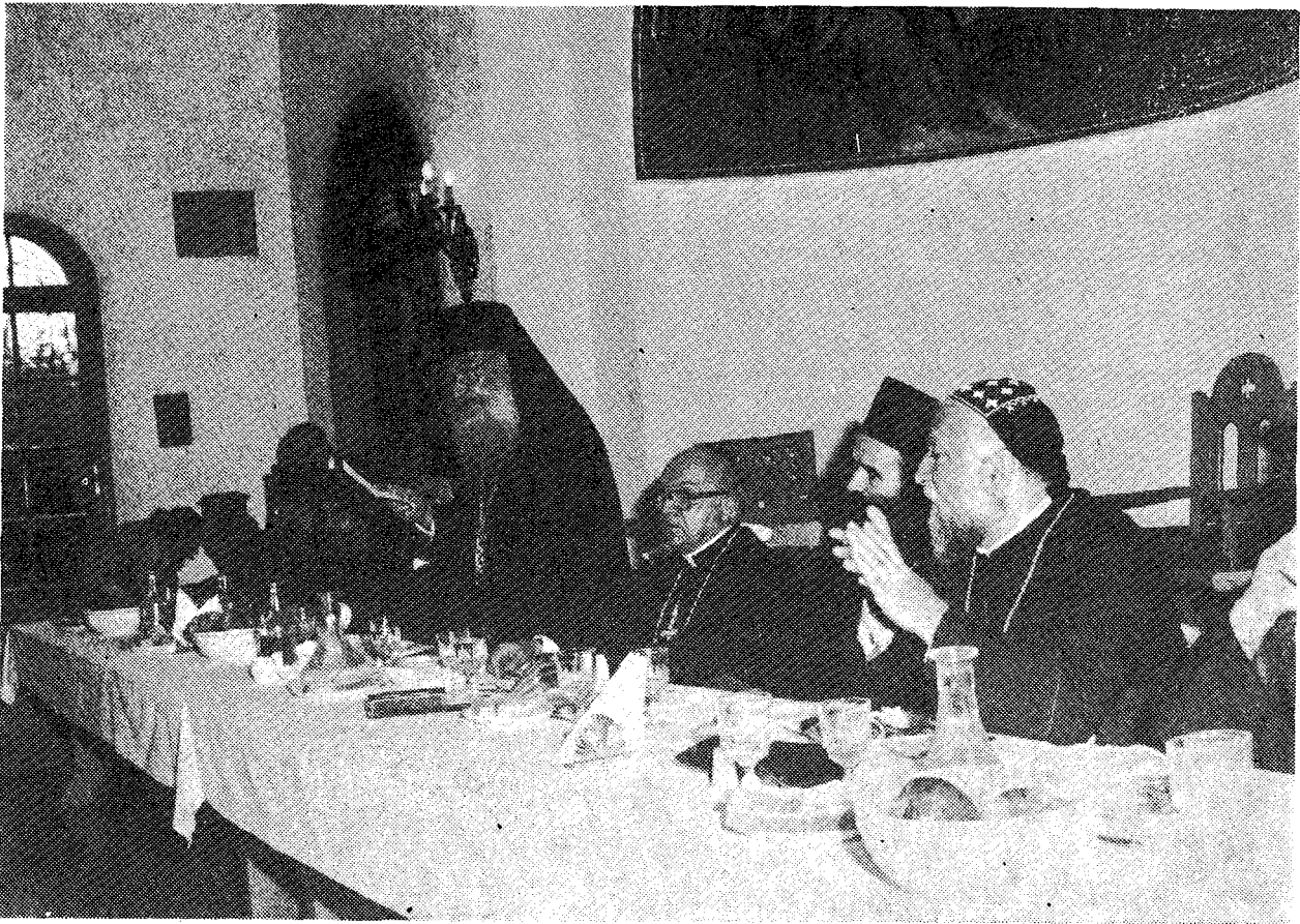
Ἀπὸ τὸ ἀποχαιρετιστήριο γεῦμα στὴν Ἱ. Μονὴ Πεντέλης.

καὶ ἀποφιλῶναι ὅλα τὰ μέλη, κατατρώγοντας τὸ σῶμα ἀπὸ κάθε πλευρὰ μὲ σκληρότερο τρόπο ἀπὸ κάθε ἰσχυρὴ φωτιά ἢ ἄγριο σαρκοβόρο θηρίο καὶ προκαλώντας συνεχεῖς καὶ ἀπεριγράπτους πόνους. Καὶ γιὰ νὰ κατανοήσεις πληρέστερα τί συμφορὰ εἶναι ἡ πείνα, θὰ ἀρκοῦσε τὸ γεγονός ὅτι ἀκόμη καὶ μητέρες πολλὲς φορές πὸν δὲν μποροῦσαν νὰ ὑποφέρουν τὴν σκληρότητα τοῦ φοβεροῦ κακοῦ, ἔφαγαν τὰ παιδιά τους... Ἔφαγαν δηλαδὴ οἱ μητέρες τὰ παιδιά τους καὶ ἔγινε ἔτσι τάφος τους, ἡ κοιλία πὸν τὰ γέννησε. Ἡ πείνα δηλαδὴ ὑπερίσχυσε καὶ ἀπ' αὐτὴν ἀκόμη τὴ φύση...» (Ὁμιλία Ἐγκωμιαστική, εἰς τὸν μάρτυρα Λουκιανόν, 2).