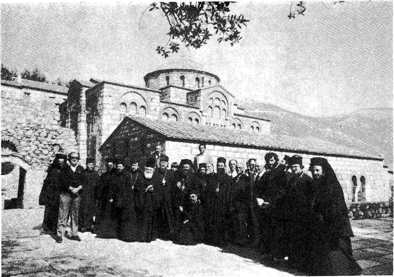
Οἱ σύμβουλοι στὴν Ἱ. Μ. Ὁσίου Λουκᾶ περιστοιχίζουσι τὸν Σεβ. Μητροπολίτη Θεβῶν καὶ Λεβαδείας κ. Ἰερώνυμο.

Μὲ τὰς σκέψεις αὐτὰς σᾶς καλωσορίζω, σᾶς εὐχαριστῶ ἐκ μέσης καρδίας, ὡς καὶ τὰς Ἐκκλησίας ἐξ ὧν προέρχεσθε διὰ τὴν συμμετοχὴν σας εἰς τὸ Συνέδριον καὶ εὐχομαι πλήρη εὐδόσιν τῶν ἐργασιῶν τῆς Συνσκέψεως.