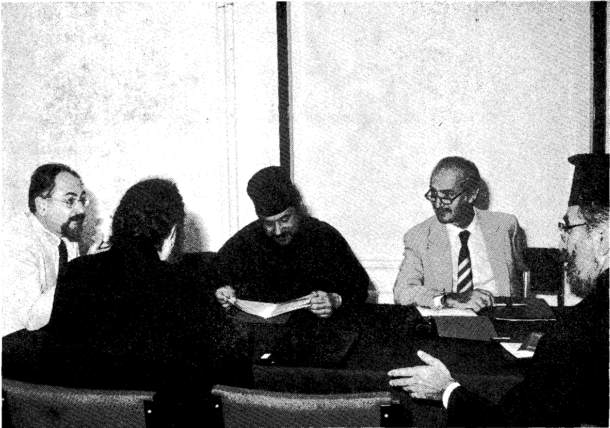
Ἀπὸ τὶς ἐργασίες τῆς ἐλληνόφωνης ὀμάδας.

Στὸ μεταξύ οἱ Προκαθήμενοι τῶν Ἐκκλησιῶν ἄρχισαν νὰ ὀρίζουν τοὺς ἐκπροσώπους τους, κληρικούς μὲ γνώση τοῦ θέματος καὶ οικονομολόγους. Οἱ ἐκπρόσωποι αὐτοὶ ἀποτελέσαν τὴν ὀλομέλεια τῆς Συσκέψεως: