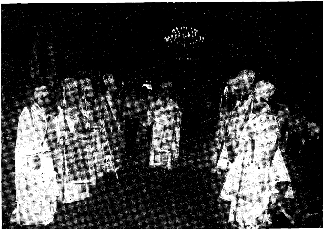
Στιγμιότυπο ἀπὸ τὸ Συλλεῖτουργο στὸν Καθεδρικό Ναὸ Ἀθηνῶν προεξάρχοντος τοῦ Μακ. Ἀρχιεπισκόπου Ἀθηνῶν καὶ πάσης Ἑλλάδος κ. Σεραφεῖμ.

Μὲ τὰ τεράστια πυρηνικὰ ὀπλοστάσια καὶ τὴ σωρεία τῶν συμβατικῶν ὀπλων ποὺ ὑπάρχουν, καταλαβαίνει ὁ καθένας τὴν τεράστια ἀποθέματα μηχανημάτων καὶ ἐργοστασίων εἰρήνης μποροῦσαν νὰ κατασκευαστοῦν γιὰ τὴν τροφή καὶ τὴ ζωὴ τοῦ κόσμου. Πῶς νὰ μὴν τρομάξουν τὰ παιδιά μας, οἱ σημερινοὶ νέοι, ὅταν ἀκοῦνε ὅτι πεθαίνουν σαράντα χιλιάδες παιδιά τὴν ἡμέρα σ' ὅλον τὸν κόσμο, καὶ ἀπὸ τὴν ἄλλη πληροφοροῦνται γιὰ τὰ τεράστια ποσὰ ποὺ καταναλώνονται γιὰ τὴν πυρηνικὴ κεφαλὴ καὶ γιὰ τὸν «ἐξοπλισμὸ τοῦ διαστήματος»; Καὶ πῶς νὰ μὴν «ἀρνηθοῦν» αὐτὸν τὸν κόσμο ποὺ πλάθουν οἱ ἁμαρτωλὲς συμμαχίες τῶν μεγάλων καὶ οἱ συμφεροντολογικὲς τους ἐπιδιώξεις;