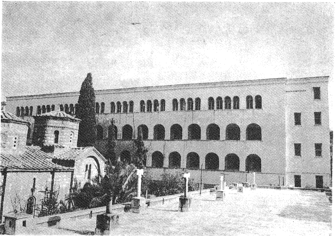
Τὸ κτίριο τοῦ Θεολογικοῦ Οἰκοτροφείου τῆς Ἀποστολικῆς Διακονίας τὸ ὁποῖο ἀπὸ τοῦ ἔτους 1970 χρησιμοποιεῖται ὡς διοικητικὸ κέντρο τῆς Ἐκκλησίας τῆς Ἑλλάδος. Ἀριστερὰ τὸ Καθολικὸ τῆς Ἱερᾶς Μονῆς Πετράκη.

Ἀπώτερος σκοπὸς τῆς ἐργασίας αὐτῆς εἶναι νὰ ἀφυπνήσει τὶς συνηθῆσεις ὅλων ὅσοι ἔζησαν, ἐργάστηκαν καὶ ποικιλότροπα ὠφελήθηκαν ἀπὸ τὴν ὑπαρξὴ του, ὥστε θέτοντας σὲ ἐργήγορη τὶς δυνάμεις τους καὶ ἐξευροίκοντας τρόπους συνεχίσεως τῆς ζωῆς του, νὰ συντελέσουν στὴν ἀνάκαμψη τῆς οἰκονομίας του καὶ στὴν ἐπαναδραστηριοποίηση τῆς Θεολογικῆς παρουσίας του μέσα στὸν σύγχρονο κόσμο. Δὲν εἶναι δίκαιο νὰ φορτώνουμε τὶς εὐθύνες στοὺς ὤμους τοῦ Προκαθημένου τῆς Ἐκκλησίας ἢ τῶν δύο - τριῶν ὑπευθύνων. Ἐπιβάλλεται νὰ αἰσθανόμαστε ὅλοι συνυπεύθυνοι γιὰ τὴν πορεία κάθε ἐκκλησιαστικοῦ ἔργου, ἐφ' ὅσον πιστεύουμε, διὰ πρῶπει μέσα στὴν Ὀρθοδο-