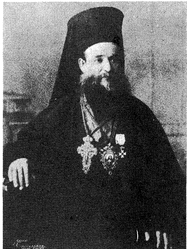
Ὁ Μητροπολίτης Ἀθηνῶν Γερμανὸς Καλλιγᾶς († 1896) ἐμπνευστὴς τοῦ θεσμοῦ τοῦ Θεολογικοῦ Οἰκοτροφείου.

Πρῶτος, ὁ ὁποῖος συνέλαβε τὴν ἰδέαν ἰδρύσεως Θεολογικοῦ Οἰκοτροφείου, ὑπῆρξε ὁ Μητροπολίτης Ἀθηνῶν Γερμανὸς Καλλιγᾶς (1885 - 1896). Ἀπὸ τὶς πρῶτες ἡμέρες τῆς ἀρχιερατείας του σὴν πρωτεύουσα ἐλειτούργησε σὲ ὑποτυπώδη μορφὴ οἰκοτροφεῖο σὸ Μητροπολιτικὸ οἶκημα μὲ δέκα οἰκοτρόφους, οἱ ὁποῖοι ζούσαν ὑπὸ τὴν ἐπιτήρησίν του μὲ αὐστηρὸν Μοναστηριακὸ τυπικὸν, οἱ περισσότεροί τῶν ὀλοίων μετὰ τὴν ὀφοίτησίν τους ἀπὸ τὴν Θεολογικὴν Σχολὴν ἔγιναν κληρικοὶ (βλ. Βασιλείου Ἀτέση, Μητροπολίτου πρ. Λήμνου, Ἡ Ἐκκλησία τῶν Ἀθηνῶν, «Ἀναμόρφωσις» 1954, σ. 70).