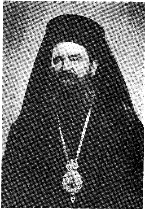
Ὁ ἀείμνηστος Μητροπολίτης Ἀργολίδος κυρὸς Χρυσόστομος

Τὴν Νεκρώσιμον Ἀκολουθίαν παρηκολούθησαν ὁ Νομάρχης Ἀργολίδος, αἱ Πολιτικά, Δημοτικά καὶ Στρατιωτικά Ἀρχαὶ καὶ χιλιάδες λαοῦ ποὺ εἶχον κατακλύσει τὸν Ναόν, τὴν ἔξω πλατείαν καὶ τὰς πέριξ ὁδοὺς.