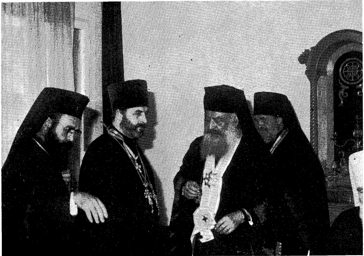
Κατὰ τὴν ἐπίσκεψιν τοῦ Μακ. Μητροπολίτη Πράγας καὶ πάσης Τσεχοσλοβακίας κ. Δωροθέου στὴν Ἱερὰ Σύνοδο ἀνταλλάχθηκαν τμητικὲς διακρίσεις ἀνάμεσα στὰ μέλη τῆς ἀκολουθίας του καὶ τὰ μέλη τῆς Δ.Ι.Σ. Ἀνωτέρω ὁ Μακ. Ἀρχιεπίσκοπος κ. Σεραφεῖμ παρασημοφορεῖ τὸν Πρωτ. π. Ἱεροσλάβ.

ποὺ ἐπάξια διακονεῖτε. Εἶθε καὶ οἱ διάδοχοί σας νὰ ἀκολουθήσουν τὸ παράδειγμά σας. Σᾶς εὐχαριστῶ γιὰ τοὺς ὕμνους καὶ τὶς δοξολογίες, ποὺ τόσο δημοφιλῶς ἔφαλαν οἱ Ἀδελφοὶ τῆς Μονῆς. Ἡ προσευχὴ εἶναι τὸ μόνο στήριγμα στὰ δύσκολα χρόνια ποὺ περνᾶμε. Ἡ Παναγία νὰ σᾶς σκεπάζει μὲ τὸ ἀμόφορό Της καὶ ἡ εὐλογοῦσα δεξιὰ τοῦ Κυρίου νὰ ὑπερίπταται τῶν κεφαλῶν σας πάντοτε. Σᾶς παρακαλῶ νὰ μοῦ δώσετε τὰ ὀνόματα τῶν Πατέρων τῆς Μονῆς γιὰ νὰ τὰ μνημονεύουμε».