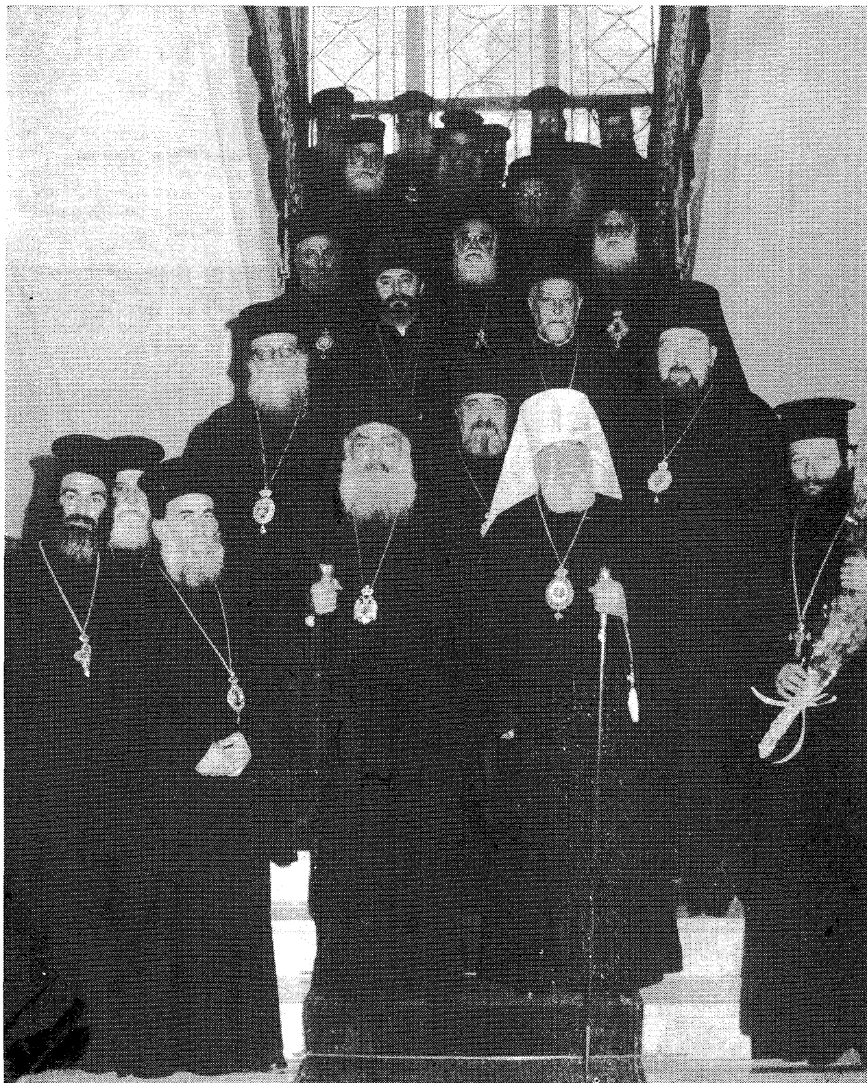
Άναμνηστική φωτογραφία από την επίσκεψη του Μακ. Μητροπολίτη Πράγας και πάσης Τσεχοσλοβακίας στην ΄Ι. Άρχιεπισκοπή Άθηνών. Δίπλα του ο Μακ. Άρχιεπίσκοπος Άθηνών και πάσης Ελλάδος κ. Σεραφείμ.