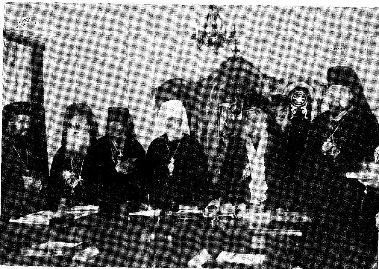
Άπό τήν επίσκεψη τοῦ Μακ. Μητροπολίτη Πράγας καί πάσης Τσεχοσλοβακίας κ. Δωροθέου στήν ἔδρα τῆς Ἱερᾶς Συνόδου τῆς Ἐκκλησίας τῆς Ἑλλάδος τήν Δευτέρα 4 Νοεμβρίου τὸ πρωί. Δίπλα του ὁ Μακ. Ἀρχιεπίσκοπος Ἀθηνῶν καί πάσης Ἑλλάδος κ. Σεραφεῖμ.

δαλώδη Ἀθήνα εἶναι ἡ πνευματικὴ ἀκτινοβολία. Διαπρεπεῖς ἐκκλησιαστικὲς προσωπικότητες, ὅπως ὁ μακαριστὸς Πατριάρχης Ἀθηναγόρας καί πολλοὶ σημερινοὶ Ἑλληνες Ἱεράρχες, ὑπῆρξαν ἀδελφοὶ τῆς Μονῆς.