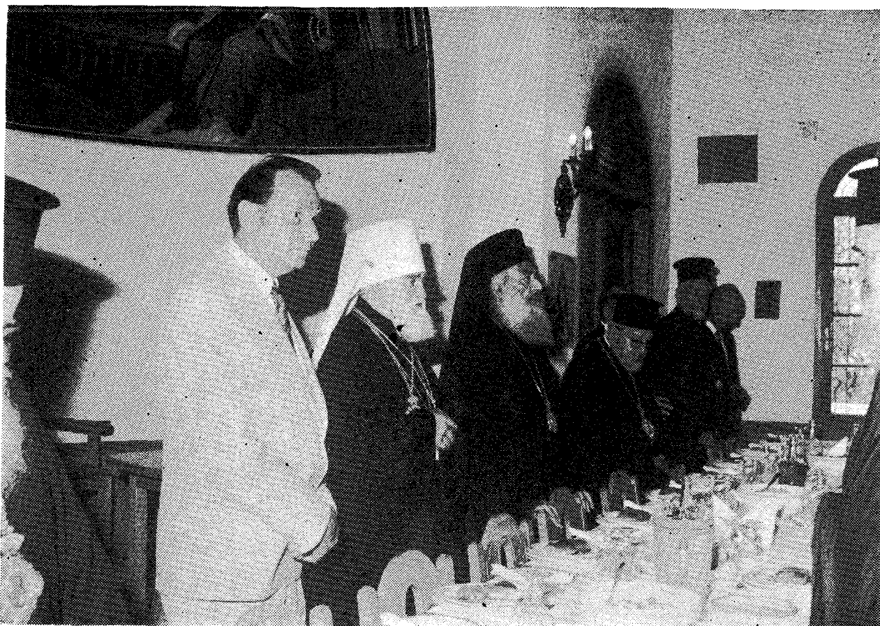
Άπό τό επίσημο γεύμα πού παρέθεσε ὁ Μακ. Άρχιεπίσκοπος Άθηνῶν καί πάσης Ἑλλάδος κ. Σεραφεῖμ τό μεσημέρι τῆς Κυριακῆς 3 Νοεμβρίου πρὸς τιμὴν τοῦ Μακ. Μητροπολίτη Πράγας καί πάσης Τσεχοσλοβακίας στὴν Ἱ. Μονὴ Πεντέλης.

βόλως μεγάλη σημασία ἔχει στις ἡμέρες μας ὁ ἀμοιβαῖος ἀδελφικός δεσμός, ἡ φιλία. Ὁ Κύριος καὶ Σωτὴρ ἡμῶν τοὺς Ἅγίους Ἀδίου Μαθητὰς τοὺς ὀνόμασε καὶ φίλους. Ἐκεῖνοι οἱ ὁποῖοι κατὰ τὴν θείαν κλήσιν ἀνέλαβαν τὴν Ἀποστολικὴν διακονίαν δὲν εἶναι δυνατὸν νὰ μὴν αἰσθάνωνται ἐναντὸς δεμένους μεταξὺ τους, μὲ τὰ δεσμὰ τῆς Ἐδαγγελικῆς Ἀγάπης καὶ φιλίας αἱ ὁποῖαι εἶναι ἔξω ἀπὸ κάθε θία καὶ πίεσιν. Ἐχω ὑπ' ὄψει μου τὴν ἀδελφικὴ ἀγάπη τῶν Ἀρχιερέων πρὸς τὸν Προκαθήμενόν τους καθὼς καὶ τὴν Ἀγάπην του πρὸς τὴν Ἀδελφότητά του.