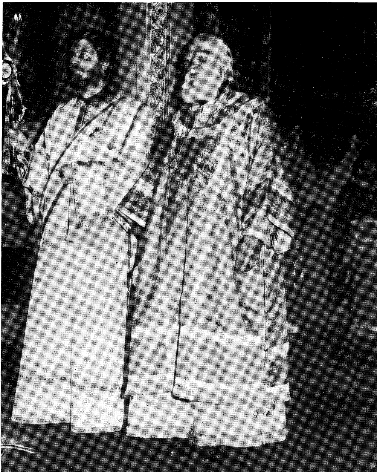
Ο Μακ. Μητροπολίτης Πράγας και πάσης Τσεχοσλοβακίας κατά τή Θεία Λειτουργία τής Κυριακῆς 3 Νοεμβρίου 1985 στόν Καθεδρικό Ναό Ἀθηνῶν.