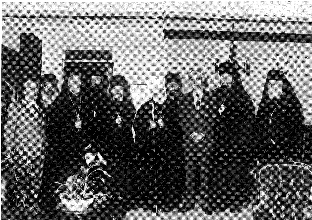
Ἀπὸ τὴν ἐθιμοτυπικὴ ἐπίσκεψιν τοῦ Μακ. Μητροπολίτη Πράγας καὶ πάσης Τσεχοσλοβακίας κ. Δωροθέου στὸν Ὑπουργὸ Ἐθνικῆς Παιδείας καὶ Θρησκευμάτων κ. Ἀπ. Κακλαμάνη.

λά μὲ τὴν χάριν καὶ τὴν δύναμιν τοῦ Ἁγίου Θεοῦ, ἐξῆλθε νικητρία καὶ πάλιν, κηρύσσει τὴν ἀλήθειαν τοῦ Εὐαγγελίου ἐν τῇ ἱστορικῇ ταύτῃ χώρᾳ.