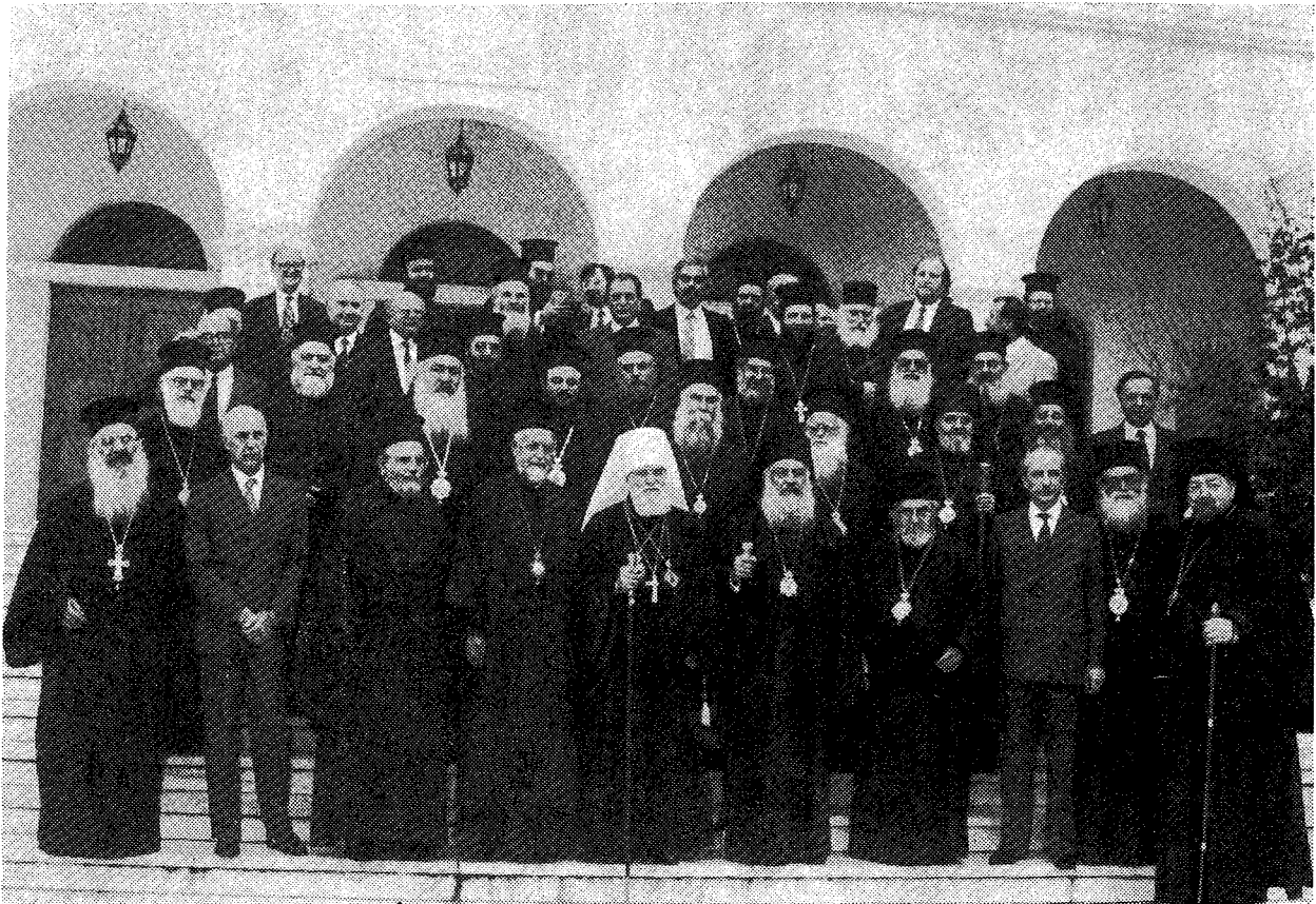
Αναμνηστική φωτογραφία από την επίσκεψη του Μακ. Μητροπολίτη Πράγας και πάσης Τσεχοσλοβακίας κ. Δωροθέου την Κυριακή 3 Νοεμβρίου 1985 στην Ί. Μ. Πεντέλης. Δίπλα του ο Μακ. Αρχιεπίσκοπος Αθηνών και πάσης Ελλάδος κ. Σεραφείμ.

λή αγάπη και πολύ σεβασμό ένα κομμάτι από την συντελούμενη εργασία της Εκκλησίας εις τὸν εὐαίσθητον χρόνον τῆς νεότητος. Καὶ πάλι σὰς καλωσορίζουμε καὶ σὰς εὐχόμεθα ἡ διαμονή σας εἰς τὸν ἐλλαδικὸν χώρον γὰ σὰς εἶναι ἀνακούφισις, χαρὰ καὶ οἰκοδομὴ καὶ δι' ὅλους μας ψυχικὴ ἡρεμία».