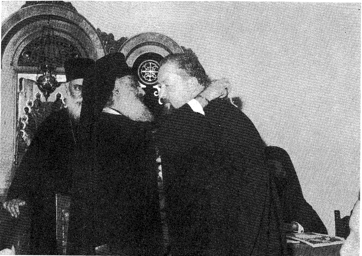
Ὁ Μακ. Ἀρχιεπίσκοπος Ἀθηνῶν καὶ πάσης Ἑλλάδος κ. Σεραφεὶμ παρασημοφορεῖ τὰ μέλη τῆς ἀκολουθίας τοῦ Μακ. Μητροπολίτη Πράγας καὶ πάσης Τσεχοσλοβακίας κ. Δωροθέου μετὰ τὸν Σταυρὸ τοῦ Ἀποστόλου Παύλου.

κῶν μας δεσμῶν αισθανόμεθα καὶ τὴν χαρίεσσαν ἐν Χριστῷ ὑπερηφάνειαν, ὅτι ὑποδεχόμεθα τοὺς Διαδόχους τῶν ἐξ Ἑλλήνων Ἱεραποστόλων, τῶν θεμελιωτῶν τῆς Ἁγίας Ὀρθοδόξου Ἐκκλησίας Τσεχοσλοβακίας καὶ ἐν Κυρίῳ πνευματικῶν Φωτιστῶν τῶν Σλαβικῶν λαῶν, Ἀδελφῶν Κυρίλλου καὶ Μεθοδίου, εἰς τοὺς ὁποίους καὶ ὀφείλομεν τὴν ὑπερεκχειλίζουσαν τὰς καρδίας μας ἀγαλλίασιν κατὰ τὰς ἱστορικὰς ταύτας στιγμὰς.