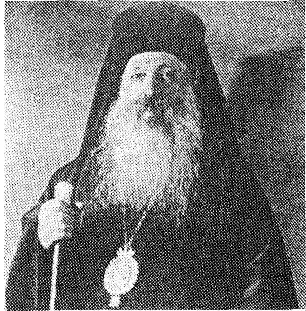
Ὁ Ἀρχιεπίσκοπος Ἀθηνῶν Χρυσόστομος Παπαδόπουλος († 1938) ἰδρυτὴς τοῦ Θεολογικοῦ Οἰκοτροφείου.

«Τῇ παρελθούσῃ Παρασκευῇ (31 Δεκ.) τῇ προσκλήσει τῶν θεολόγων φοιτητῶν τοῦ ἐν τῇ ἱερᾷ μονῇ Ἀσωμάτων Πετράκη ἐγκατεστημένου θεολογικοῦ οἰκοτροφείου συνεκεντρώθησαν περὶ ὥραν 6 μ.μ. ἐν τῷ ἡντρεπισμένῳ ἐστιατορίῳ τῆς μονῆς ὁ Μακαρ. Ἀρχιεπίσκοπος Ἀθηνῶν κ. Χρυσόστομος, οἱ Καθηγηταὶ τῆς Θεολογικῆς Σχολῆς τοῦ Πανεπιστημίου, τὸ ἡγουμενοσυμβούλιον τῆς μονῆς καὶ ἄλλοι κεκλημένοι διὰ τὴν τελετὴν τῆς «βασιλόπηττας». Μετὰ προσφώνησιν ἐνὸς τῶν φοιτητῶν ὁ Μακ. Ἀρχιεπίσκοπος, ὁ Κοσμητὴρ τῆς Θεολογικῆς Σχολῆς καὶ ὁ Προκοσμητὴρ αὐτῆς ἐτόνισαν τὴν μεγάλην σημασίαν τοῦ ἀρτι-