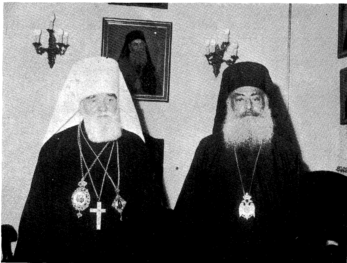
Ο Σεπτός Προκαθήμενος τῆς Ἐκκλησίας τῆς Ἑλλάδος Ἀρχιεπίσκοπος Ἀθηνῶν καὶ πάσης Ἑλλάδος κ. Σεραφεῖμ μετὸν Σεπτὸ Προκαθήμενο τῆς Ὁρθοδόξου Ἐκκλησίας τῆς Τσεχοσλοβακίας κ. Δωρόθεον κατὰ τὴν πρόσφατον ἐπίσημον ἐπίσκεψιν τοῦ δευτέρου εἰς Ἀθήνας (2-7 Νοεμβρίου 1985).

ΕΠΙΣΗΜΟΣ ΕΠΙΣΚΕΨΙΣ ΤΟΥ ΣΕΠΤΟΥ ΠΡΟΚΑΘΗΜΕΝΟΥ ΤΗΣ ΟΡΘΟΔΟΞΟΥ ΕΚΚΛΗΣΙΑΣ ΤΗΣ ΤΣΕΧΟΣΛΟΒΑΚΙΑΣ Κυρίου ΔΩΡΟΘΕΟΥ ΕΙΣ ΤΗΝ ΕΚΚΛΗΣΙΑΝ ΤΗΣ ΕΛΛΑΔΟΣ (2-7 ΝΟΕΜΒΡΙΟΥ 1985)