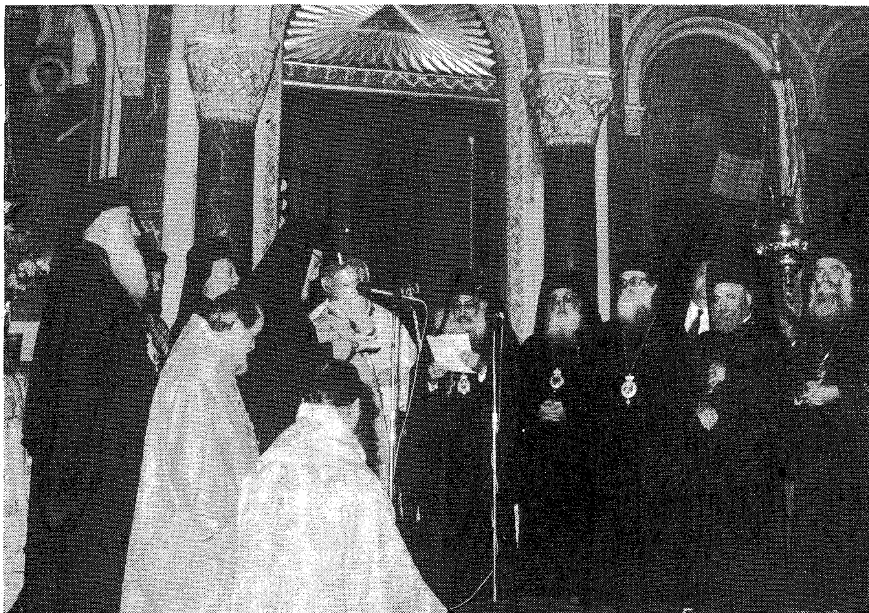
Ὁ Μακ. Ἀρχιεπίσκοπος Ἀθηνῶν καὶ πάσης Ἑλλάδος κ. Σεραφεῖμ προσφώνεῖ τὸν Μακ. Μητροπολίτη Πράγας κ. Δωρόθεο στὸν Καθεδρικὸ Ναὸ Ἀθηνῶν τὴν Κυριακὴ 3 Νοεμβρίου 1985 κατὰ τὴν Θεῖαν Λειτουργίαν.

Ὡστε, Μακαριώτατε, κλῆρος καὶ λαός, ἐν μικρογραφία μὲν, ἀλλὰ, ἐν ἐννοίᾳ πληρότητος τῆς ἐπιγῆς Ἀγίας τοῦ Χριστοῦ Ἐκκλησίας, πρὸς τὸν Θεῖον Αὐτῆς Δομήτορα, τὴν Ἀγίαν Ἀναφορὰν προσάγον-