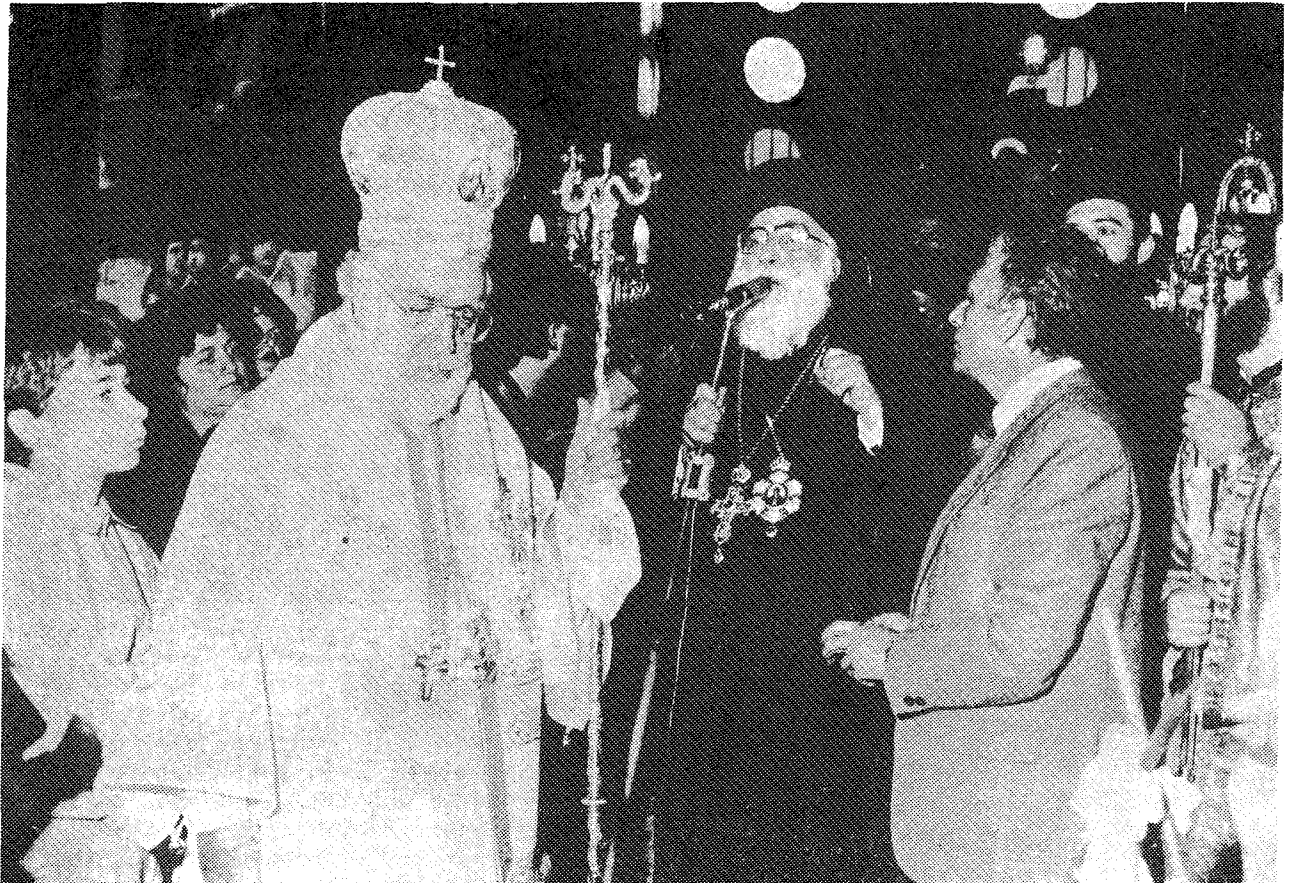
Ὁ Σεβ. Μητροπολίτης Μυτιλήνης κ. Ἰάκωβος ἀντιφωνεῖ, ἔχων εἰς τὰ δεξιὰ αὐτοῦ τὸν Σεβ. Ἀρχιεπίσκοπον Β. καὶ Ν. Ἀμερικῆς κ. Ἰάκωβον.