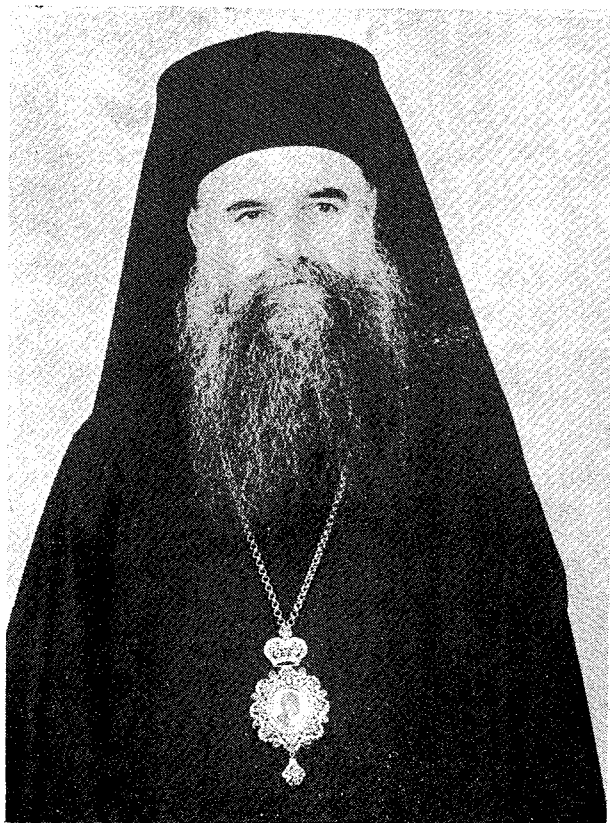
Ὁ Σεβασμιώτατος Μητροπολίτης Καστορίας