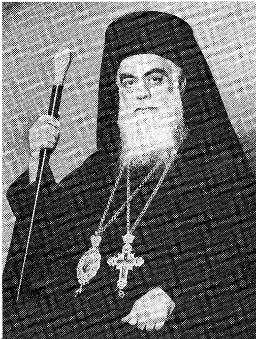
Ό άείμνηστος Μητροπολίτης Κίτρος κυρός Βαρνάβας, πρώτος Διευθυντής του Οικοτροφείου (1950).

Πρώτος Διευθυντής διορίστηκε ό Άρχιμανδρίτης Βαρνάβας Τζωρτζάτος (ό μετέπειτα Μητροπολίτης Κί-