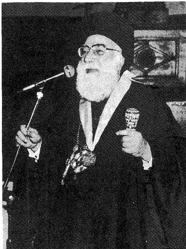
Ὁ Σεβ. κ. Ἰάκωβος ἀπκντᾶ εἰς τὴν προσφώνησιν τοῦ Σεβ. Ἀμερικῆς.

Ταῦτα πάντα διαμορφώνουν τὴν πολυδιάστατον τοῦ ὀρθοδόξου ἐπισκόπου αὐτοσυνειδησίαν, περὶ τῆς ἐν τῇ Ἐκκλησίᾳ τοῦ Θεοῦ θέσεώς του καὶ διακονίας του. Ὁ ἐπίσκοπος ἦτο, εἶναι καὶ θὰ παραμένῃ «ὁ ἡγούμενος τῆς Εὐχαριστίας» 11 . Τὸ ἔργον τοῦ ἐπισκόπου, τονίζει σύγχρονος διακεκριμένος ἐκκλησιαστικὸς ἱστορικός, ἦτο ἐξ ἀρχῆς λειτουργικόν, συνιστάμενον εἰς τὴν προσφορὰν τῆς Θ. Εὐχαριστίας 12 . Παραλλήλως, ὁμοῦς, ὁ ἐπίσκοπος εἶναι καὶ ὁ ποιμὴν, ὅστις τὸ ἀπολωλὸς ἐκζητεῖ, τὸ ἀσθενὲς ἐνισχύει, τὸ ἰσχυρὸν φυλάσσει 13 . Ὁ