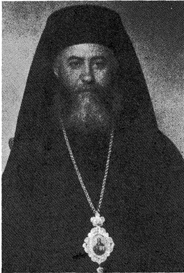
Ο άξιμνητος Μητροπολίτης Φωκίδος Χρυσόστομος.

κεσαν διά τας άπαραιτήτους έτοιμασίας και διατηνώσεις.