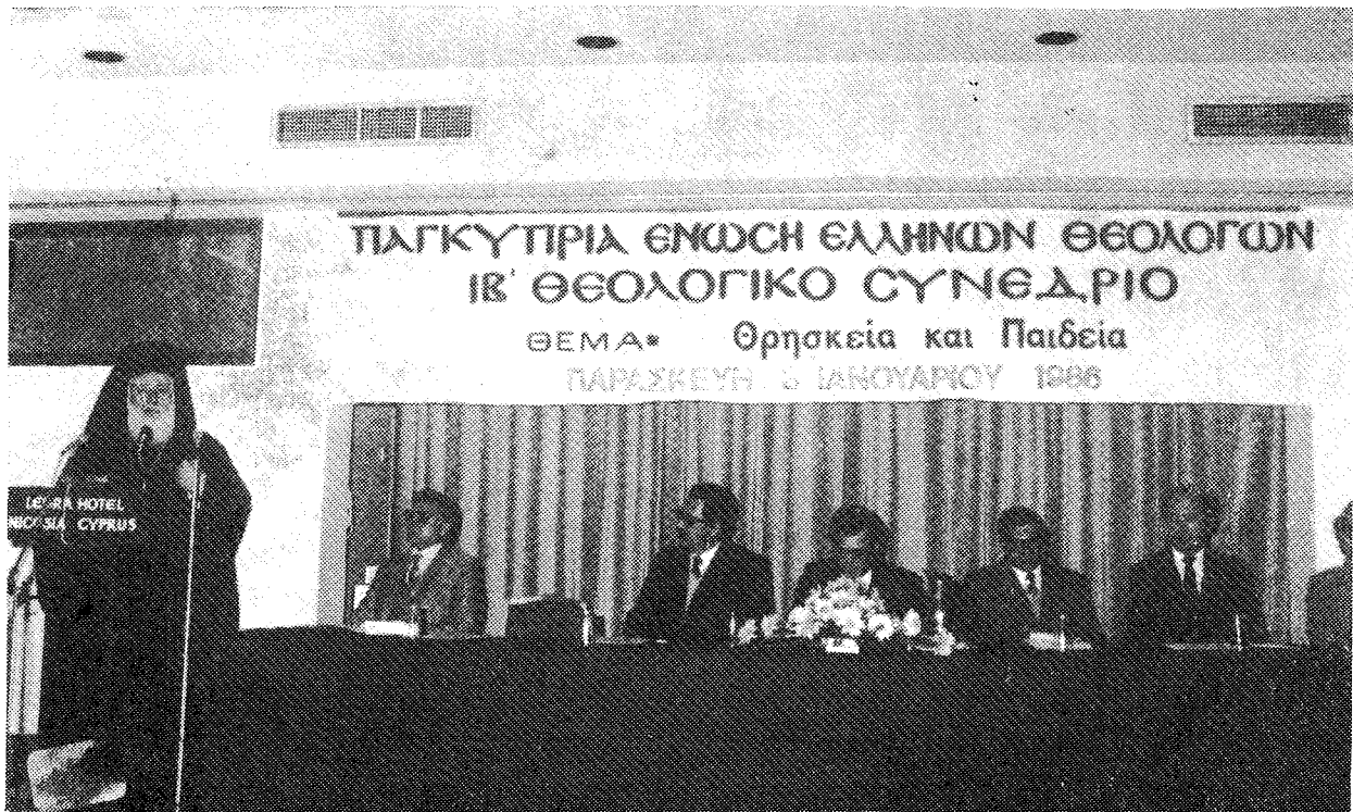
Χαιρετισμός και κήρυξις τῶν ἐργασιῶν τοῦ ΙΒ' Συνεδρίου τῆς «Παγκύπριας Ἐνώσεως Ἑλλήνων Θεολόγων» ἀπὸ τὸν Μακαριώτατο Ἀρχιεπίσκοπο Κύπρου κ. Χρυσόστομο.

τητα, γιατί μόνο ἔτσι θὰ δημιουργήσει τοὺς ἀνθρώπους μὲ τὸ ἀνώτερο ἦθος, τὸ ψυχικὸ δυναμισμό καὶ τὶς ὑψηλὲς ἐφάρσεις, ἱκανοὺς νὰ κρατήσουν τὰ λάβαρα τῶν δικαίων καὶ τῶν ἰδανικῶν τῆς πατρίδας μας.