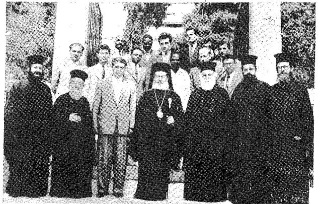
Ὁ Ἀρχιεπίσκοπος Ἀθηνῶν Θεόκλητος († 1962) στὴν εἴσοδο τῆς Ἱερᾶς Μονῆς Πετράκη μὲ τὸν Γενικὸ Διευθυντὴ τῆς Ἀποστολικῆς Διακονίας Καθηγητὴ κ. Α. Φυτράκη, τοὺς Διευθυντὰς καὶ σήμερα Σεβ. Μητροπολίτας Κορίνθου κ. Παντελεήμονα, Θεσσαλονίκης κ. Παντελεήμονα, Σάμου κ. Παντελεήμονα, τοὺς Πρωτοπρ. Ἐμμανουὴλ Μυτιληναῖο καὶ Ἰωάννη Ράμφο, Διευθυντὴ τοῦ Οἰκοτροφείου καὶ τοὺς ἐπὶ πτυχίῳ Οἰκοτρόφους (9 Ἰουνίου 1958).

Ἡ ἔνωσις ἔδωσε μιὰ καλὴ παρουσία γιὰ μερικὰ χρόνια, ἀλλὰ ἀτόνησε καὶ αὐτοκαταργήθηκε.