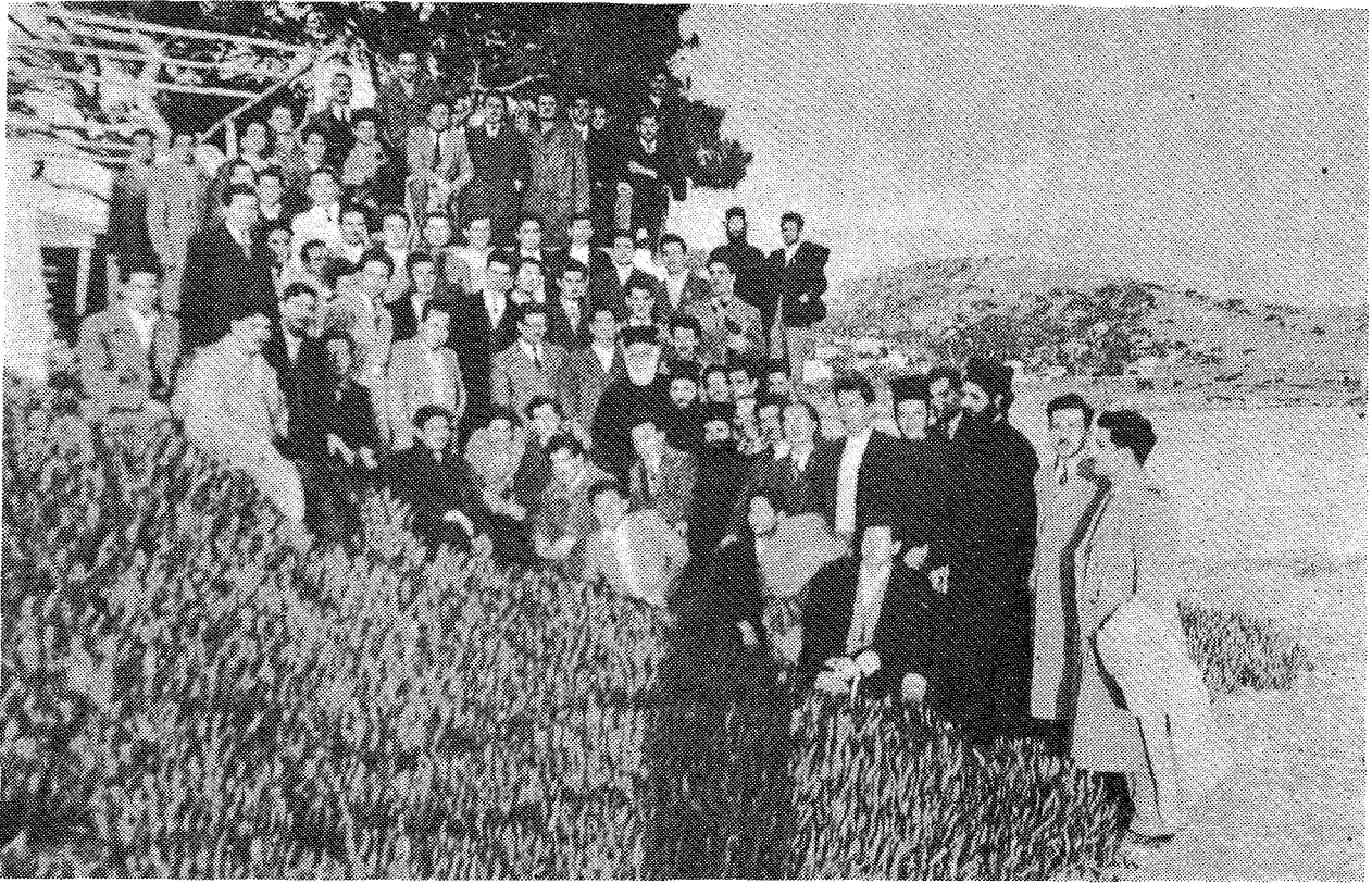
Ἀπὸ ἐκδρομῆ τοῦ Θεολογικοῦ Οἰκοτροφείου στὸ Ὁρφανοτροφεῖο Βουλιαγμένης (1955).