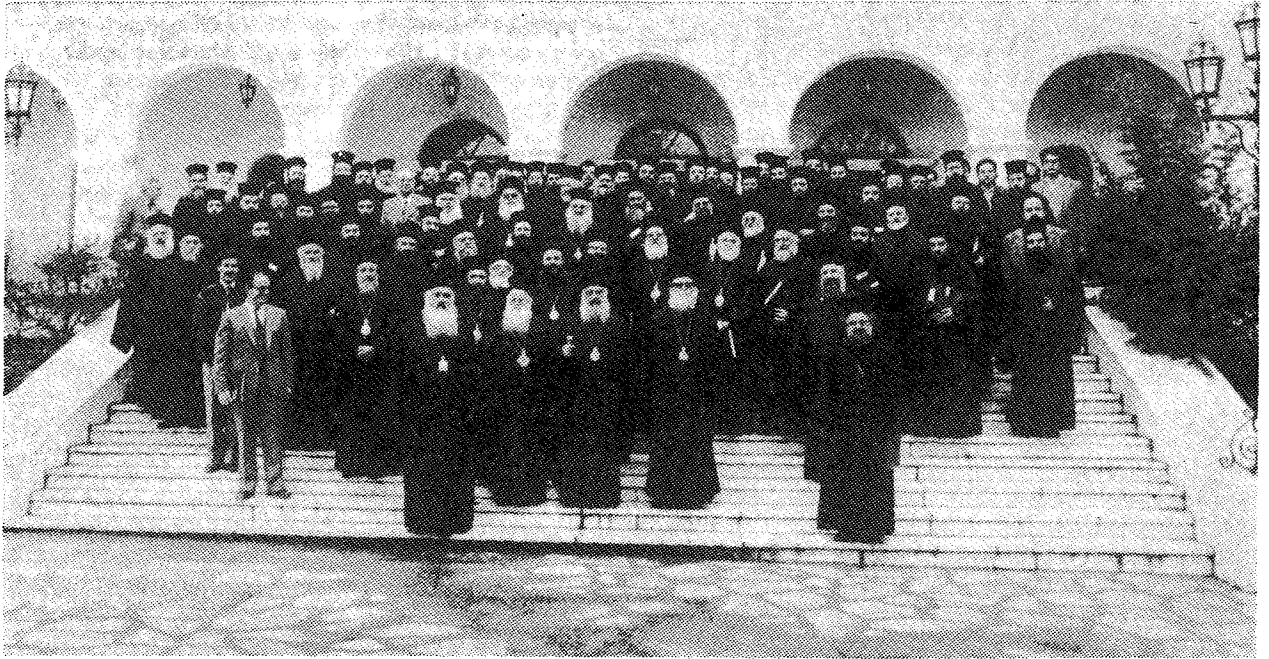
Ὁ Μακ. Ἀρχιεπίσκοπος Ἀθηνῶν καὶ πάσης Ἑλλάδος κ. Σεραφεῖμ, ἐν μέσῳ Σεβ. Συνοδικῶν καὶ Συνεδρῶν.

τῶνται δώδεκα ἐπὶ μέρους τομεῖς τοῦ νεανικοῦ ἔργου, οἱ ὅποιοι σήμερα, κατὰ γενικὴ παραδοχὴ, ἐπικεντρῶνουν τὸ ἐνδιαφέρον ὄλων μας.