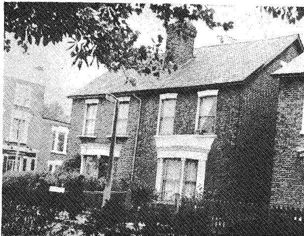
Γηροκομείο της 'Ι. 'Αρχιεπισκοπής Θυατείρων στο WOOD GREEN του Λονδίνου.

Στο περιβάλλον που ζούμε, στην πολυεθνική κοινωνία που διαβιούμε υπάρχει φόβος τα παιδιά μας να μιμηθούν τις άντικοινωνικές ένεργειες των άλλων συνομηλίκων τους και να ένθαρρύνουν στην άπειθαρχία και παρανομία για να προσαρμοστούν στο πνεύμα της έποχής μας.