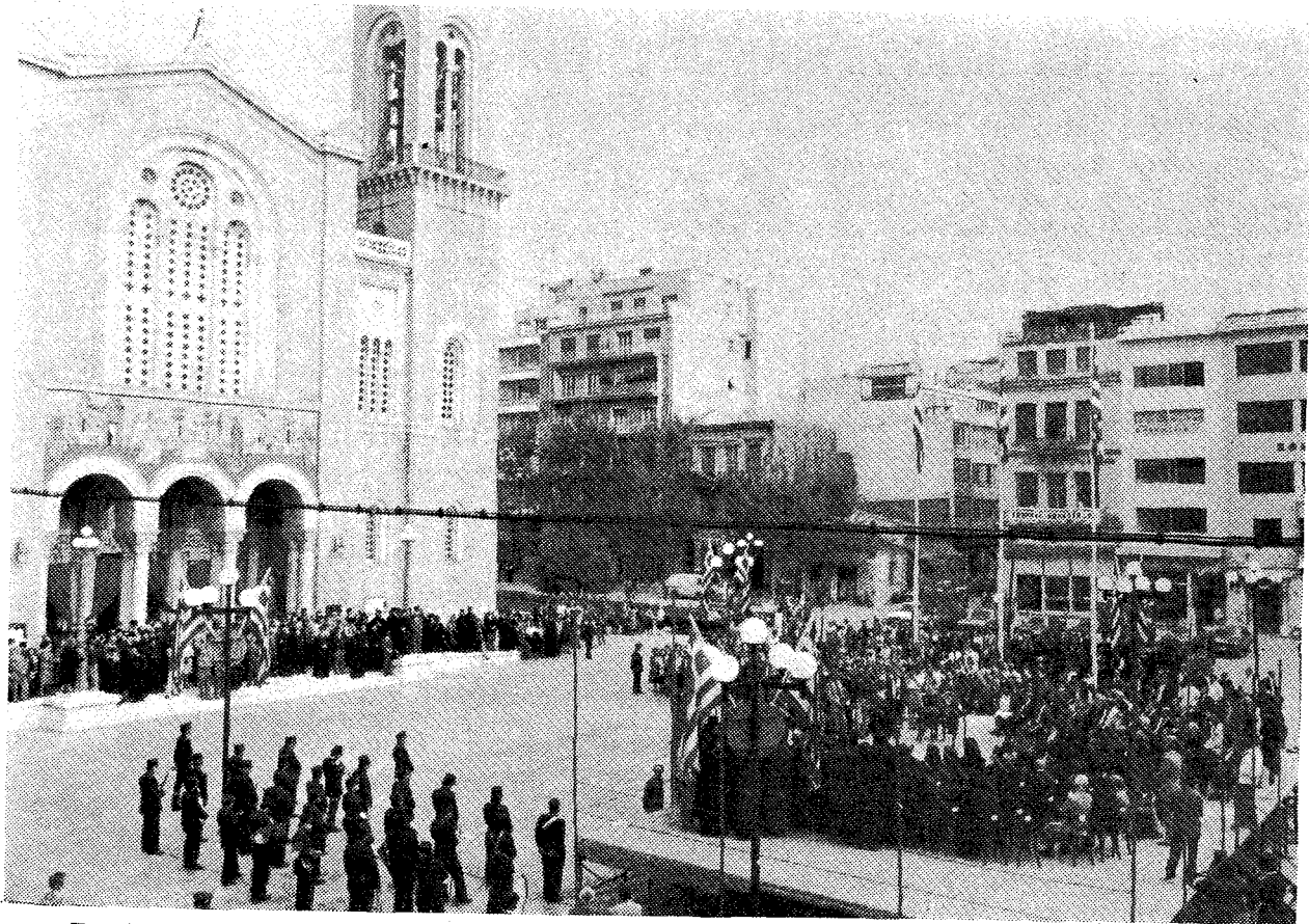
Γενική ἀποψη τοῦ πρὸ τοῦ Καθεδρικοῦ Ναοῦ Ἀθηνῶν χώρου, ὅπου ἔγινε ἡ τελετὴ ἀδελφοποιήσεως Ἀθῆνας καὶ Βηθλεέμ.

'Η στενὴ ἀδελφικὴ σχέση μετὰ τοῦ Ἑλληνικοῦ λαοῦ καὶ τῶν Ἀραβικῶν, ἰδιαίτερος δὲ τοῦ Παλαιστινιακοῦ λαοῦ εἶναι παλαιαί, ὅσον καὶ ἡ ἱστορία καὶ διεδραμάτισαν μεγάλον καὶ κύριον ρόλον εἰς τὴν πραγματοποίησιν τῆς ἐπιστημονικῆς καὶ μορφωτικῆς ἀναγεννήσεως τῆς Εὐρώπης καὶ τοῦ ὑπολοίτου κόσμου, ἰδιαίτερος ὅταν οἱ Ἀραβες μετέφερον τὴν ἀρχαίαν Ἑλληνικὴν μόρφωσιν εἰς τοὺς λαοὺς τῆς Εὐ-