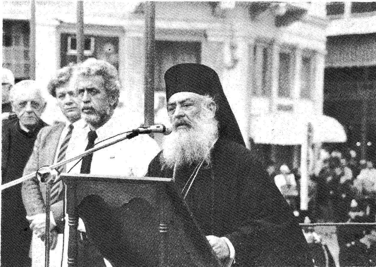
Ὁ Μακ. Ἀρχιεπίσκοπος Ἀθηνῶν καὶ πάσης Ἑλλάδος κ. Σεραφεὶμ ὁμιλεῖ κατὰ τὴν τελετὴ ἀδελφοποιήσεως.

'Η Βηθλεέμ ζεῖ τὴ μεγάλη της ὥρα κάθε χρόνο, τὰ Χριστούγεννα (μετὸ παλαιὸ ἡμερολόγιο, πού ἀκολουθεῖ τὸ Πατριαρχεῖο), ὅταν μέσα σ' ἓνα «πανδαιμόνιο», ἀν ἐπιτρέπεται ἡ λέξη, πού δημιουργοῦν δεκάδες φιλαρμονικὲς προσκοπικῶν σωμάτων Χριστιανῶν νέων, πού εἰσελαύνουν παρατεταγμένοι κατὰ ὀμάδες στήν πλατεία τῆς βασιλικῆς τῆς Γεννήσεως, φτάνει ὁ Μακαριώτατος Πατριάρχης 'Ιεροσολύμων μετὲ τιμητικὴ φρουρὰ 'Ισραηλινῶν ἐφίππων ἀστυνομικῶν, γιὰ νὰ ψαλεῖ στὸν ἱστορικὸ Ναὸ ὁ μέγας ἐσπερινός. 'Απὸ νωρὶς πλῆθος προσκυνητῶν καὶ γηγενῶν μετὲ ἐπικεφαλῆς τὸ ἱερατεῖο, πού ἔχει ντυθεῖ μετὰ καλύτερα ἄμφιά του, ἀναμένει τὴν ἀφιξὴ τοῦ Προκαθημένου τῆς Σιωνίτιδος 'Εκκλησίας, πού μετὰ ἀπὸ λίγο κάτω ἀκριβῶς, ἀπὸ τὸ σπήλαιο τῆς Γεννήσεως, θ'